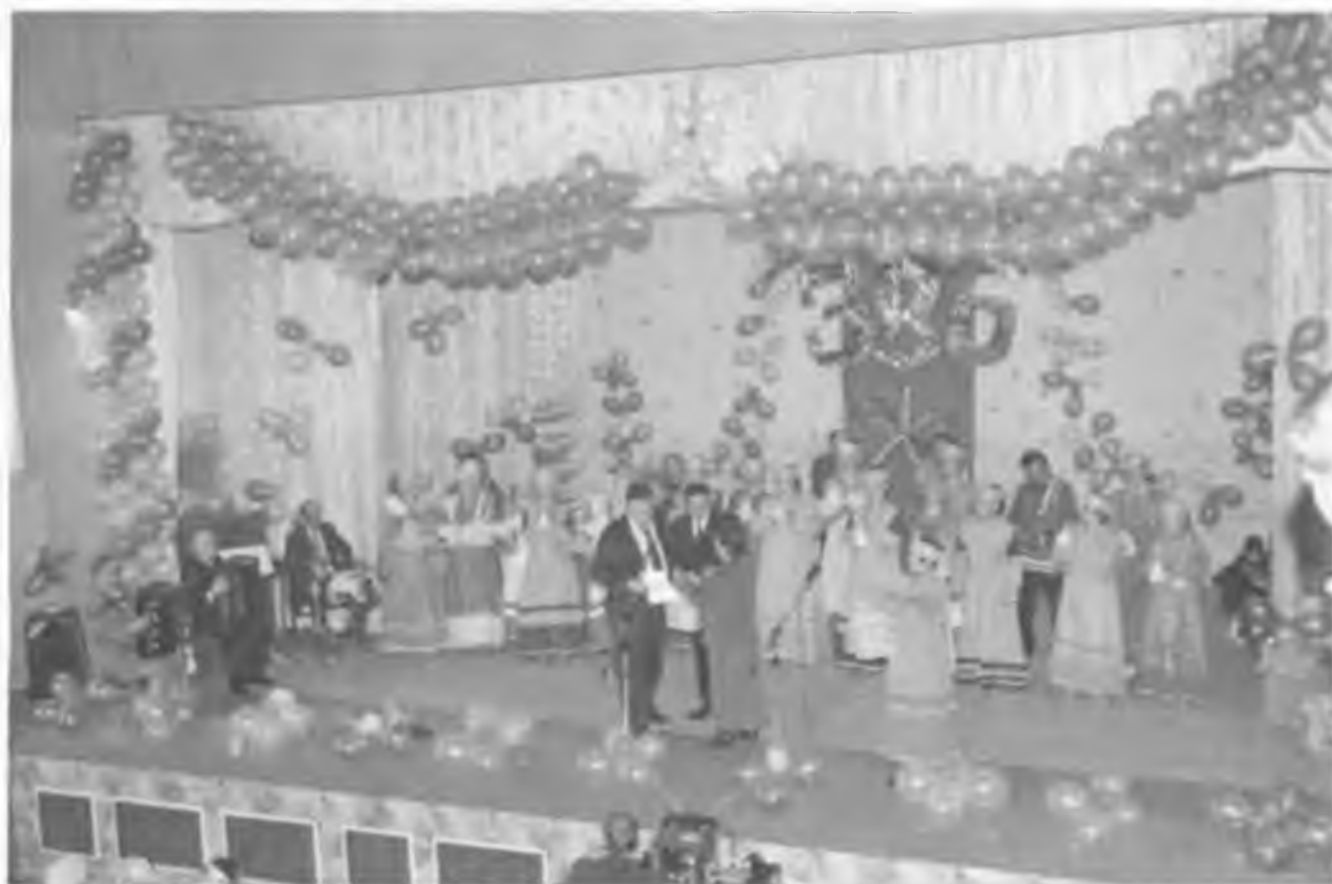
На юбилее 385-летия села Покровского хор был в почете. 2006 г.