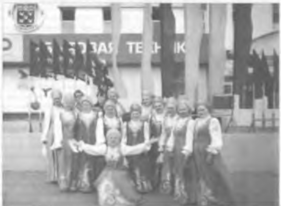
В городе Чебоксары

Финал фестиваля завершился театрализованным шествием. По главному проспекту города более двух с половиной часов в сторону фестивальной площадки шли артисты всех коллективов, приехавших