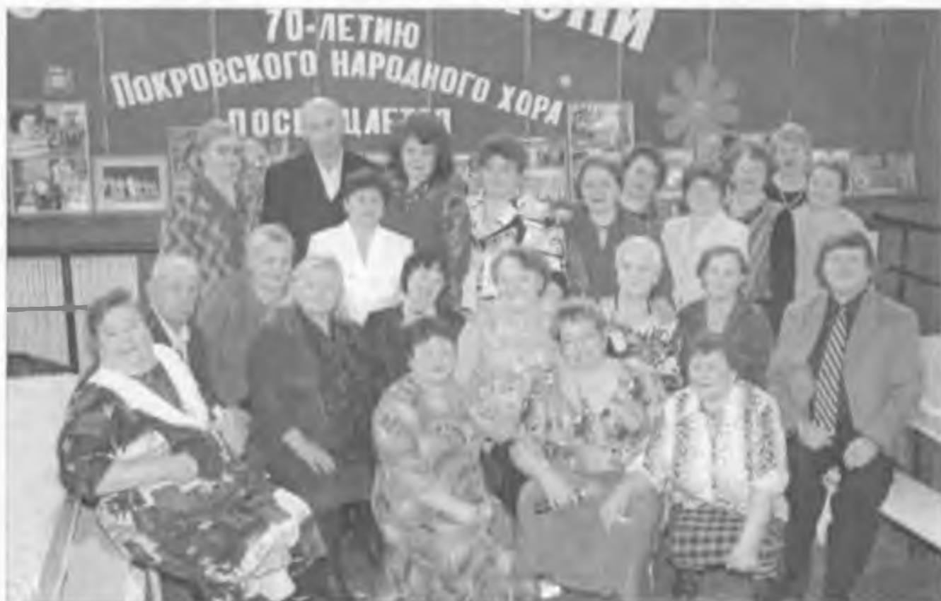
Чествование ветеранов хора. Январь, 2008 г.