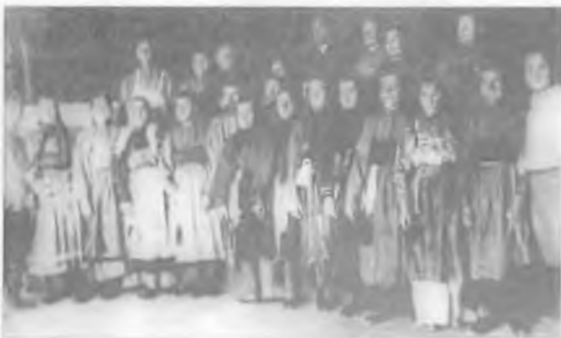
Участники драматического кружка при Покровском Народном доме. 1936 г.