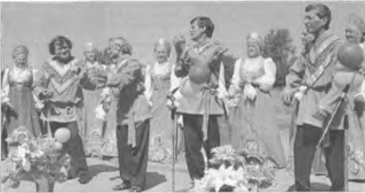
На празднике "День села"

день Покрова Пресвятой Богородицы, стал особым - село отмечало 380-летний юбилей.