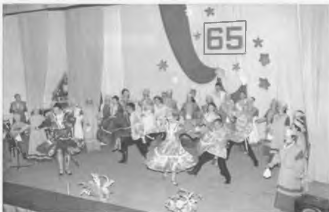
Лихие были тогда танцоры. Хору – 65 лет.