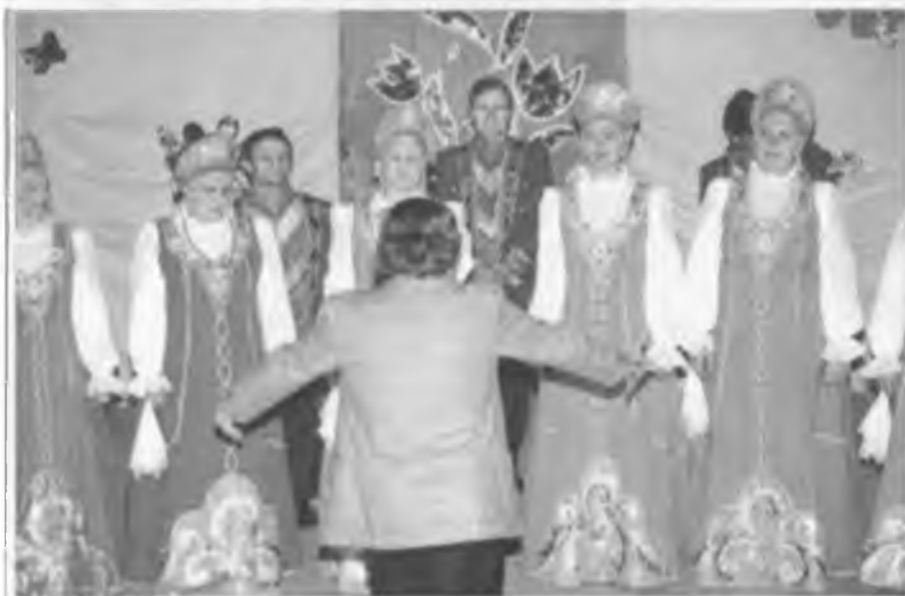
"А ну, воодушевились!" 2007 г.