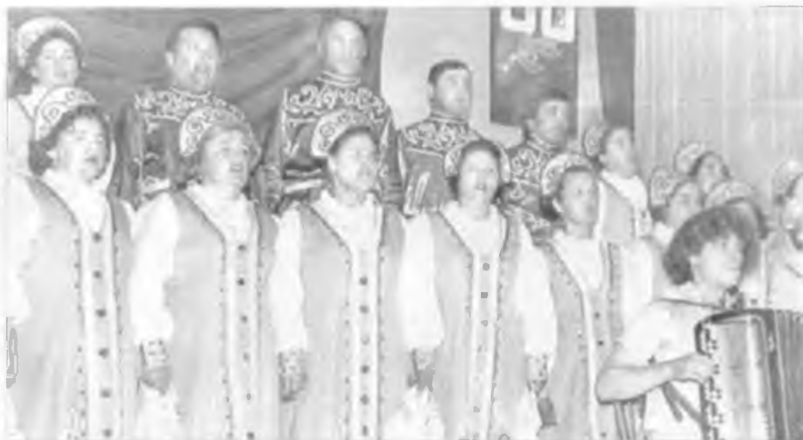
Покровский хор на сцене г. Ирбита