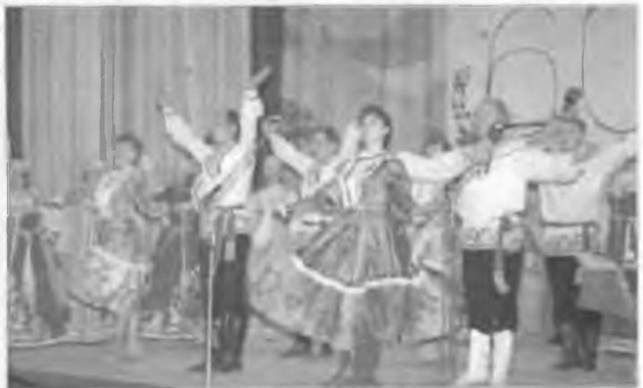
60-летие г. Артёмовского. 1998 г.