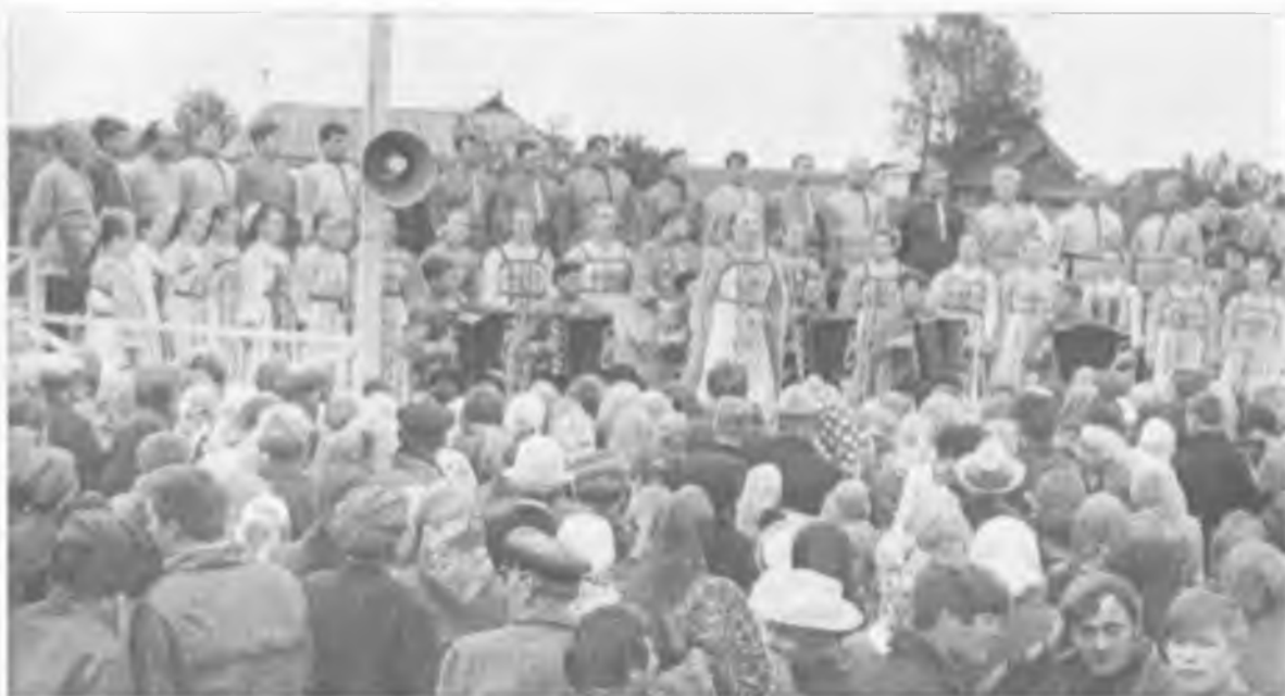
Уральский народный хор на празднике в селе Покровском

же месте выступает Уральский народный хор. Песенный праздник транслировался по московскому телевидению: миллионы людей слушали тогда песни двух замечательных коллективов - Покровского самодеятельного и Уральского Государственного народных хоров, материнский и дочерний песенные коллективы.