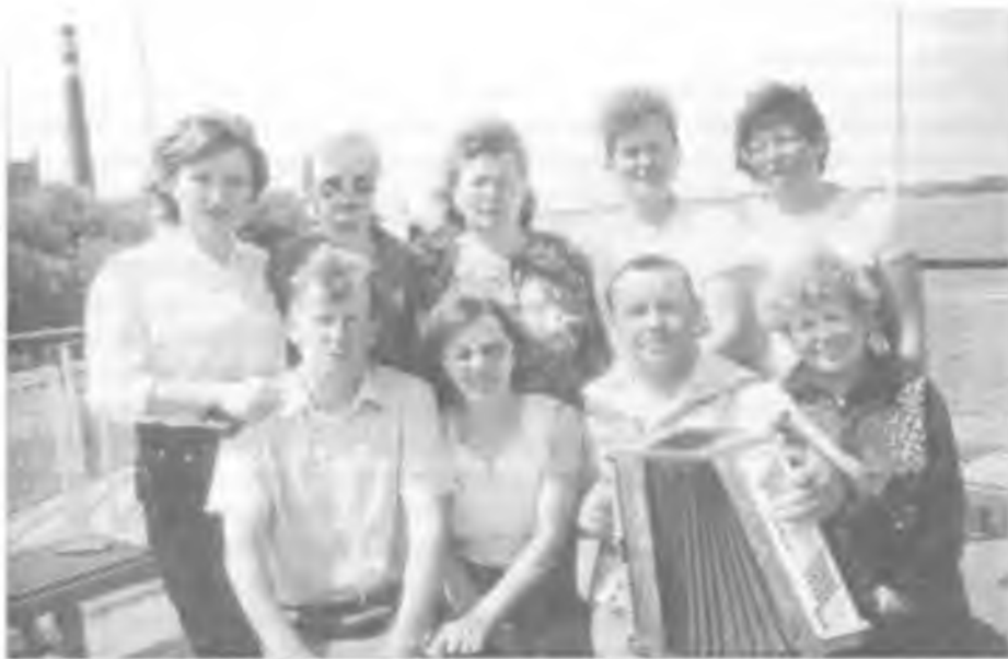
На теплоходе «Павел Бажов»

группа участников хора награждалась туристическими путевками в Санкт-Петербург. А в 1997 году другая группа получила такую премию, что ее надо было не просто получить, а прожить в творческом увлечении любимым делом. Речь идет о награждении туристическими путевками на теплоход «Павел Бажов», курсирующий по маршруту Пермь-Астрахань. Этот круиз для отдыхающих на теплоходе стал особенным. Многократно воспетые русские реки, водная ширь Камы и Волги, овеянные легендами родные русские просторы располагали к песне. И покровчане пели, проводили концерты, организовывали вечера встреч в музыкальном салоне, на палубе, на набережных и зеленых лужайках.