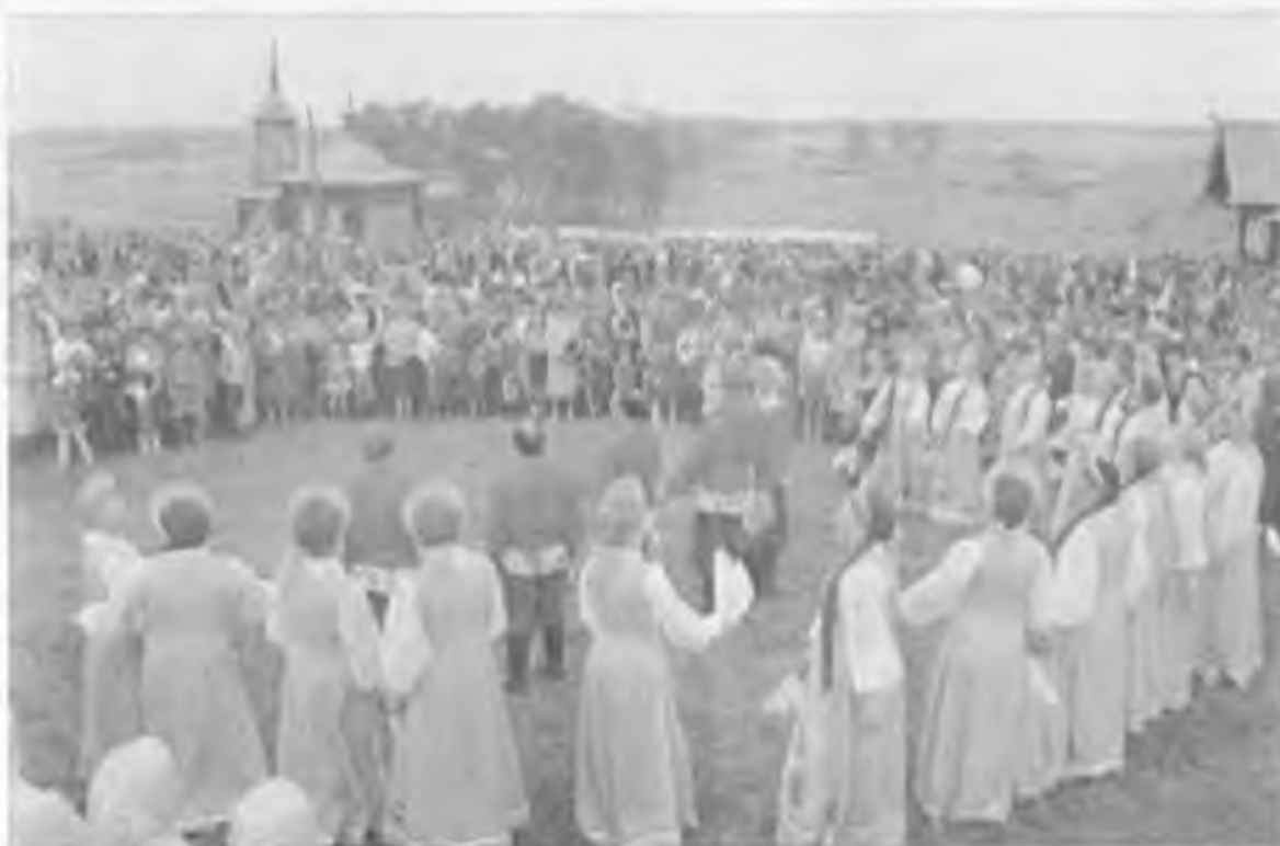
Покровский хор в Нижней Синячихе

уральское поселение на Нейве становится широко известным в России собранием уральской архитектуры, народных росписей и предметов старинного быта. Уникальная коллекция памятников старины привлекает сюда и представителей других народных культур. Стало престижным участие в организуемых здесь праздниках песни, фольклорных собраний, таких, как пропаганда русской гармонике, проведенных известными энтузиастами братьями Заволокиными. Здесь, на одном из таких песенных торжеств, среди шедевров старой русской архитектуры на зеленой центральной площади заповедника на фольклорном празднике выступал и Покровский самодеятельный хор. Директор музея-заповедника И.Д. Самойлов выпустил иллюстрированный альбом. В нем среди других цветных снимков на фоне старых часовен и крестьянских домов, раскинувшейся панорамы живописной уральской природы на берегу Нейвы-реки тысячи алапаевцев и их гостей слушают песни покровчан. 4 За участие в этом празднике хор наградили грамотой Областного управления культуры. В альбоме рядом другой снимок - на том