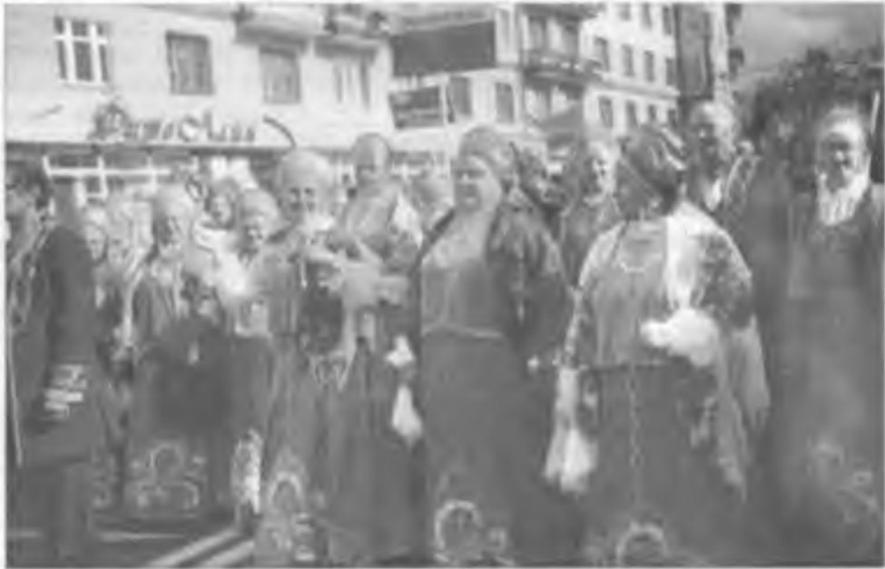
Шествие по городу Чебоксары

на смотр, многие народные творческие коллективы Чувашии, гости, прибывшие на проводимый в этот день праздник - День республики. Большинство в расцвеченных национальных или региональных костюмах. Удивительная красота красок! Море веселых, улыбающихся лиц!