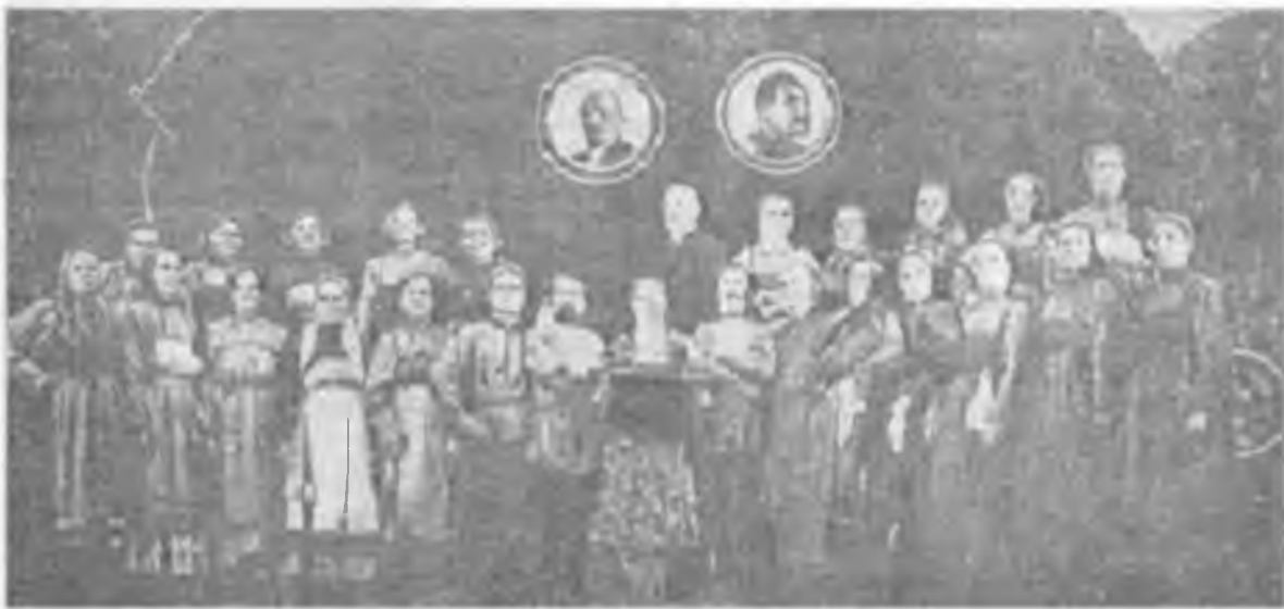
Покровский хор. 1938 год

Пополнив репертуар, хор выступал на концертах, выезжал в соседние села, участвовал в районных смограх. Каждый день, всякую минуту хористки ждали