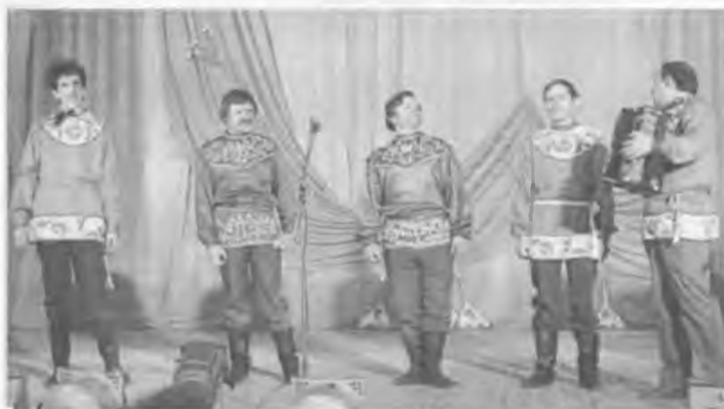
"Мужские страдания". 1991 г.