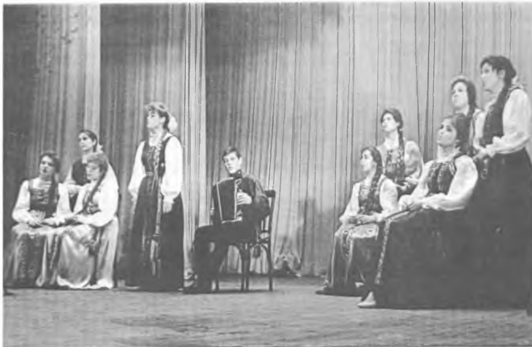
1987 г. Покровский хор на областном смотре художественной самодеятельности. Лирическая картинка „За околицей!“