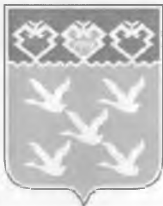
Герб города Чебоксары

Как мы знаем, в нашей области в прошлые годы проведена интересная акция по сохранению природных источников питьевой воды. Не остались в стороне от облагораживания ключей и покровчане. Совсем недалеко от центра досуга, на берегу реки Бобровки известен ключ еще со времен основания села в XVII веке. Здесь когда-то появились первые крестьянские