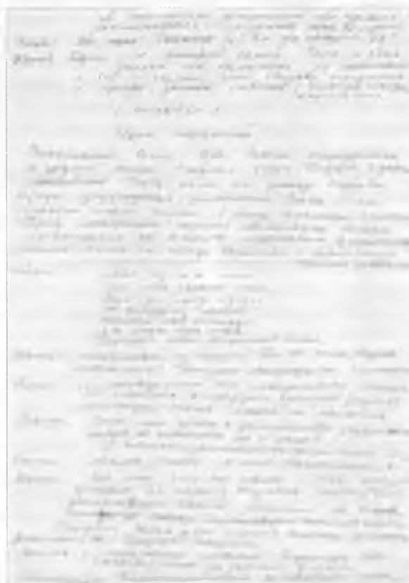
Рукописный текст пьесы «Уральская свадьба»