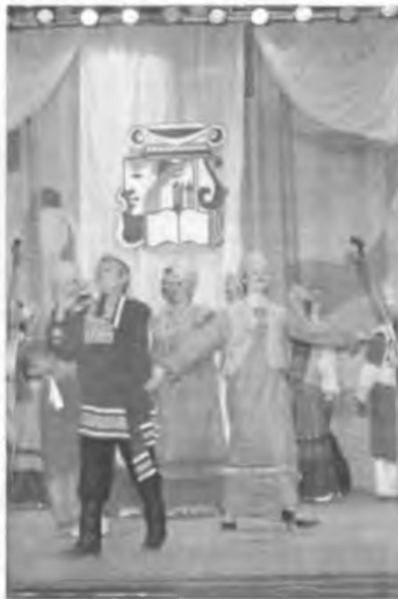
“Хорошо рожок играет, приговаривает...”