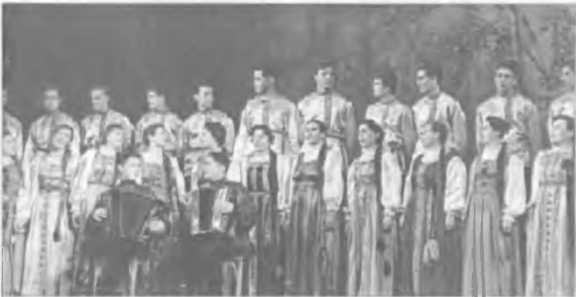
Участники Покровского хора на областном смотре, 1963 г.

в Гражданскую овдовев, одна «подняла» двоих сыновей, одного из них отняла Отечественная война. Ей приходилось самой пахать, сеять и косить, как говаривали на селе, - «воротить всю мужскую работу». Она хорошо знала соху, одной из первых на селе, еще вместе с мужем пробовала первый плуг, удивлялась и радовалась появлению конных косилок, жнеек, сеялок. До тридцати лет даже не слышавшая об электричестве, она постигла грамоту через ликбез на четвертом десятке лет. Судьба распорядилась так, что она пережила обоих сыновей, всех внуков, оставшись куковать свой век на двадцатирублевую пенсию - «одна, как перст, - одинешенька».