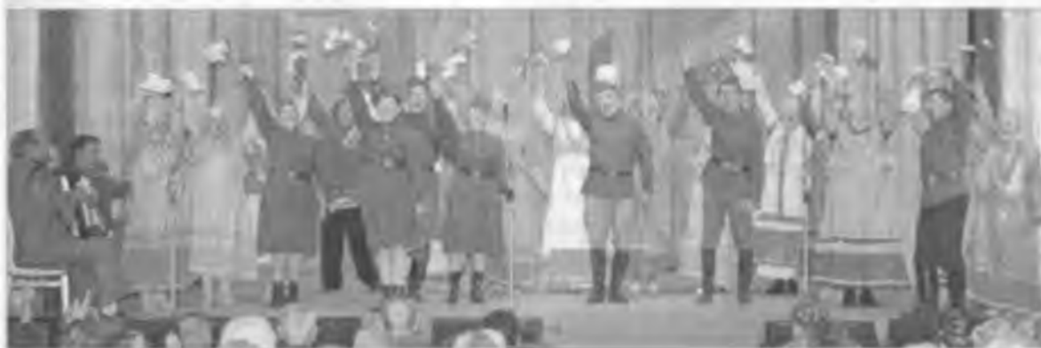
Концерт в подарок ветеранам фронта и тыла. 2005 г.

Зал встретил Покровский хор, представляющий на фестивале агрофирму