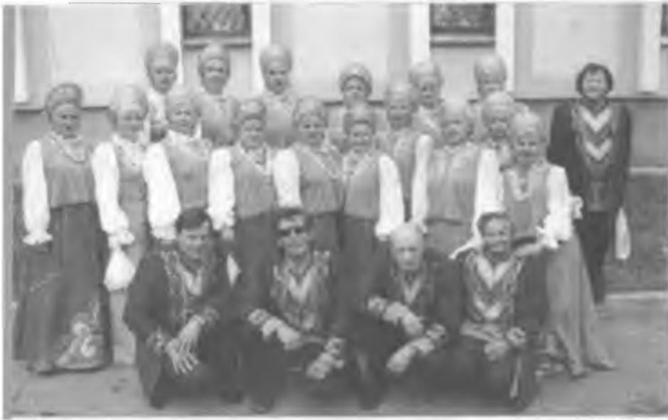
XV Всероссийский фестиваль народного творчества "Родники России" в Чебоксарах. Дипломант фестиваля - Покровский хор. 2007 г.