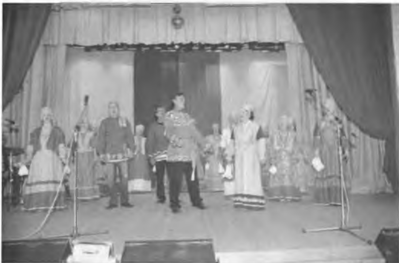
На сцене ДК им. Попова. 2005 г.