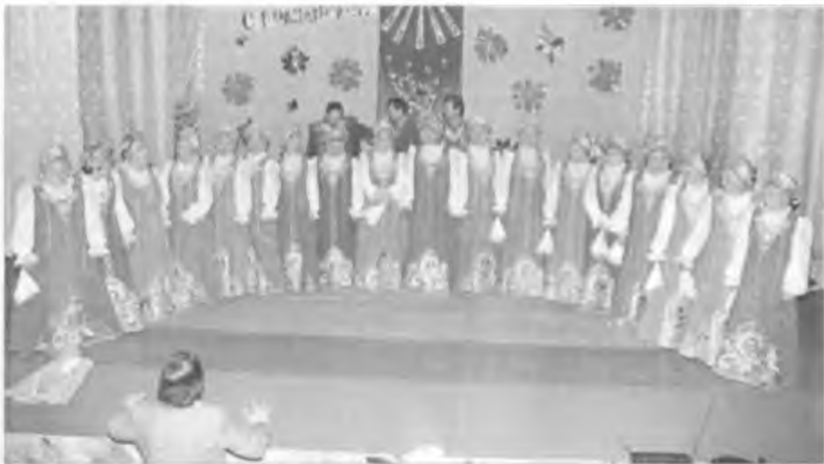
Во время генеральной репетиции

приезжает на село для проведения занятий, репетиций и участия в концертах. Уроженец Винницкой области, он закончил Белгородское музыкальное училище и институт имени Гнесиных в Москве, после чего и был направлен на Урал.