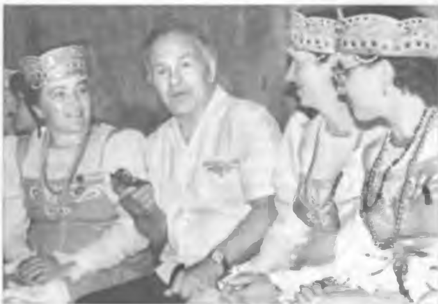
Композитор Е.П. Родыгин в гостях у покровских артистов