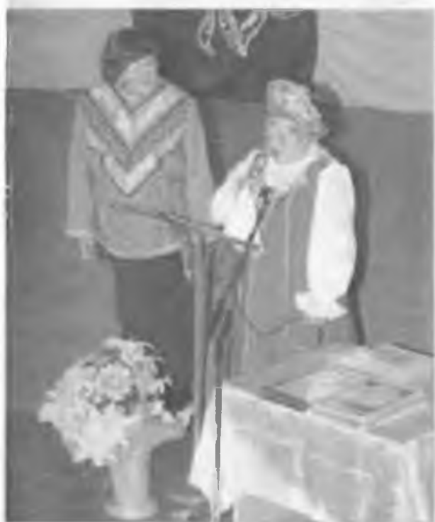
Подводим итоги. 2007 г.