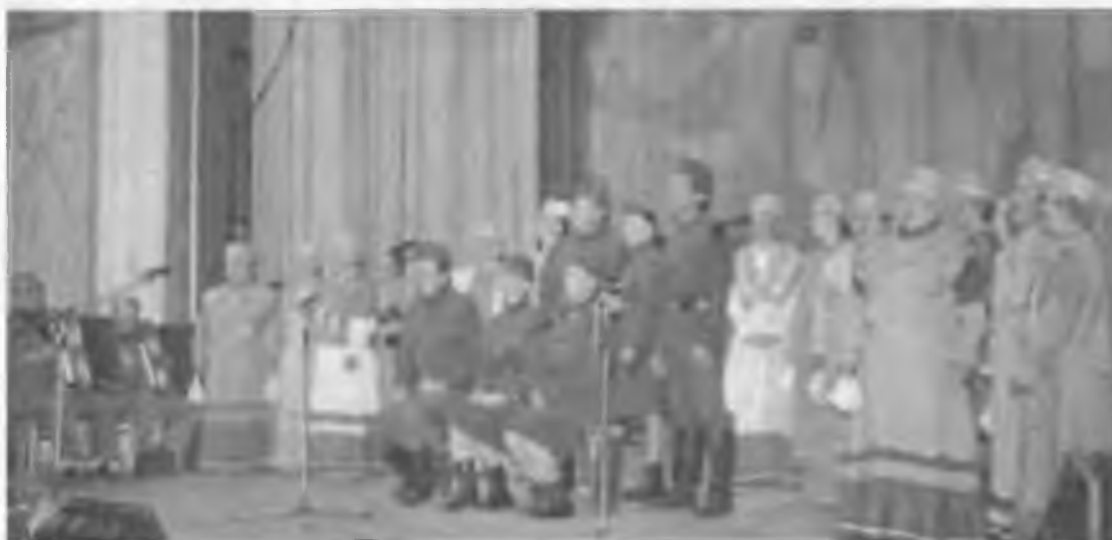
"Соловьи". ДК им. Попова 9 Мая 2005 г.