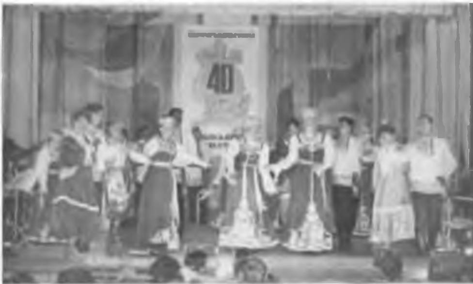
Покровчане на праздновании юбилея музыкальной школы г. Артёмовского