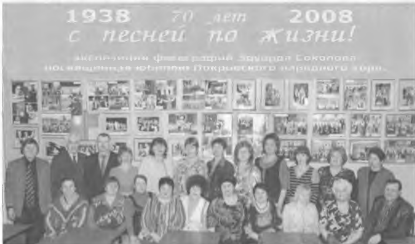
На фотовыставку о себе приехали всем составом. Февраль, 2008 г.