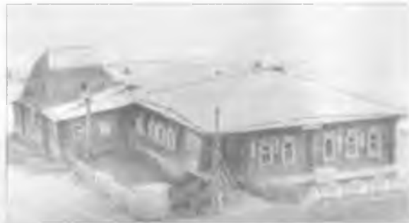
Покровский Народный Дом

Народный дом решили устроить в доме священника, что стоял в центре села. Из четырех бывших «магазинов» (общественных зданий для хранения страхового запаса семенного зерна) пристроили к дому зрительный зал с балконом. Сцену выполнили с высоким куполом, куда легко бы убирались декорации во время спектаклей. Строительство велось усилиями