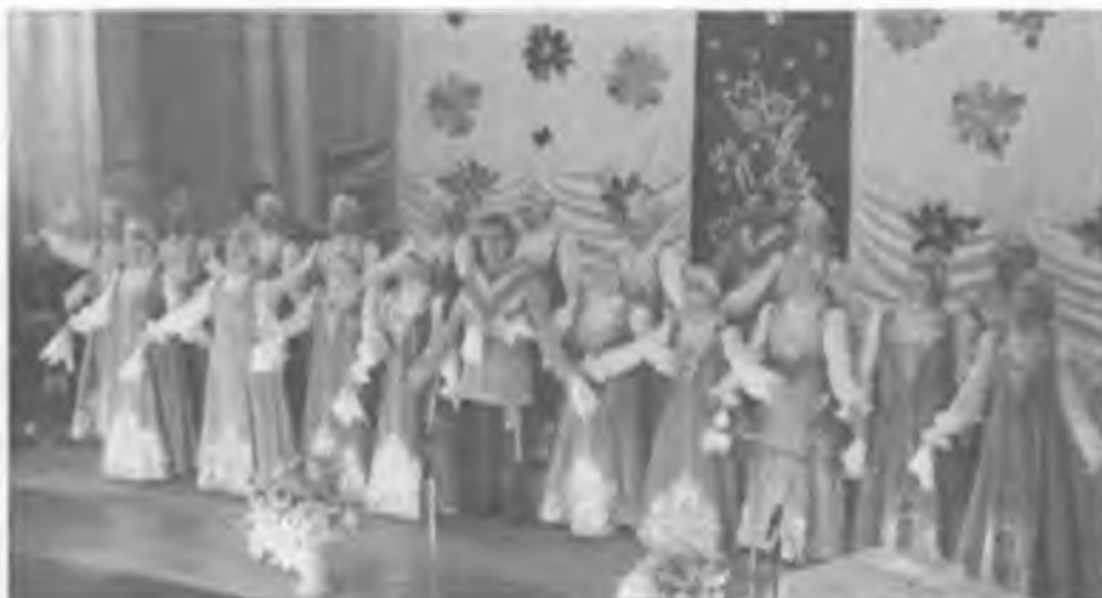
“Пора гостям со двора”. Композиция В.Н. Косюка. 2005 г.