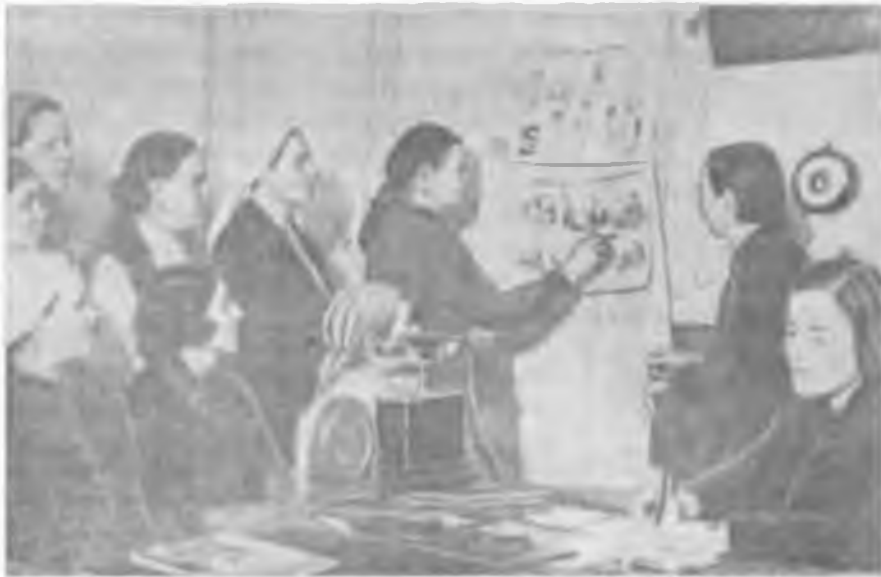
Сдача норм ГСО

звучало слово «война». Все население страны активно осваивает оборонное дело. Юноши, готовясь к предстоящей службе в армии, считали за честь иметь на груди значки «Готов к противохимической защите», «Готов к санитарной обороне». Особенно занимались стрельбой, чтобы получить значок «Ворошиловский стрелок». Не остались в стороне и пожилые участницы хора. Они решили изучать противогаз, оказание первой помощи при ранениях, газовых отравлениях и сдавали нормы на значки «ПВХО» и «ГСО».