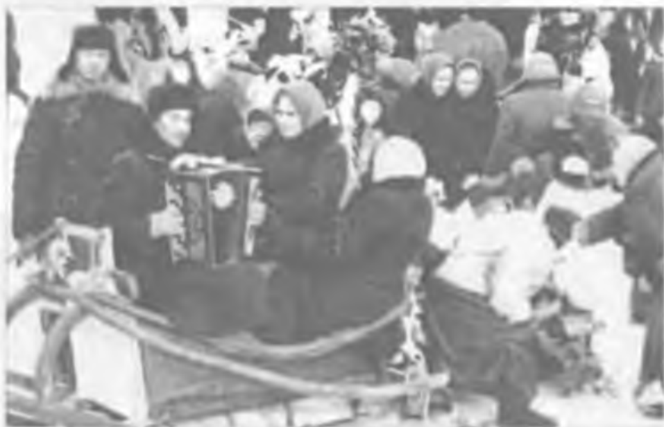
Артисты ПРДК на проводах зимы с. Покровское. 1960 г.