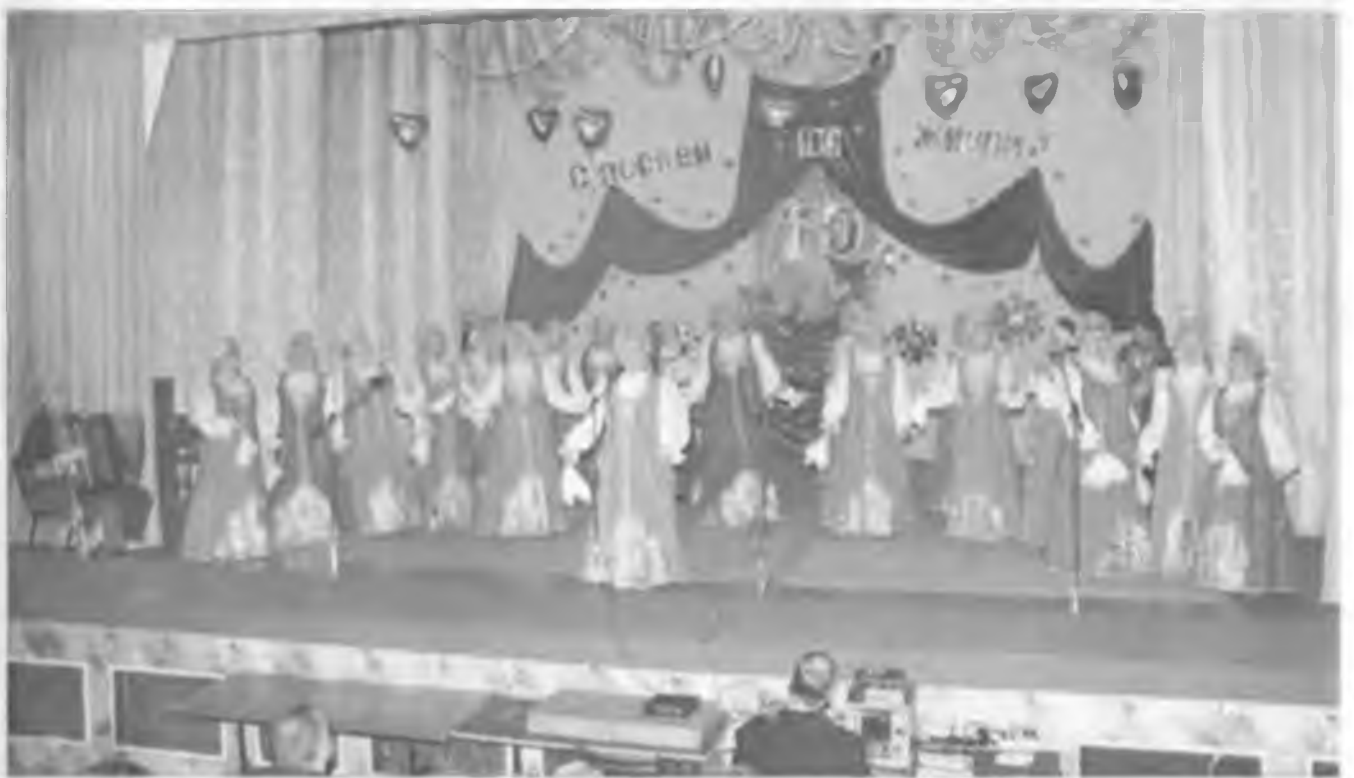
С первых дней юбилейного года началась напряженная работа. Концерт для ветеранов хора. Январь, 2008 г.