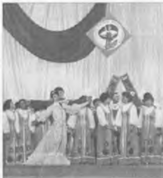
Фестиваль народного творчества

Как отчёт перед односельчанами и гостями праздника, хор исполняет вокально-хореографическую композицию