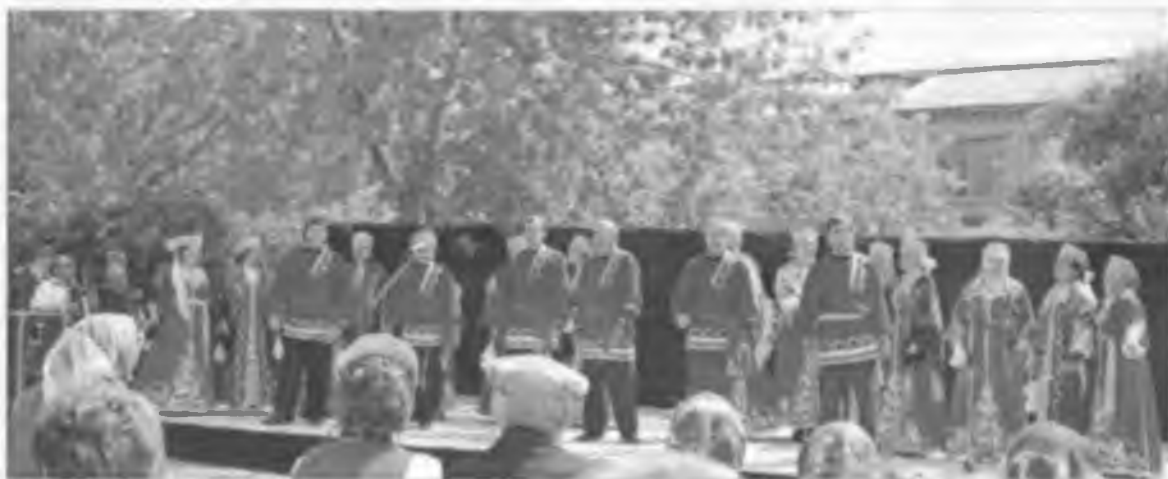
Покровский хор в с. Писанец

Первый престольный праздник двадцать первого века в Покровском начался с торжественной литургии. 14 октября,