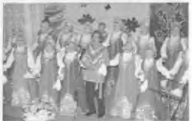
"Сказ об Урале". Композиция В.Н. Косюка. 2007 г.