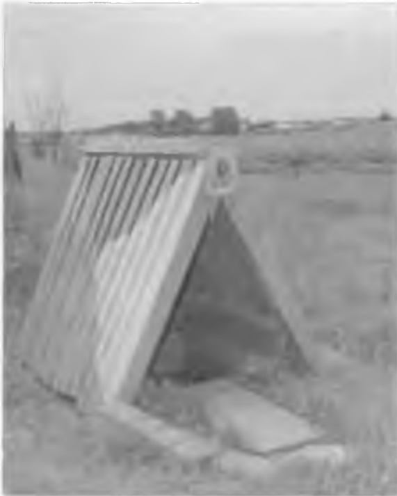
Природный источник "Монашкины слёзы"

избы, возможно, тут же были спеты и первые песни новопоселенцев.