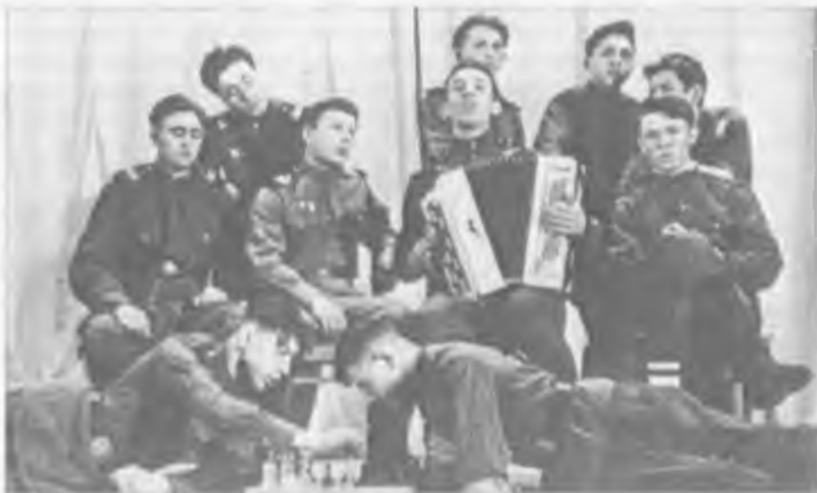
Покровчане на областном смотре. 1960 г.

группе ветеранов, как уже говорилось выше, пришедших на самодеятельную сцену 30 лет назад, присвоены звания лауреатов Межобластного смотра художественной самодеятельности уральских областей. 5