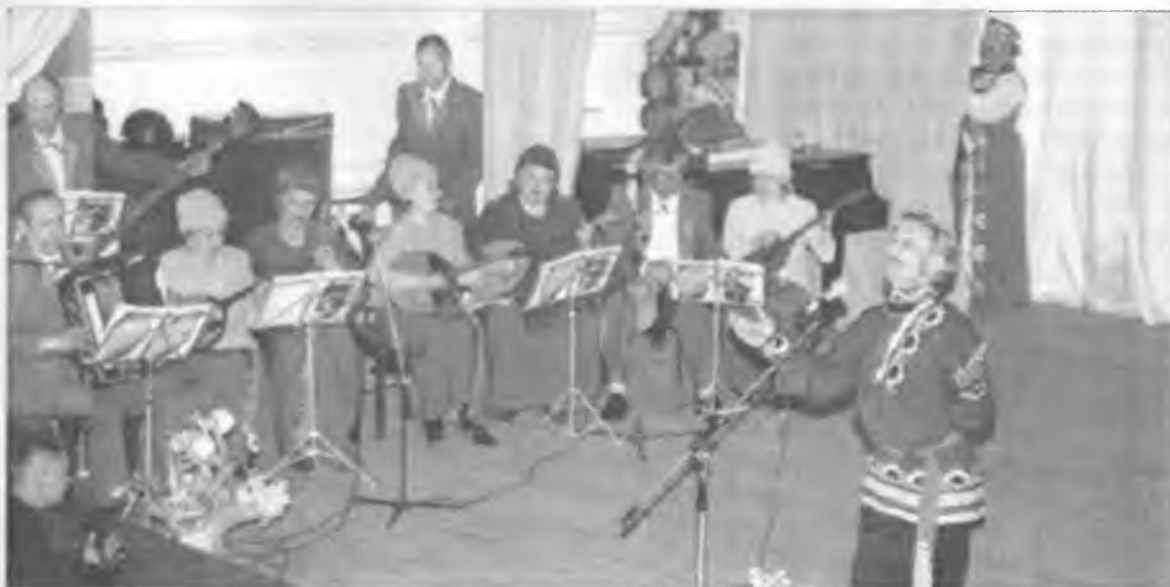
Оркестровая группа хора

После праздника - всегда будни. Для покровских хористов - это, прежде всего,