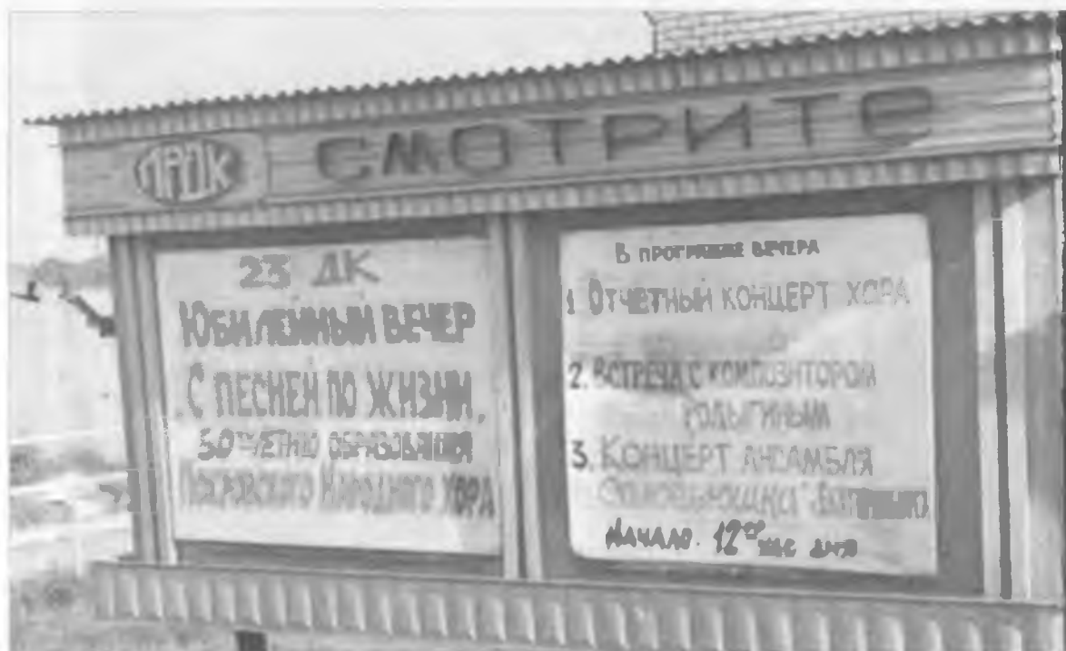
Реклама зазывает на праздник. 1988 г.