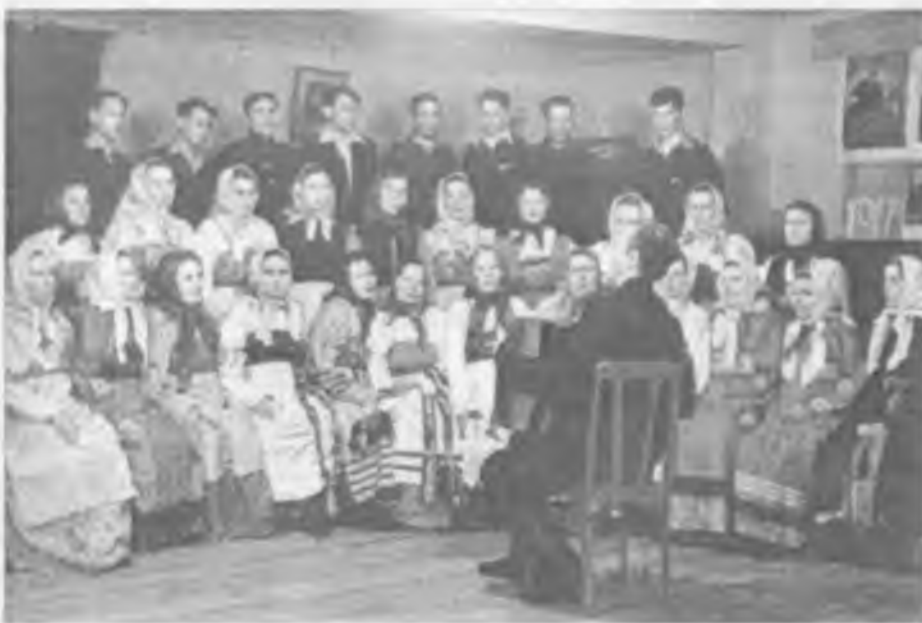
Покровский хор готовится к областному смогру художественной самодеятельности. 1957 г.