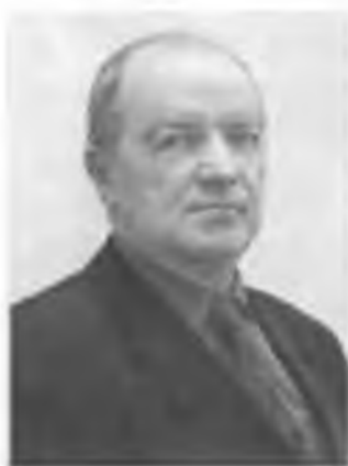
Глава Артемовского городского округа Ю.Н. МАНЯКИН

Жители села Покровского, Артемовского городского округа и всей Свердловской области по праву гордятся своим детищем - Покровским русским народным хором - признанным мастером народного искусства.