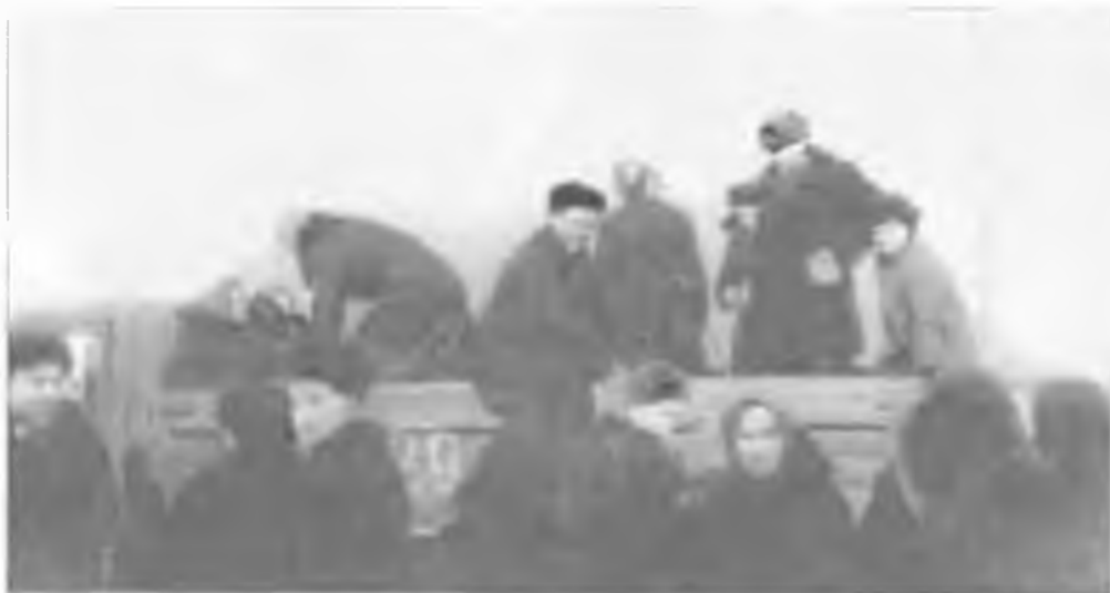
Группа участников художественной самодеятельности ПРДК перед выездом на концерт. 1959 г.