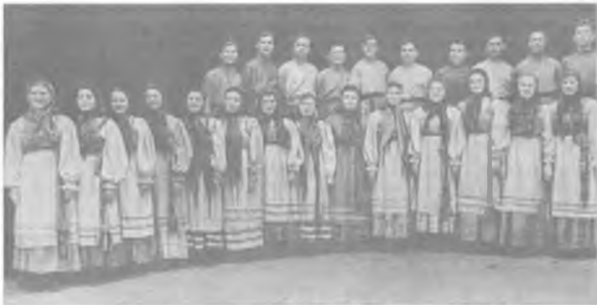
Группа Уральского народного хора

хора и подготовка первой концертной программы». 3