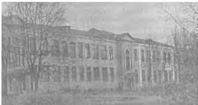
Артемовская городская больница. В 1941-1942 годах в хирургическом отделении больницы располагалось I отделение военного госпиталя № 37-45