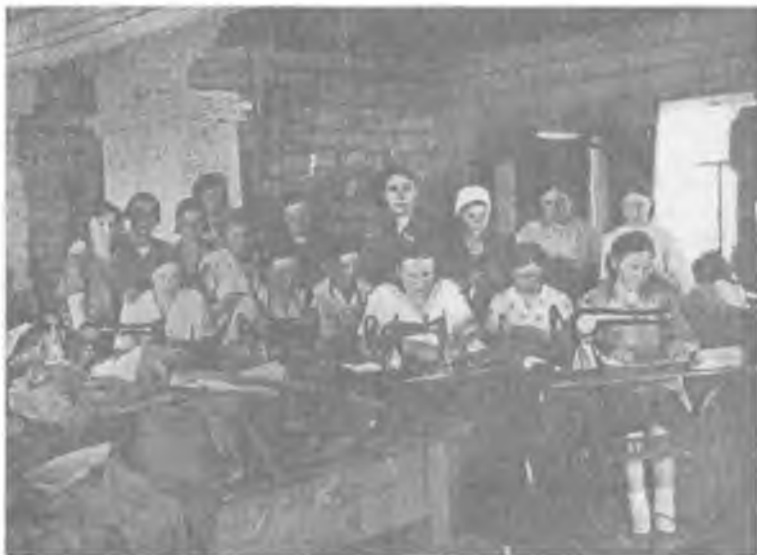
Передовая бригада швейного цеха промартели «Пролетарка». 1943 год.