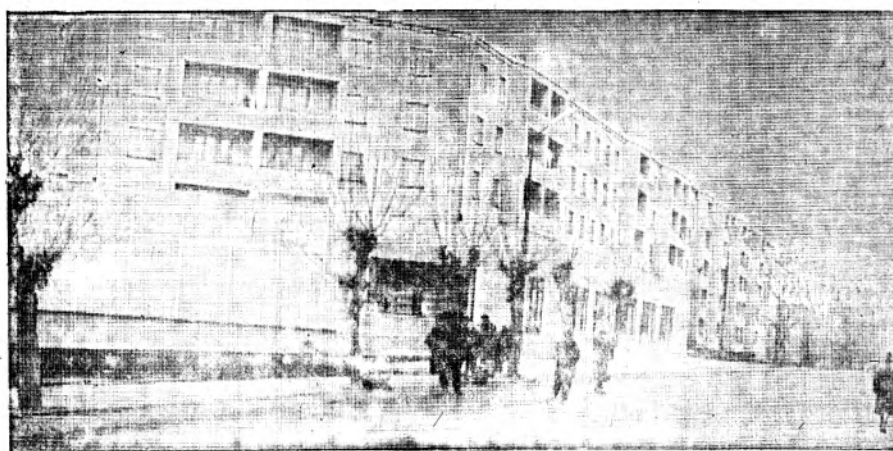
На снимке: новый дом в поселке Буланам.