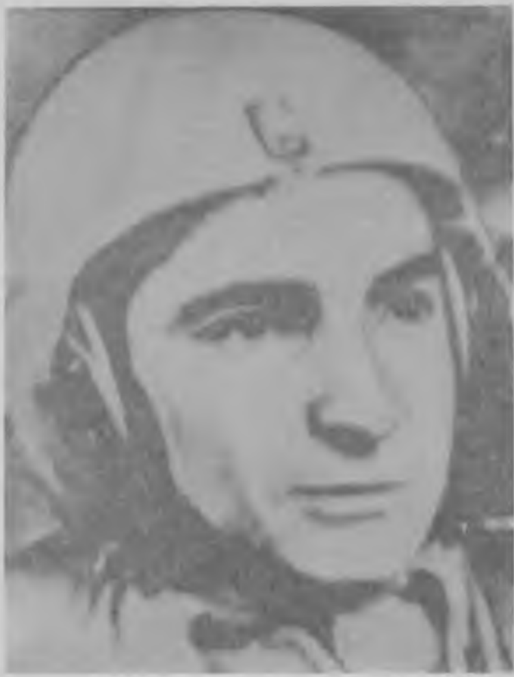
Космонавт-5 Валерий Федорович Быковский в кабине корабля.

через городскую станцию: редактору — 1-117, зам. редактора и секретарю — 0-78, литработникам — 1-90; через кошейский коммутатор: редактору — 2-49 (один звонок), в отдел промышленности — два звонка.