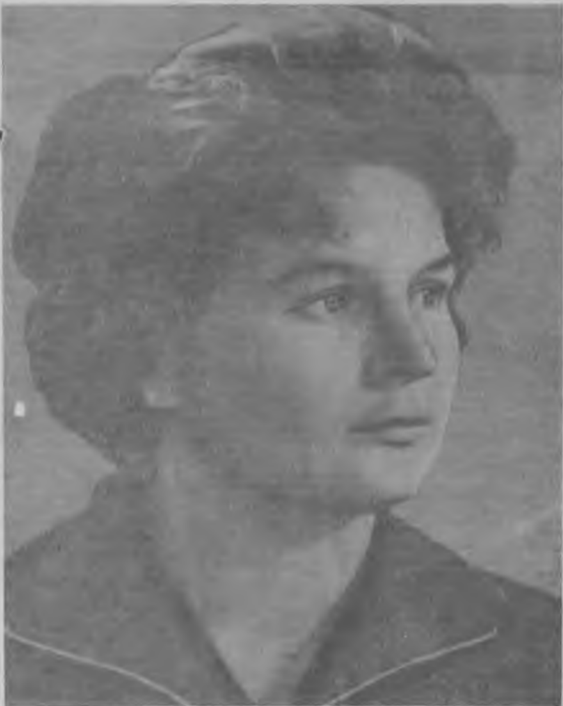
Первая в мире женщина-космонавт Валентина Владимировна Терешкова.