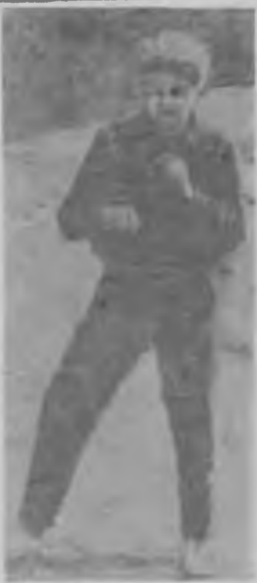
По азимуту.