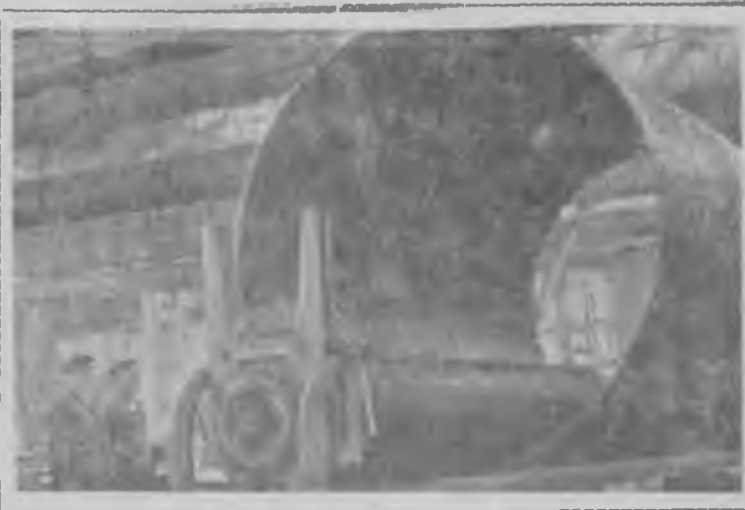
На Сумском машиностроительном заводе имени Фрунзе начал действовать новый агрегат для вальцовки крупногабаритных корпусов химической аппаратуры цилиндрической формы. Внедрение его в производство значительно снижает трудоемкость изготовления корпусов, повышает их качество. НА СНИМКЕ: вальцовка корпуса химической колонны на новом агрегате.