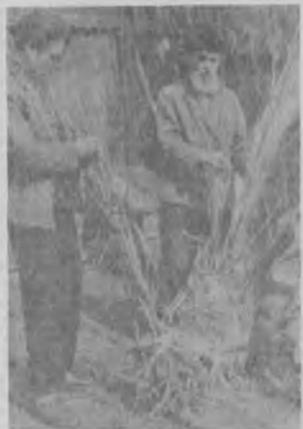
Несколько лет существует в Реже городское общество садоводов. Садов в городе становится с каждым годом все больше. Обеспечить садоводов-любителей посадочным материалом, дать им консультации по садоводству — основные задачи общества. Сейчас в обществе насчитывается до ста человек.

IX Шли годы. Рос поселок новый И отступила вглубь тайга. Был в прошлом коногон бедовый. Теперь электропоезда. Совсем другими стали лавы — Конвейера кругом стоят. И ордена шахтерской славы У многих на груди блестят. Шахтерский труд у нас в почете. Шахтерам слава, честь у нас, Прославленной простой работе Почет в народе. И сейчас Коммунистической шахтой Хотим мы быть, и не секрет: Нам нелегко на этой вахте. Но легких не хотим побед. Скажу, учитывая факты, Присядь поближе, посмотри: На мирной всесоюзной вахте Не подкачает шахта три. Теперь, о чем мы все мечтали, Мы вправе явлю называть. Путь — коммунизм, и эти дали Нам партия велела взять. И мы прославим мать-отчизну — Таков характер мирный наш. ...Встречает зори коммунизма Родной поселок Буланаш.