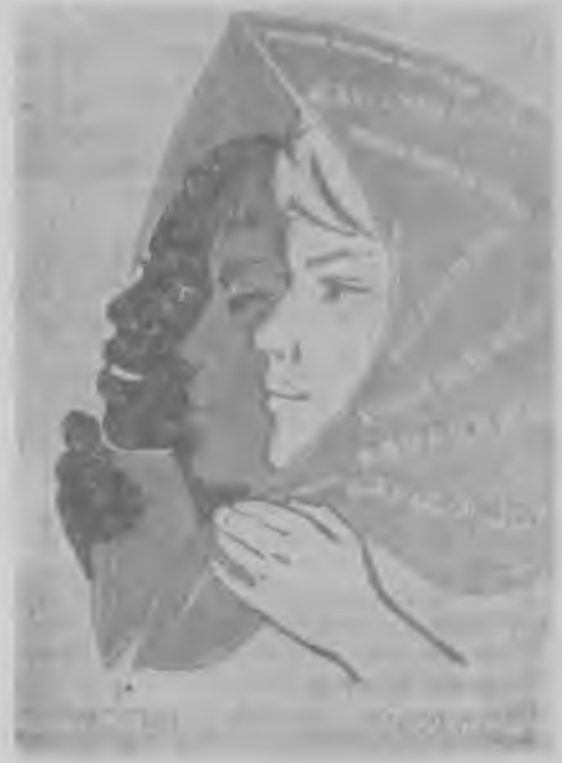
Эмблема Всемирного конгресса женщин.

□ В Кремле, в Третьяковской галерее, на стадионе в Лужниках, на станциях метрополитена можно было встретить в эти дни делегатов конгресса из Индонезии. Вчера гости дальних островов выехали к берегам Невы, чтобы ознакомиться со славным городом Ленина.