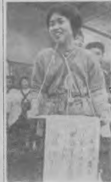
По всей Японии развернулась подготовка к Всемирному кон- грессу женщин, который от- кроется 24 июня в Москве. Одновременно с подготовкой к конгрессу женщины Японии расширяют борьбу против за- хода американских атомных подводных лодок в японские порты. НА СНИМКЕ: сбор средств в фонд подготовки к конгрессу на улицах Токио