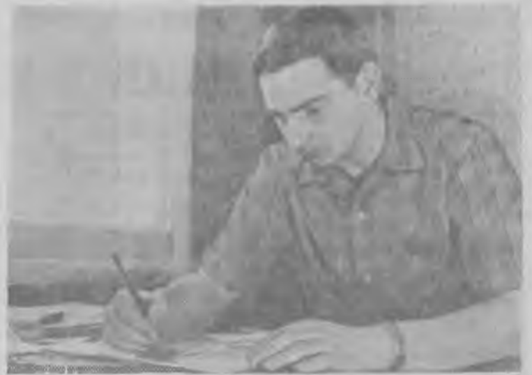
Космонавт-5 Валерий Федорович Быковский в своем рабочем кабинете.

Как только в штаб-квартиры американских агентств были переданы первые телеграммы «молнии» о новом достижении Советского Союза в освоении космоса, началась настоящая информационная «буря». Соревнуясь между собой, агентства Ассошиэтед Пресс и Юнайтед Пресс Интернейшнл начали подробно излагать сообщение ТАСС о выводе на орбиту вокруг Земли советского космического корабля «Восток-6», пилотируемого женщиной-космонавтом В. Терешковой.