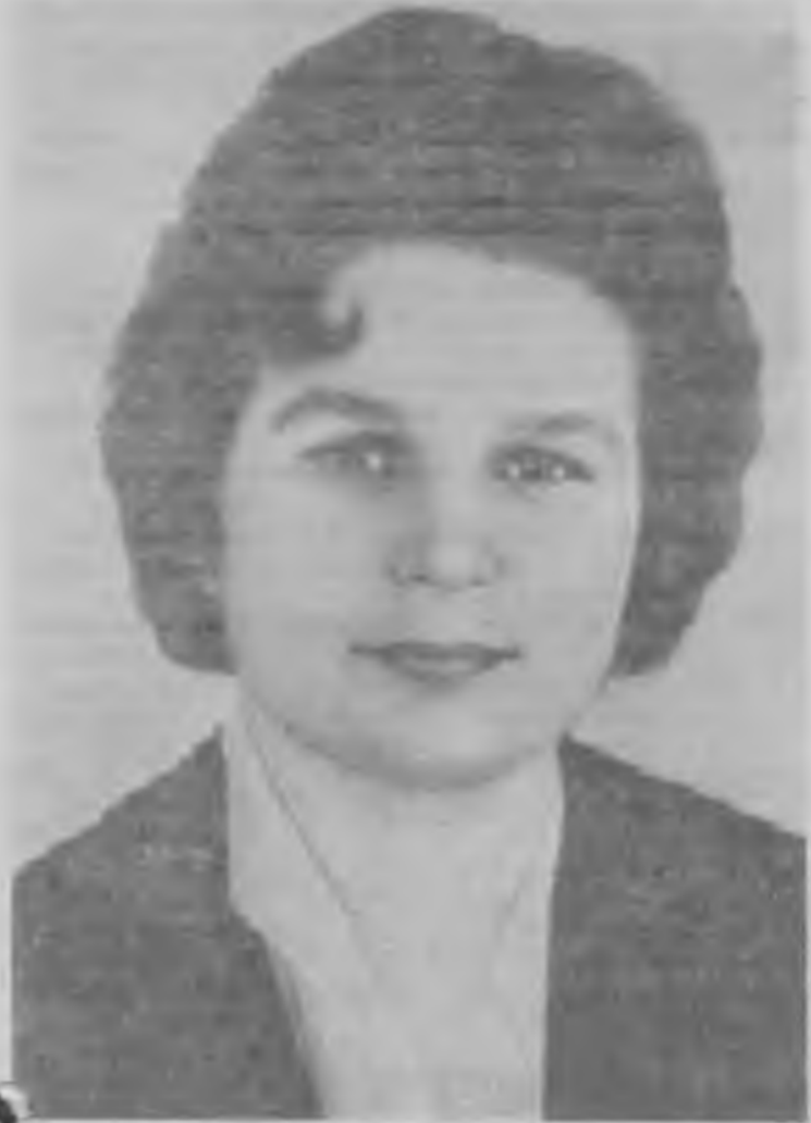
Валентина Владимировна Терешкова