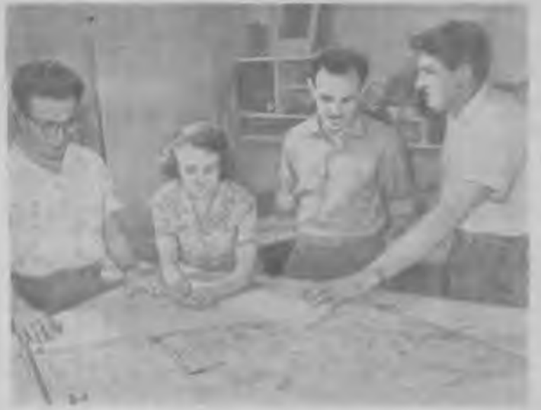
МОСКВА. Вопросы планировки и застройки старых родов и их новых жилых массивов занимается группа архитекторов и инженеров института проектирования городов «Гипрогор». Коллектив мастерской № 3 в настоящее время работает над проектом застройки нового города Татарши Нижне-Камска.

Кондукторскому резерву на постоянную работу ТРЕБУЮТСЯ кондукторы грузовых поездов. Оплата сдельная — 115—120 рублей. Обращаться: станция Егоршино, ул. Октябрьская, дом № 17.