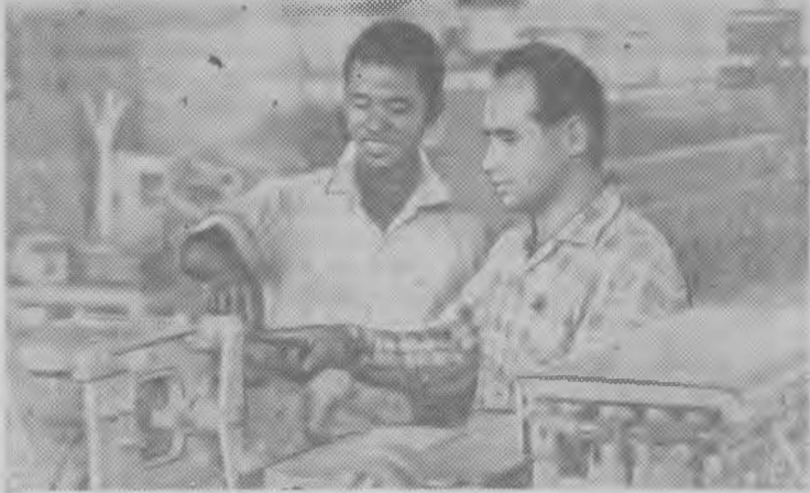
ЭФИОПИЯ. В городе Бахр-Даре, на берегу озера Тана, у истоков Голубого Нила, с помощью Советского Союза сооружается техническая школа — учебный центр по подготовке техников. В сентябре нынешнего года 250 учащихся придут в светлые и удобные аудитории и в мастерские школы.