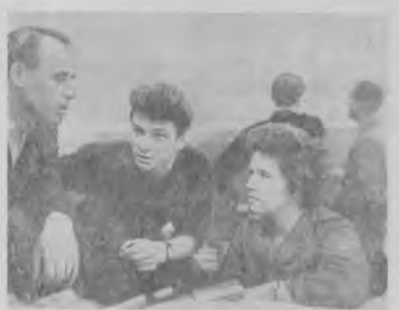
Хорошо работает общественное конструкторское бюро цеха № 3 на Липецком тракторном заводе. Оно оказывает большую помощь рационализаторам и изобретателям в осуществлении их предложений. Бюро разработало и внедрило десятки мероприятий, направленных на снижение трудоемкости производственных процессов, повышение производительности и улучшение условий труда.