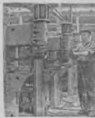
Трудно найти такую область народного хозяйства, где не применялось бы электросварочное оборудование, сделанное на ленинградском заводе «Электрик». Оно получило также признание за рубежом. В настоящее время предприятие выполняет заказы тридцати трех стран, причем государствами Азии и Африки оборудование изготовляют в тропическом исполнении.

НА СНИМКЕ: сборка машин для точной сварки по заказу Индии.