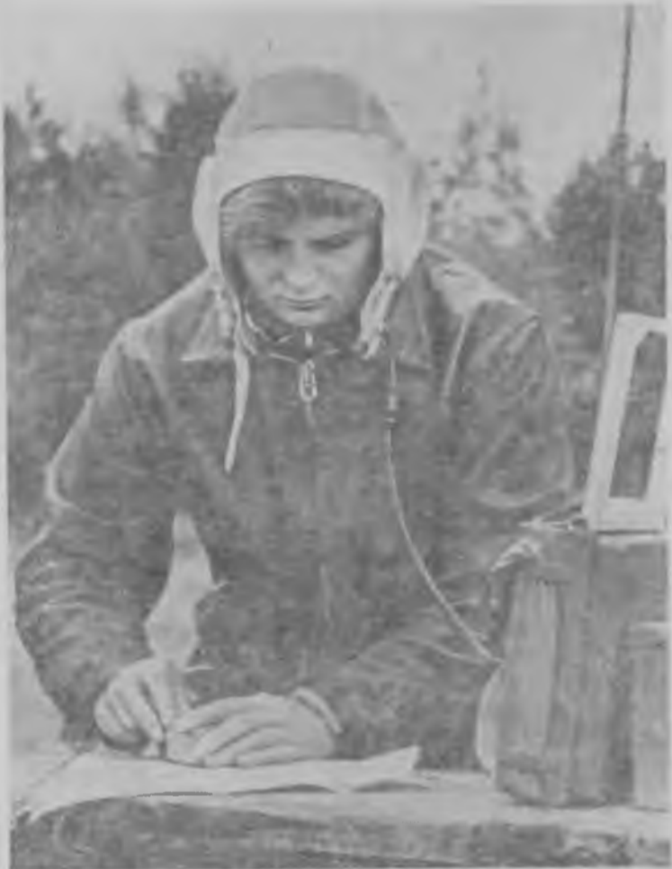
Валентина ТЕРЕШКОВА на занятиях по связи.