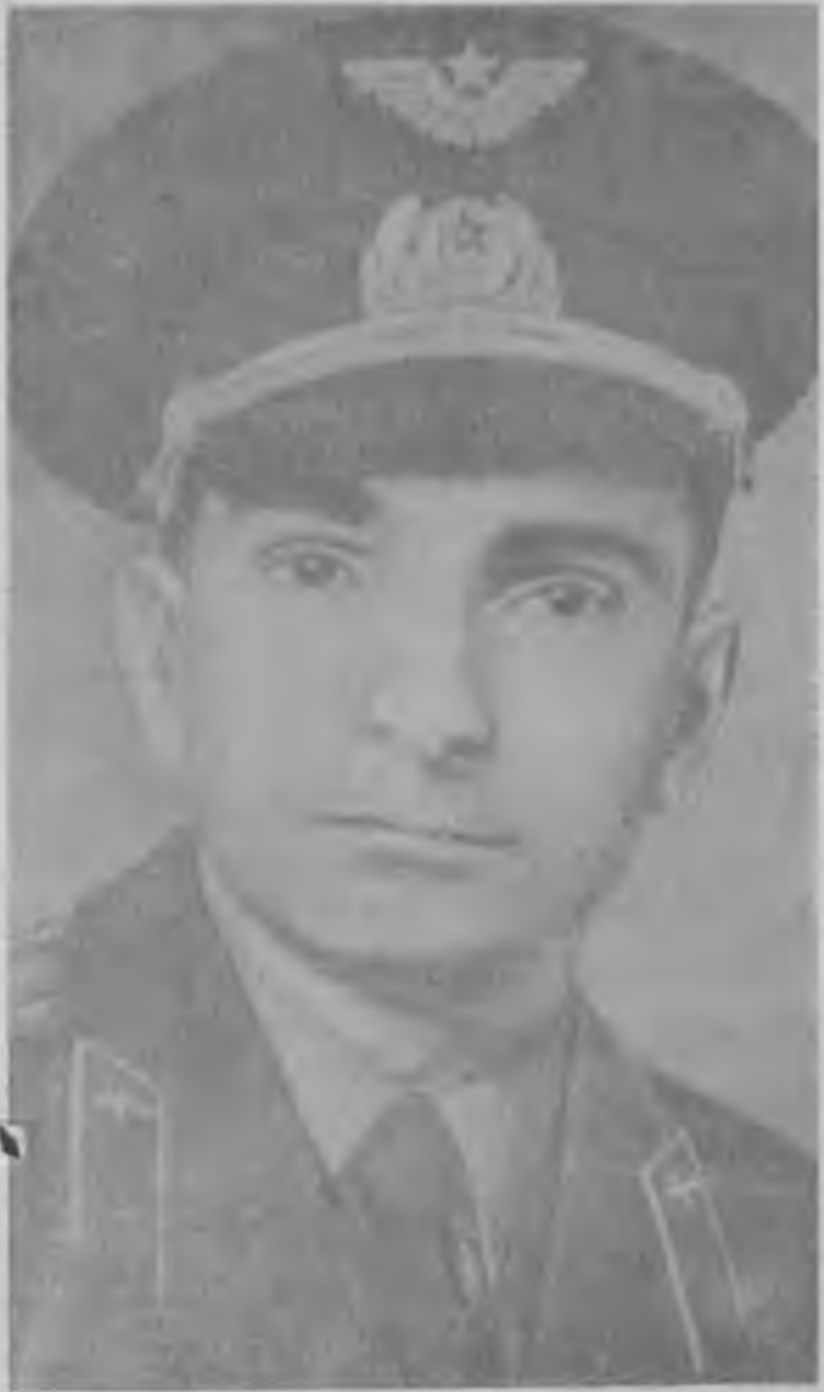
Летчик-космонавт Валерий Федорович Быковский.

17 июня у обоих космонавтов был новый трудовой день. (ТАСС).