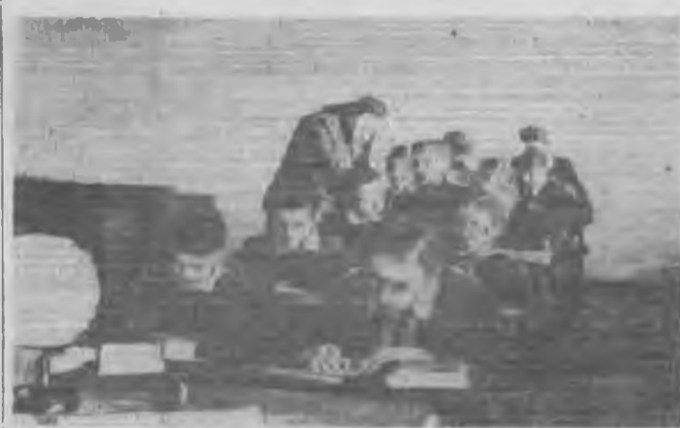
Дети рабочих и служащих поселка Незавей первый год учатся в новой школе в своем поселке. В прошлом году они ходили в школу за пять километров. Ученицы очень благодарны строителям за то, что в первом году перестройки системы народного образования им создали все условия для учебы и работы в мастерских.