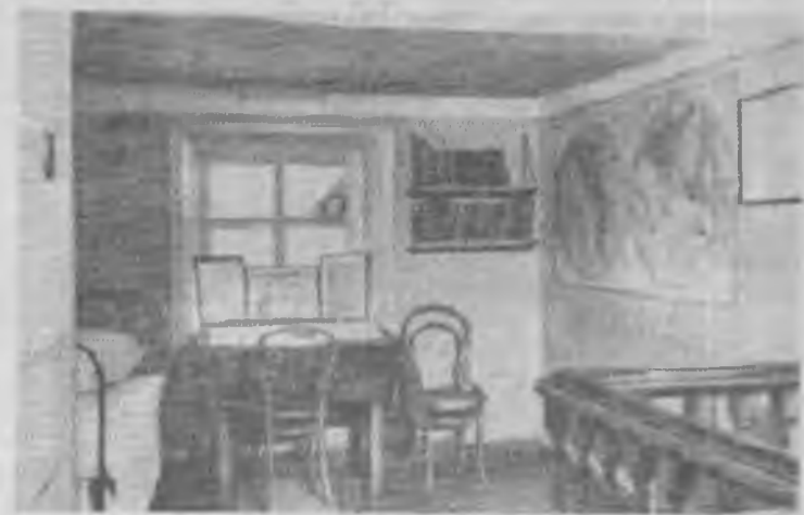
Ульяновск, Дом музей В. И. Ленина. На снимке: комната Владимира Ильича.