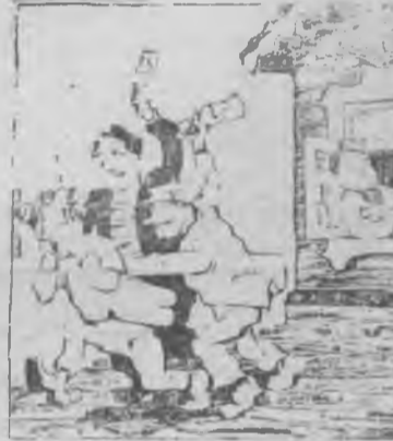
Не смотрите на «деток» — вот им и расплата!