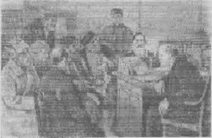
В. И. Ленин беседует с крестьянами. (С картины худ. М. Соколова).

Самым лучшим ему памятником будет сохранять, развивать и не терять ни на одну минуту основной цели — полной победы рабочих и крестьян над угнетателями.