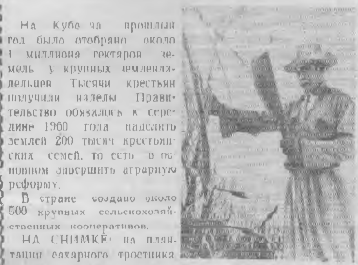
На Кубе за прошедший год было отобрано около 1 миллиона гектаров земель у крупных помещиков. Тысячи крестьян получили наделы. Правительство обязалось к середине 1960 года наделить землей 200 тысяч крестьянских семей, то есть в полном объеме завершить аграрную реформу. В стране создано около 500 крупных сельскохозяйственных кооперативов. НА СНИМКЕ: на плантации сахарного тростника.