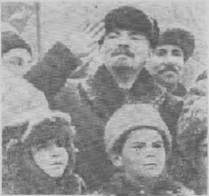
В. И. Ленин на Красной площади во время празднования 11 годовщины Великой Октябрьской социалистической революции.