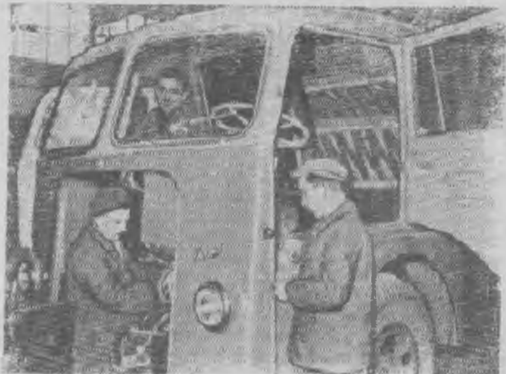
Польская Народная Республика. Автозавод в Эльце близ Вроцлава начал выпускать восьмитонные грузовые машины «Зубр». Автомобиль может двигаться со скоростью 80 километров в час. Он сконструирован польскими инженерами. На снимке: монтаж грузовика «Зубр».