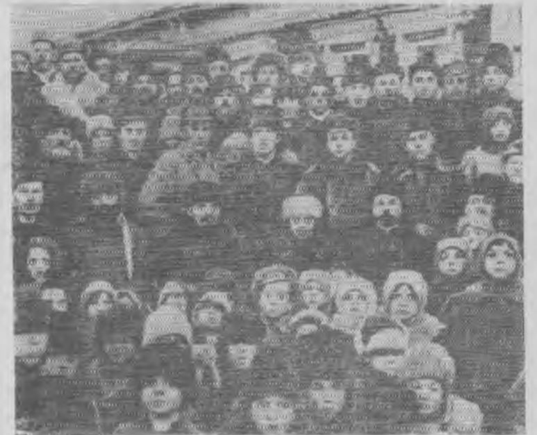
В. И. Ленин и Н. К. Крупская в группе крестьян деревни Кашино 14 ноября 1920 года.