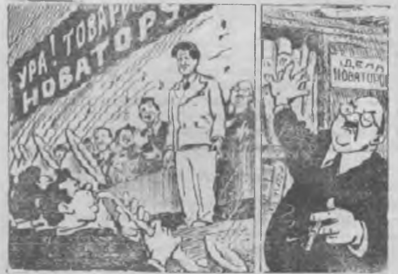
Пошумели, потрубили... ..Положили и забыли