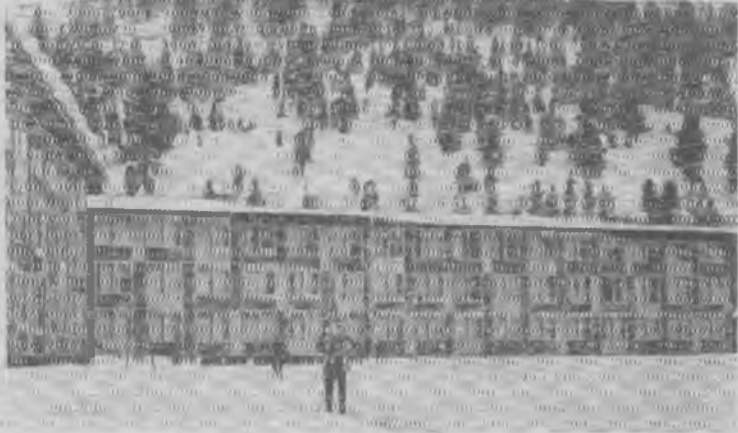
На снимке: плашания для уааетников Олимпийских игр в Скво Вэлли.