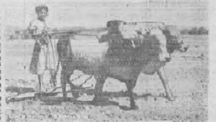
В Йомане подавляющая часть населения страны занимается земледелием и скотоводством. Обработка земли ведется самыми примитивными орудиями. НА СНИМКЕ: крестьянин на поле.