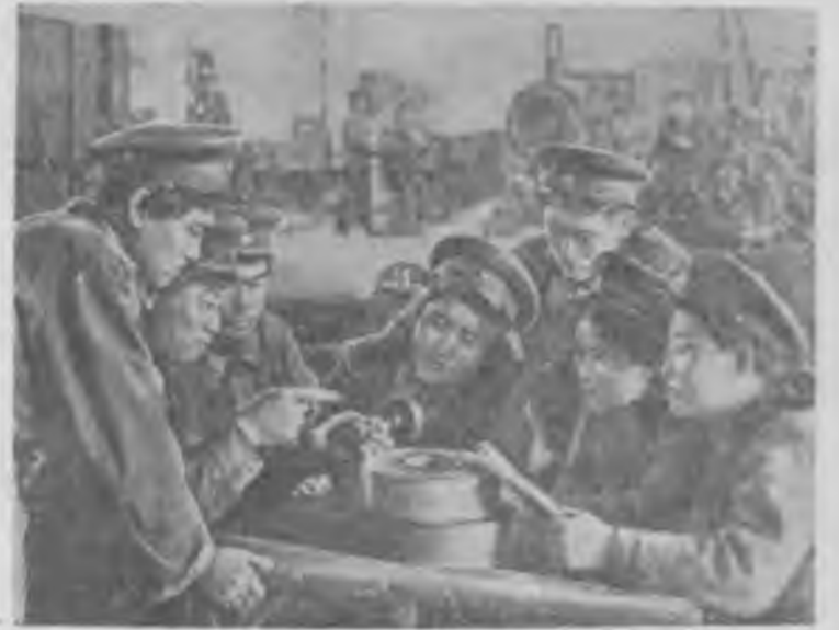
Для бурно развивающегося железнодорожного транспорта Китайской Народной Республики требуются квалифицированные кадры. Их готовят многочисленные учебные заведения. На снимке: учащиеся молодежной технической школы в г. Дальнем на практических занятиях в железнодорожных мастерских.