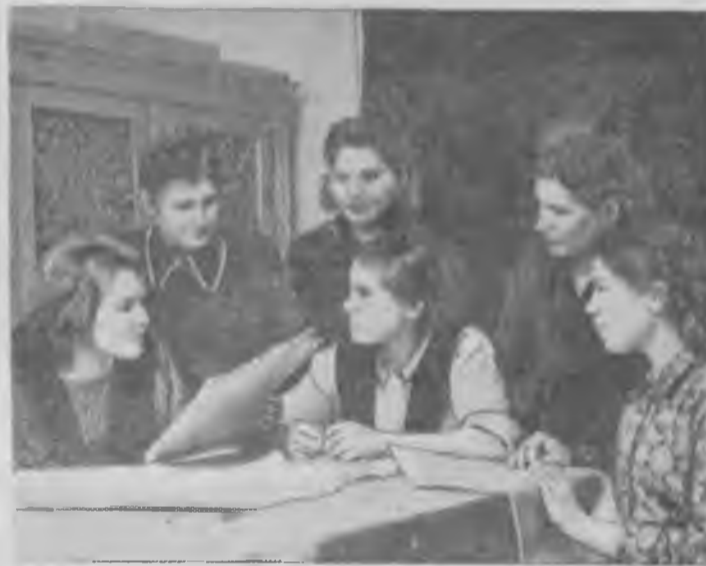
В уютных и светлых комнатах живут молодые рабочие шахты „Ключи“. В каждой комнате имеется бельевой шкаф, тумбочки, репродуктор.

Под лозунгом «Дадим стране 800 тонн угля сверх плана!»—трудится сейчас каждый горняк передового участка № 2.