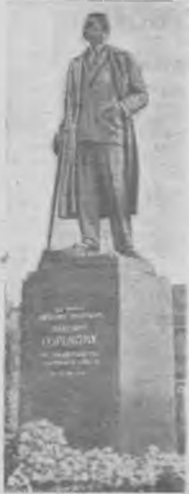
На снимке: памятник А. М. Горькому.

Друг Ленина и Сталина, Максим Горький отдал революции все свои силы, весь свой гений.