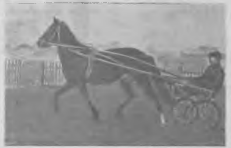
Колхоз им. В. И. Ленина славится выращиванием породистых племенных лошадей.

На племенном дворе сельхозартели десятки рысистых лошадей и тяжеловозов. Для каждого коня отдельное стойло, комплект сбруи. Над входом — дощечка с кличкой и годом рождения лошади.