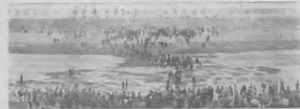
Волго-Донской судоходный канал

На снимке запечатлен исторический момент слияния вод Волги с водами Дона между первым и вторым шлюзами канала 31 мая.