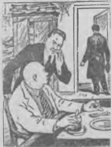
На словах-то БРИЗ ЕГРЭС. Всем понятно, за прогресс. Но на деле, во сто крат БРИЗ ЕГРЭСа бюрократ.