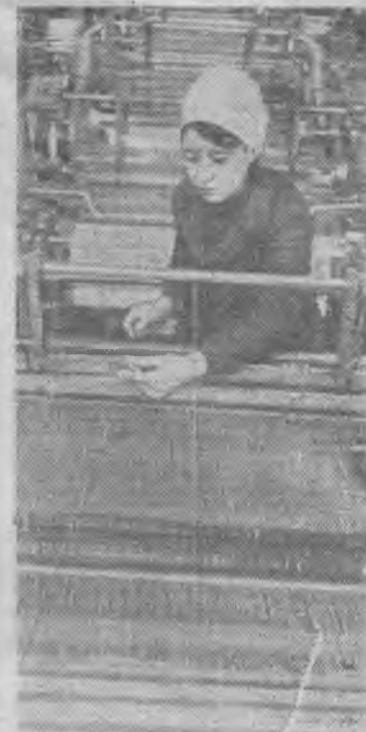
Запорожская область. Бердянский завод «Стекловолокно» за прошедший год выпустил сверх плана много ценной продукции. Из стеклянного волокна делают очень прочные ткани и пряжи для технических нужд. Изделия из такой пряжи обладают высокими электрофизическими свойствами и низкой теплопроводностью. Они находят широкое применение в химической и электротехнической промышленности.

В. ИЗЕРГИН, начальник планового отдела треста «Егоршиноуголь».