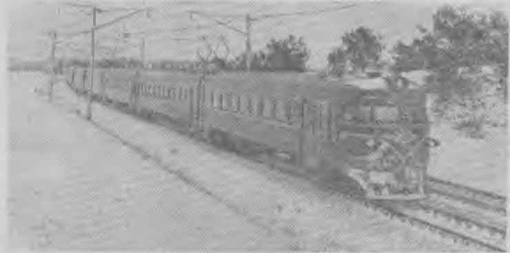
На Белорусской железной дороге электрифицирован участок Минск—Олехновичи протяженностью 48 км. Начато регулярное движение электрических пригородных поездов

Как уже сообщалось, трудящиеся предприятий треста «Егоршинуголь» досрочно справились с выполнением государственного плана и повышенных обязательств минувшего года. Закрепляя прошлогодний успех, горняки высоко несут эстафету трудовых дел и в январе. Закончилась исрвая декада месяца, а на счету шахтеров сотни тонн сверхпланового угля. Особенно хорошо потрудились в эту десятидневку горняки шахты Буланаш-2-5, выдавшие на-гора 271 тонну «черного золота» сверх установленного задания. Не отстают от них и трудящиеся шахт Буланаш-3 и имени Кирова. На их счету более 400 тонн сверхпланового угля.