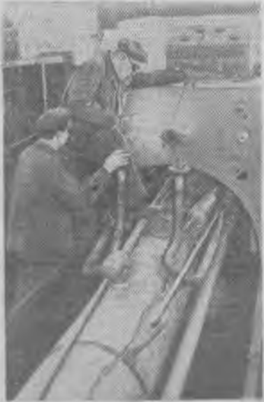
Одесский завод «Автогемаш» поставляет предприятиям большой химии различные оборудования. В новом году поступили заказы от 75 предприятий, в том числе — химического комбината на Волге, Руставского азототукового завода в Грузии, химического комбината в Тульской области, Ферганского азототукового завода. Ритмично работают творцы машин с первых дней шестого года семилетки.

НА СНИМКЕ: монтаж блоков азотокислородных установок.