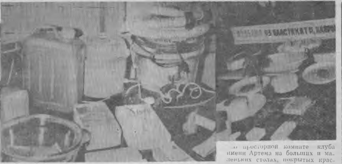
В просторной комнате клуба имени Артема на больших и маленьких столах, покрытых красными подотнами, аккуратно расставлены и разложены промышленные товары, сделанные на заводах и фабриках с помощью химии. Все участники пленума горкома КПСС с большим интересом знакомятся с экспонатом.