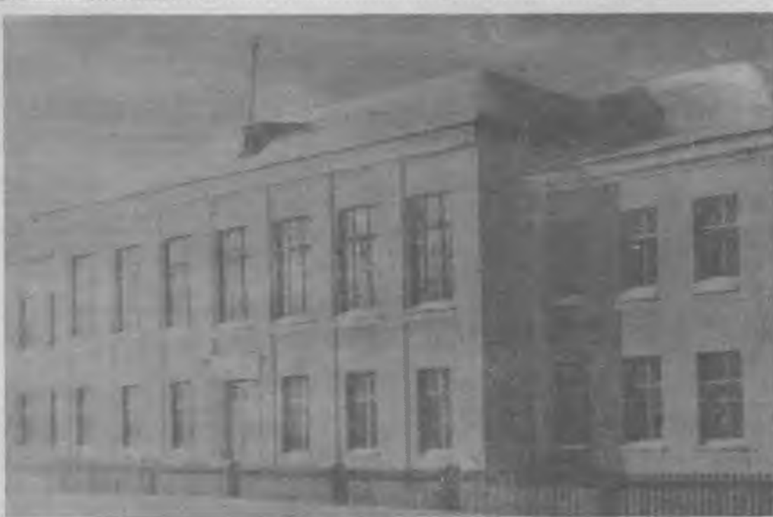
НОВАЯ ВОСЬМИЛЕТНЯЯ ШКОЛА В РЕЖЕ.