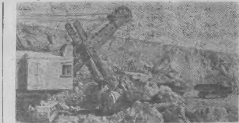
Казахская ССР. В открытом карьере рудоуправления «Аксай» горнохимического комбината «Кара-Тай» ведут разработку мощные экскаваторы. Руду вывозят 25-тонные самосвалы Минского автозавода. Коллективы экскаваторного и автомобильного парков, отвечая на призывы партии и правительства об увеличении производства минеральных удобрений, упорно добиваются повышения производительности горнотехнического оборудования.