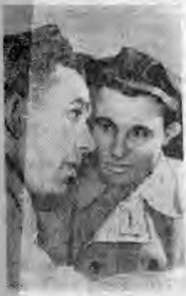
ЛУГАНСКАЯ ОБЛАСТЬ. Горняки треста «Боковоантрацит» первыми в Донбассе достигли уровня производительности труда, запланированного на конец семилетки. Теперь каждый рабочий в

среднем по тресту добывает столько угля, сколько намечено на 1965 год.