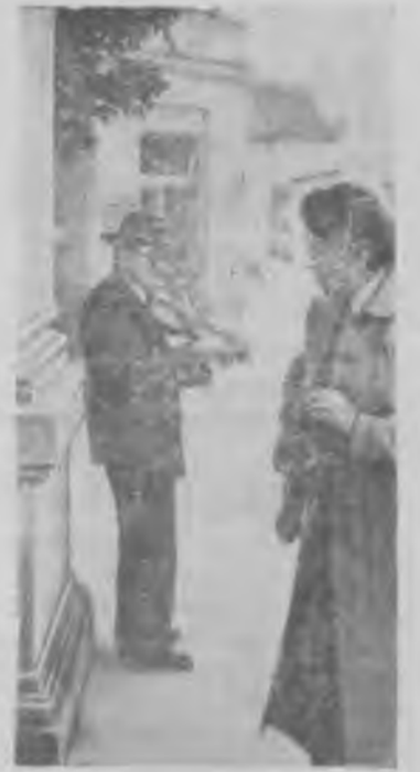
Австрия. Даже по официальным данным Министерства социального обеспечения в маршаллизованной Австрии насчитывается около 125 тысяч безработных. Фактически их много больше.

На снимке: безработный музыкант на улице Вены.