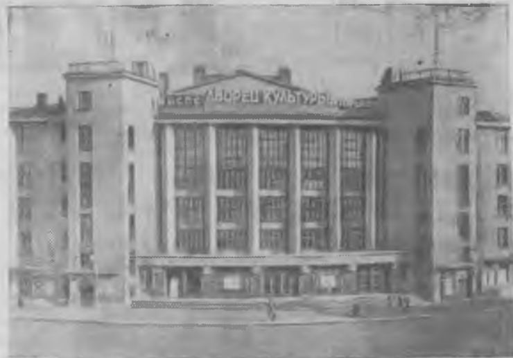
Ленинград. На снимке: Дворец культуры имени М. Горького. На этом месте было здание школы, в котором 30 июля—3 августа (12—16 августа) 1917 года проходила работа VI съезда РСДРП (большевиков).

На здании Дворца культуры укреплен мемориальная доска со следующим текстом: