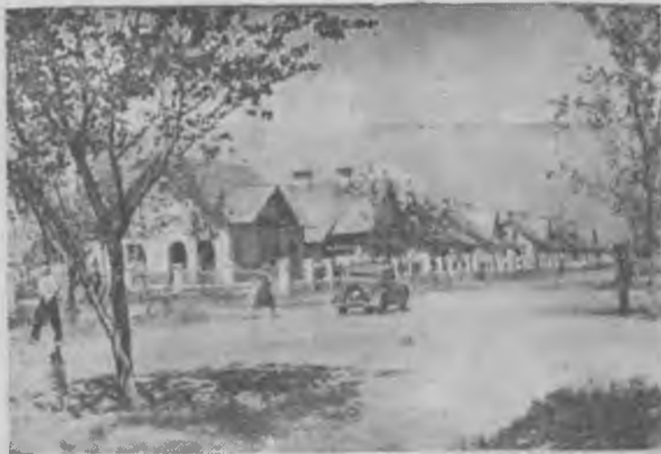
Волго-Донской судоходный канал имени В. И. Ленина.

Поселок строителей в Красноармейском районе.