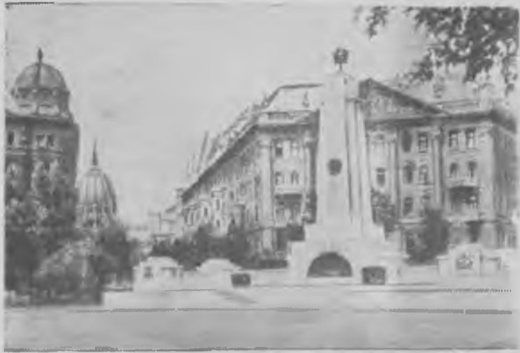
Венгерская народная республика. Памятник советским воинам на площади Свободы в Будапеште.