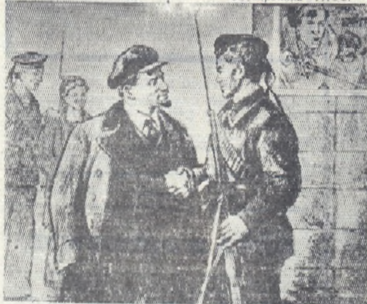
Рисунок художника Н. Н. Жукова «Спасибо матросам!».