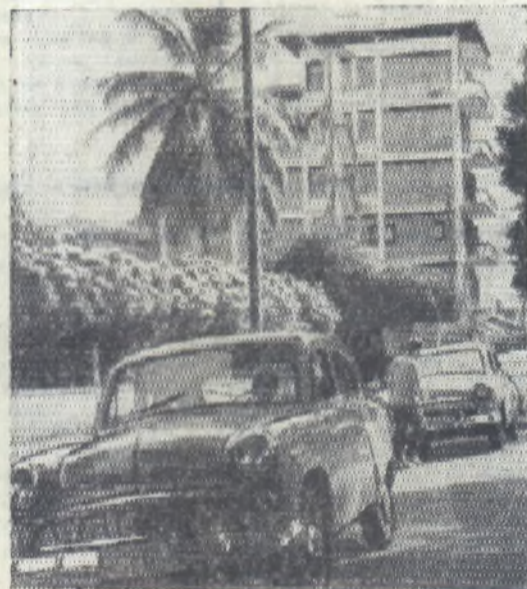
На снимке: один из жилых кварталов гвинеийской столицы — Конакри.