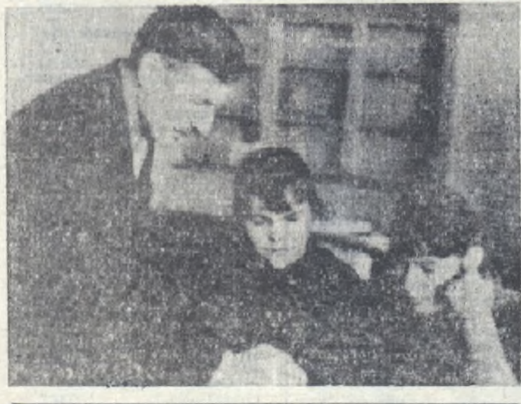
АРТЕМОВСКИЙ РАБОЧИЙ 10 октября 1968 года