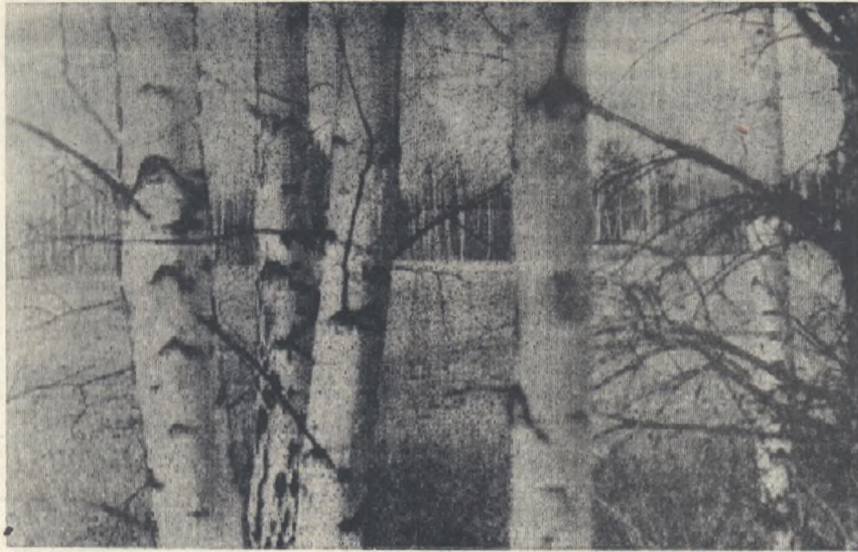
РОДНЫЕ РУССКИЕ БЕРЕЗЫ.