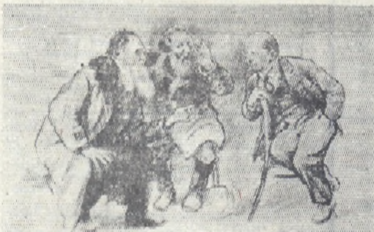
Рисунок художника Н. Н. Жукова «Разговор по душам».

Работники совхозов, специалисты сельского хозяйства! Боритесь за успешное выполнение заданий пятилетки. Повышайте культуру земледелия и животноводства! Добивайтесь высокой рентабельности всех отраслей сельскохозяйственного производства!