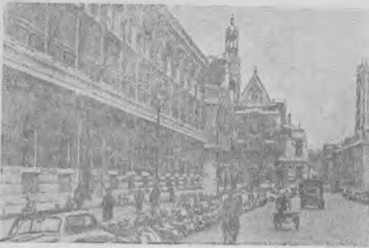
Франция. На одной из улиц Парижа.