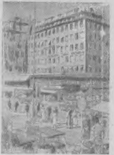
Швеция. Стокгольм. На одной из площадей.