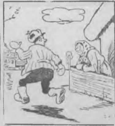
— Магазины открыли...