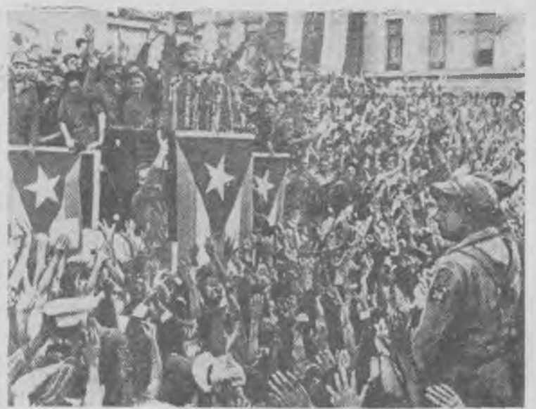
Недавно в столице Кубы—Гаване состоялся грандиозный митинг, на котором выступил тепло встреченный участниками вождь повстанцев, главнокомандующий вооруженными силами Кубы Фидель Кастро. На митинге присутствовало около миллиона человек. На снимке: во время выступления Фиделя Кастро.