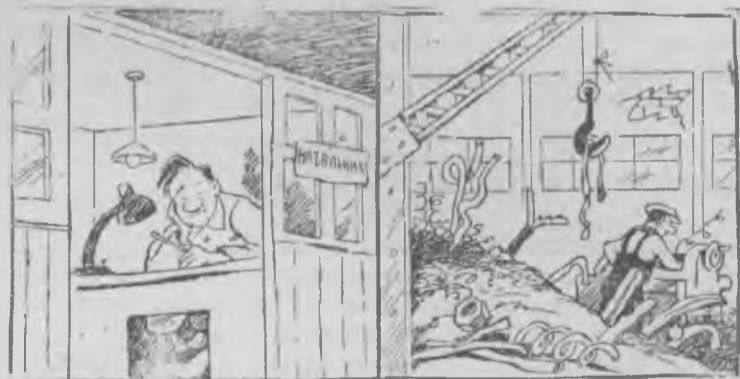
Начальник явно не на месте