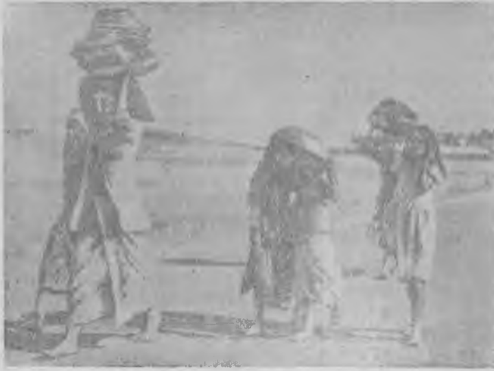
Республика Индонезия. На острове Бали. Возвращение с рынка.