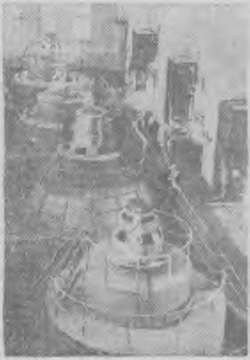
Корейская Народно-Демократическая Республика. Чандинская гидроэлектростанция является одной из главных энергетических баз в системе, связывающей восточное и западное побережье. Разрушенная в годы войны электростанция недавно полностью восстановлена. На снимке: в машинном зале Чандинской ГЭС.