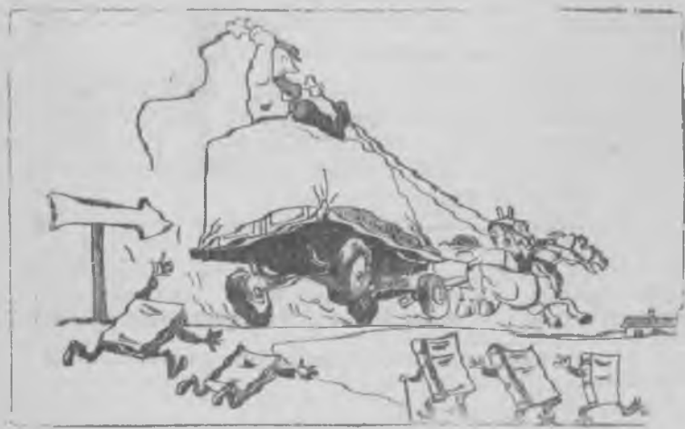
Книжки — Подвезите до фермы.

На пленуме райкома партии отмечалось, что в красных уголках ферм плохо организована доставка книг книгоношами.