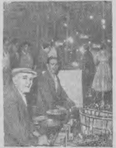
Испания. Гранада. Торговцы фруктами вечером на улице города.