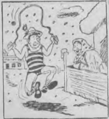
— Все продано по знакомству... Купил, что осталось...

посевы помогут шире внедрять озимую пшеницу, которая в ряде этих районов сейчас почти не высевается.