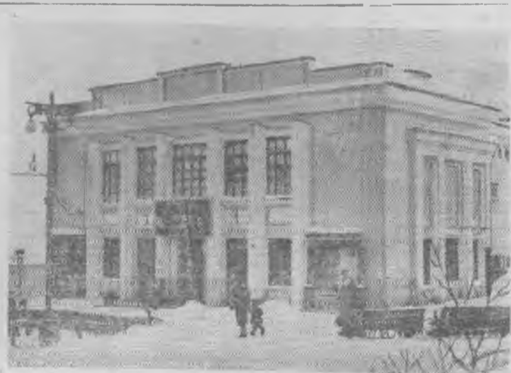
В Магадане открыт первый на Дальнем Севере широкоэкранный кинотеатр «Горняк». Его зал рассчитан на 600 человек и хорошо оформлен. Театр пользуется большой популярностью у трудящихся. На снимке: широкоэкранный кинотеатр «Горняк».