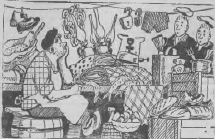
— Чего только нет в нашем магазине? — Порядка.