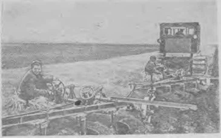
Казахская ССР. Механизаторы Чувашской МТС, Западно-Казахстанской области, приступили к подъему зяби под урожай будущего года.