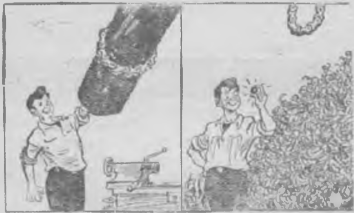
— Ну чурбач неотесанный! Я из тебя куколку сделаю!

По сообщениям печати, в Северном Бихаре находится под водой 4 тысячи квадратных миль и более 5 тысяч деревьев. Ассам отрезан от остальных районов Индии.