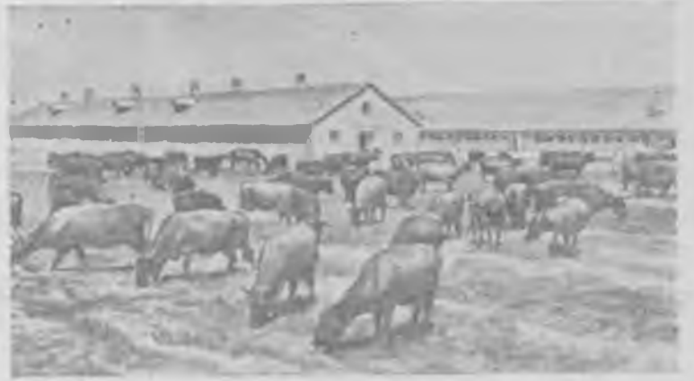
Литовская ССР. В совхозе «Поцюнай», Шедувского района, развернулось большое строительство животноводческих помещений. За последнее время построены два свиноводческих, два коровника, несколько силосных багн. Завершается строительство нового телятника.

Всесоюзная сельскохозяйственная выставка подводит не только итоги побед социалистического сельского хозяйства, но и призывает всех тружеников деревни к борьбе за новые успехи.