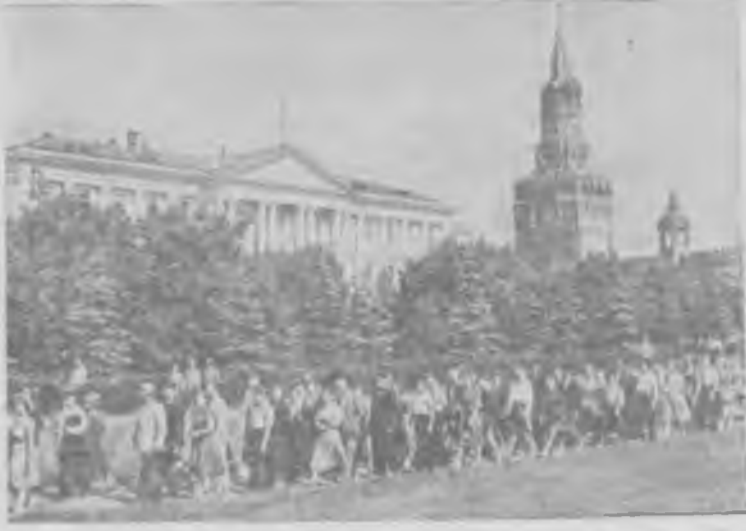
Московский Кремль открыт для свободного посещения трудящимися.

На снимке: трудящиеся на территории Кремля.