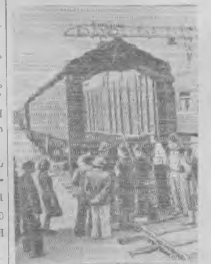
Москва На выставке образцов новой техники железнодорожного транспорта представлены новые типы локомотивов, тепловозов, электровозов, различные пассажирские и товарные вагоны, автопогрузчики и другие механизмы, предназначенные для ускорения и облегчения грузовой операции. На снимке: опытный универсальный грузовой вагон грузоподъемностью 32 тонны, построенный на Уралвагонзаводе.