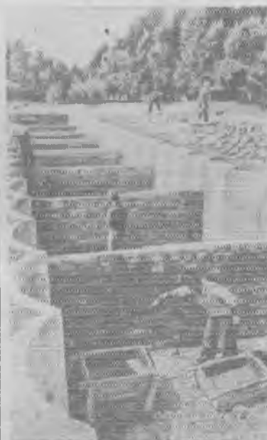
Калининградская область. В колхозе имени Сталина, Приморского района, широко развернулось строительство траншей и ям для силосования кукурузы. Емкость их — 2,500 тонн.

В колхозе должно работать две силосорезки, но одна до сих пор стоит в тракторном отряде и не подвезена к месту работы. О. Савалова.