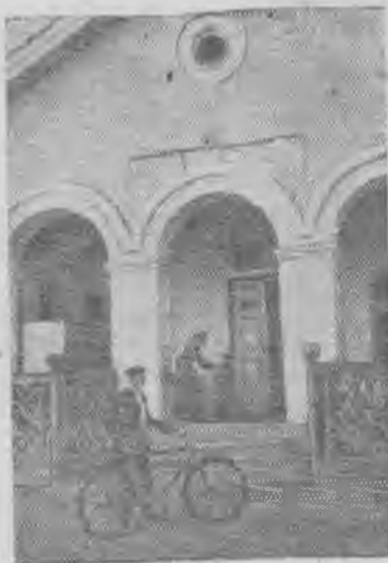
На снимке: фасад Буланашской бани.

Для медицинского обслуживания поселовцы работают поликлиника, детская консультация, родильное отделение, профилакторий.