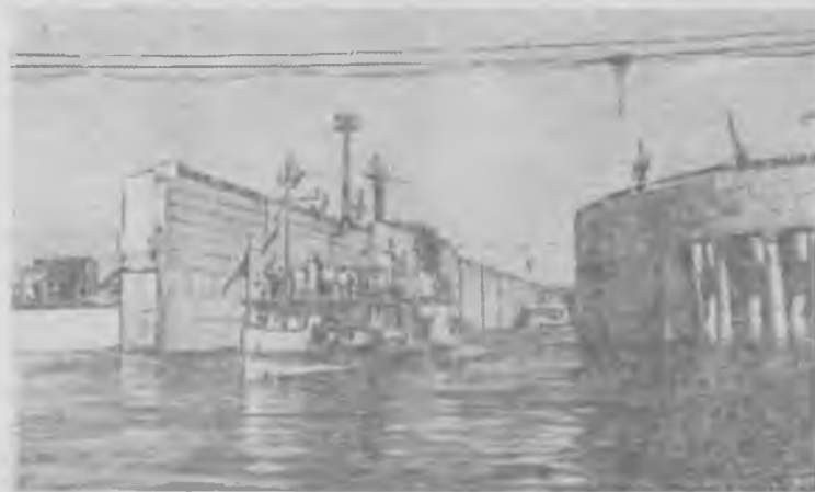
На строительстве Куйбышевской гидроэлектростанции — восточнее плес нижних судоходных плесов. На снимке: выход первых судов из камеры плеса.

Теплоход может развивать скорость более 22 километров в час.