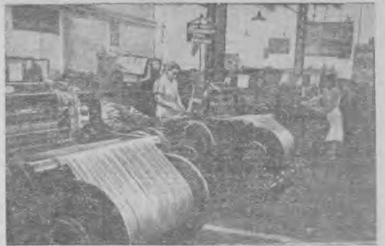
Народная Республика Болгария. В городе Русе на фабриках и заводах растёт движение за перевыполнение производственных норм. На текстильных предприятиях увеличилось число многостаночников.

П. Парфенова. За счастье детей. Госполитиздат, 1955, 85 коп.