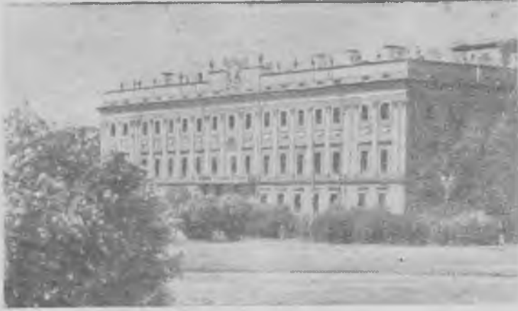
Ленинград. Филиал Центрального музея В. И. Ленина.