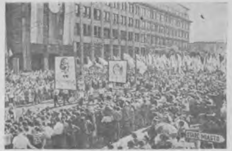
Варшава. Пятый Всемирный фестиваль молодежи и студентов за мир и дружбу. На снимке: участники фестиваля направляются к стадиону Десятилетия.