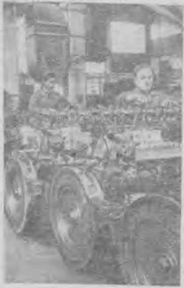
Румынская Народная Республика. Бухарестские заводы имени 23 августа выпускают железнодорожные вагоны и цистерны, локомотивы, оборудование для нефтепромышленности, запасные части для тракторов, сельскохозяйственные орудия и предметы широкого потребления. На снимке: в цехе сборки моторов.