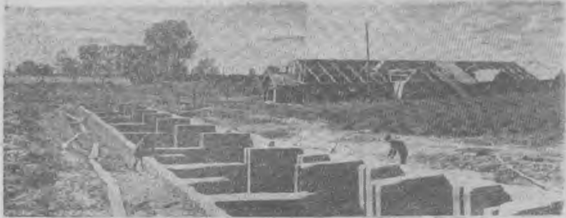
Хорошая силосная траншея на 600 тонн заканчивается в колхозе «Путь к коммунизму». Ее в основном соорудили шефы — рабочие ЕПРАС. Рядом с ней полями ходом идет строительство скотного двора на 100 голов.