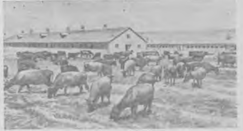
Литовская ССР. В совхозе «Полюнай», Шедувского района, развернулось большое строительство животноводческих помещений. За последнее время построены два свиноводника, два коровника, несколько силосных башен. Завершается строительство нового телятника.

Всесоюзная сельскохозяйственная выставка подводит не только итоги побед социалистического сельского хозяйства, но и призывает всех труженников деревни к борьбе за новые успехи.