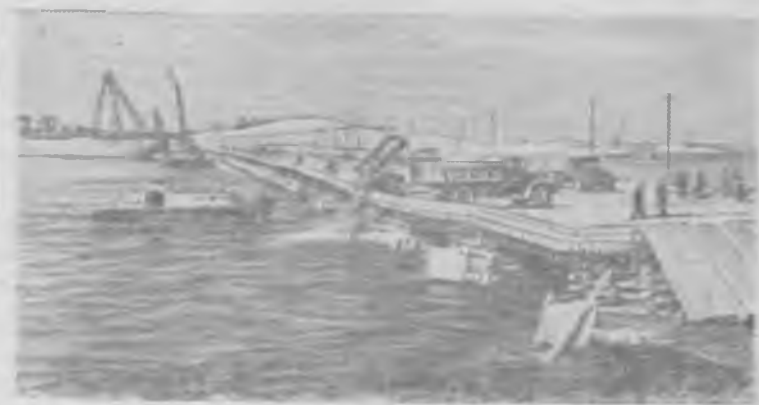
Горьковская область. Для перекрытия русла Волги на строительстве Горьковской гидроэлектростанции сооружен понтонный мост шириной в 20 метров и длиной в 300 метров, с которого автосамосвалы сбрасывают камень.