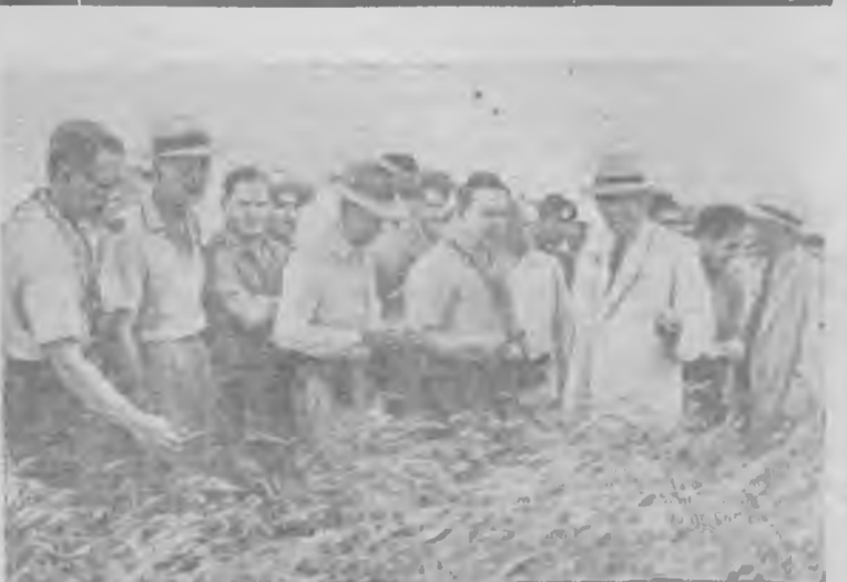
Сельскохозяйственная делегация Соединенных Штатов Америки совершает поездку по Советскому Союзу. Делегация посетила Харьковскую государственную селекционную станцию.

С большим интересом шахтеры изучают сообщения о переговорах Китайской Народной Республики и США по вопросу о Тайване.