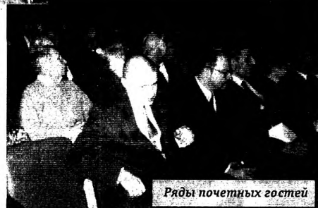
Ряды почетных гостей