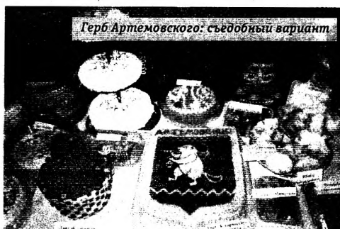
Герб Артемовского: съедобный вариант

- Я в большом долгу перед жителями района,