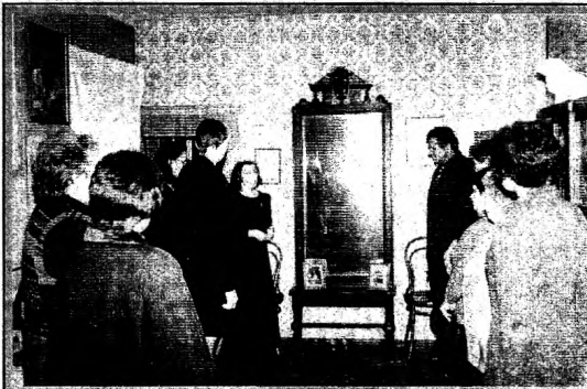
На днях в городском историческом музее распахнула свои двери гостиница-выставка "Живая старина", представившая зрителю уникальную коллекцию мебели XIX-XX столетий.