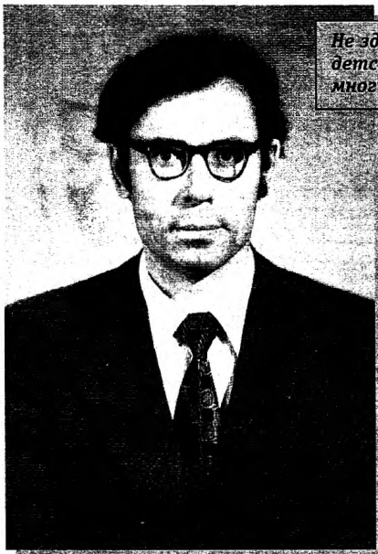
Не здесь он родился. Не здесь прошли его детство, юность, молодые годы. Но очень многие наши проблемы пришлось решать ему.

бораторного корпуса ЦРБ, детской поликлиники. А когда на этих объектах не хватало рабочих рук, забирал сотрудников горисполкома и сам шёл с ними на стройку. С трудом (люди скандалили, жаловались), но убрал худые сараюшки с улицы Гагарина и начал строить капитальные гаражи — благоустроили улицу. Конечно, на эти объекты средства хоть с трудом, но выбивались, а иногда приходилось строить, не имея ни рубля. Даже сейчас, спустя много лет, думаешь, как это удалось сделать. Например, улицу Разведчиков, в то время разбитую, грязную, пыльную, от Молодёжи до Советской покрыли бетоном. По улице Лени-