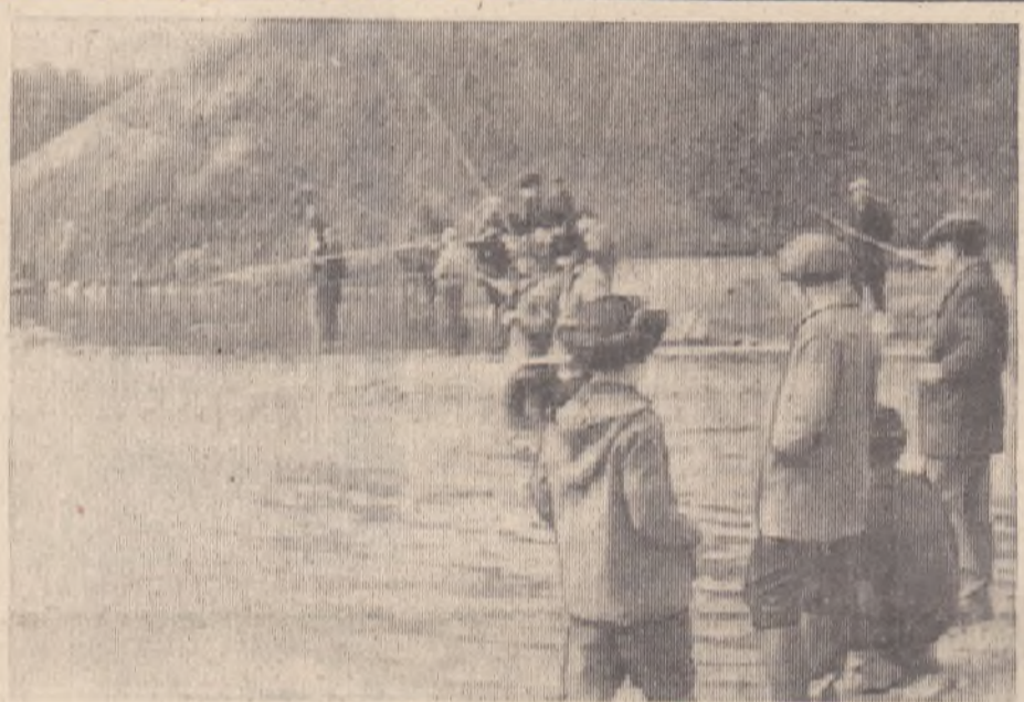
В воскресный день на берегу пруда.

ПИШИТЕ: г. Артемовский Свердловской обл., ул. Физкультурников, 12-а.