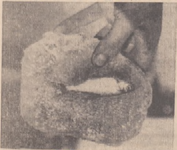
РЫБА ВО ЛЬДУ.