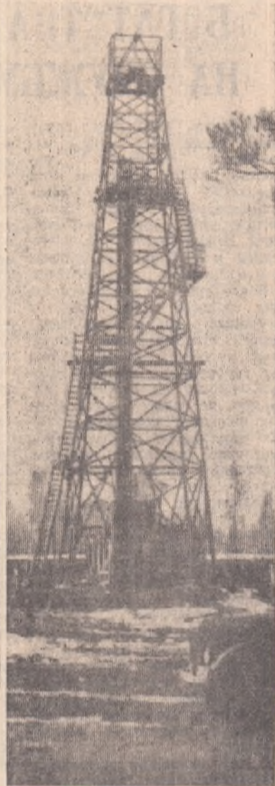
НА СНИМКАХ: 1. Выше окружающих сосен поднялась буровая вышка, на которой работает бригада С. Е. Лаврентьева. Она чем-то напоминает мачту корабля. И не зря Хен-Исек, плававший когда-то на пароходе, самую верхнюю площадку зовут по-матросски «клатком».