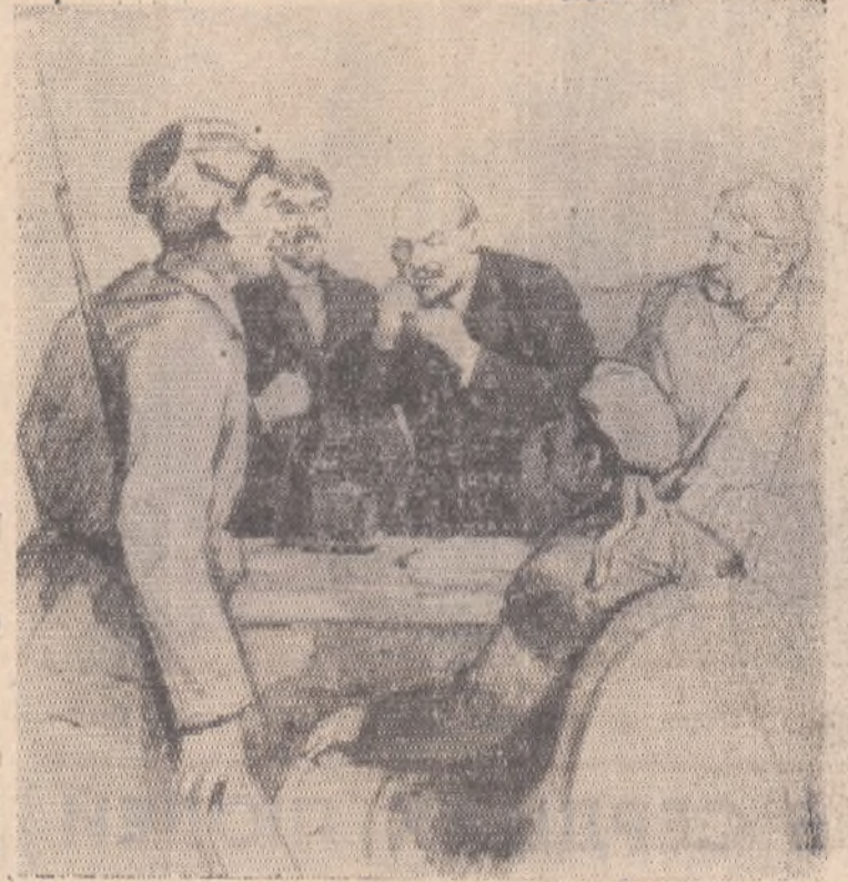
В. И. Ленин у телефона в Смольном. (Рисунок заслуженного деятеля искусств РСФСР П. Васильева).