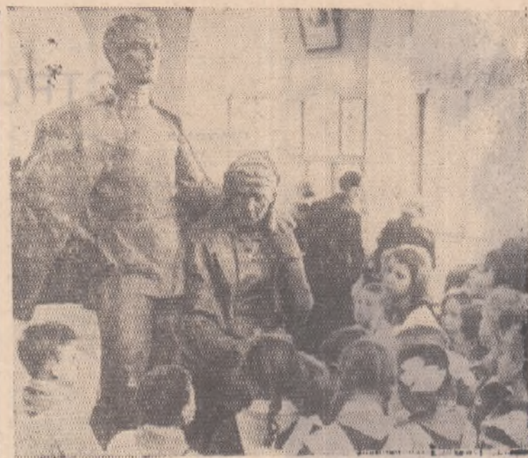
МОСКВА. Накануне 97-й годовщины со дня рождения Владимира Ильича Ленина в Центральном музее В. И. Ленина особенно оживленно.