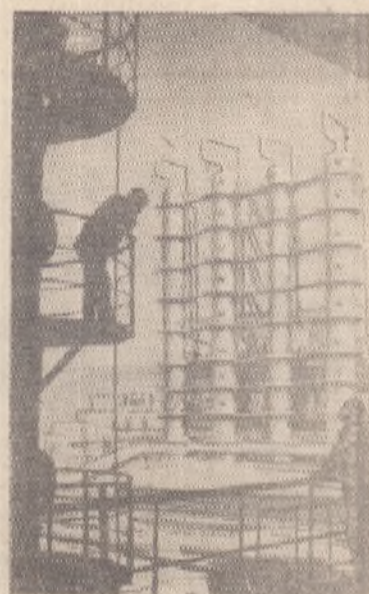
Ереван. Отделение ректификации завода «Поливинилацетат».

Третью пятилетку прервала война. Она особенно ясно показала всю мудрость Ленина и правильность политики партии, не жалевшей сил для создания в кратчайшие сроки первоклассной индустрии, без которой мы не смогли бы победить в войне,