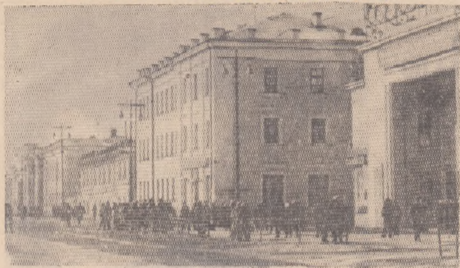
ЯКУТСК. Проспект имени В. И. Ленина.