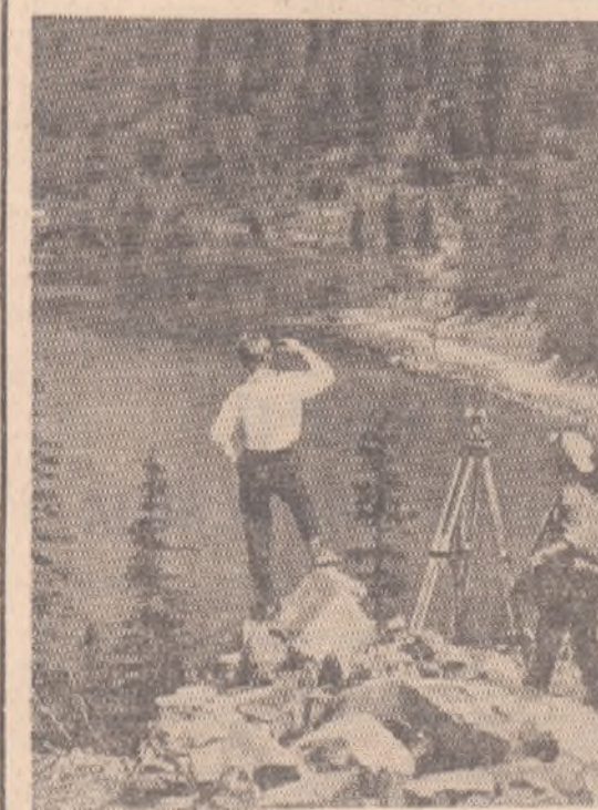
НА СНИМКЕ: дальневосточные разведчики недр на таежном озере Амут.

Е. СОКОЛОВ, начальник Зауральской комплексной геологоразведочной экспедиции.