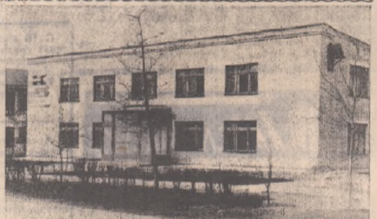
Еще одно красивое современное здание появилось в нашем городе. Это новый комбинат бытового обслуживания. Совсем недавно здесь начал работать цех реставрации и ремонта одежды. Он находится в просторной светлой комнате на втором этаже. Бригада реставраторов состоит из 13 человек.

Написанные видными советскими учеными, коллективами авторов институтов Академии наук СССР и академий наук союзных республик, богато иллюстрированные книги о Великом Октябре представляют значительный интерес не только для специалистов — историков, философов, экономистов, но и для партийных и советских работников, пропагандистов и агитаторов, для широкого круга читателей.