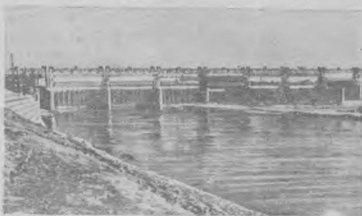
В Индии проводится ирригационное строительство, которое имеет большое значение для развития сельского хозяйства страны и ее электрификации. В августе в Дургануре (штат Западная Бенгалия) состоялось открытие плотины и большого оросительного канала.

На снимке: общий вид плотины Дурганур.