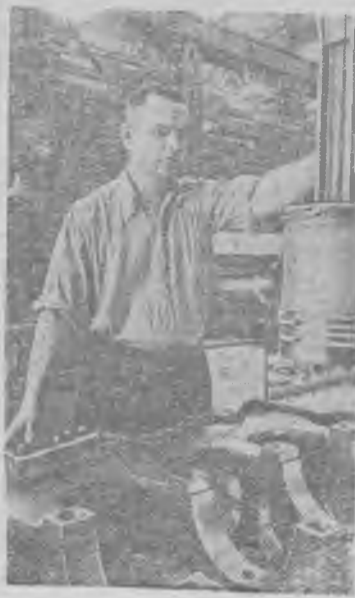
На Харьковском заводе транспортного машиностроения производительность труда в 1955 году по сравнению с 1950 годом повысилась почти на 65 процентов. Выпуск тепловозов возрос здесь за 4 с лишним года в два с половиной раза.

Среди участков наилучшие показатели имеет третий. Сентябрьский план он завершил раньше на четыре дня.