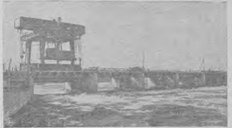
На снимке: водосливная плотина Нарвской ГЭС.

Срыв графика зернопоставок допущен потому, что в