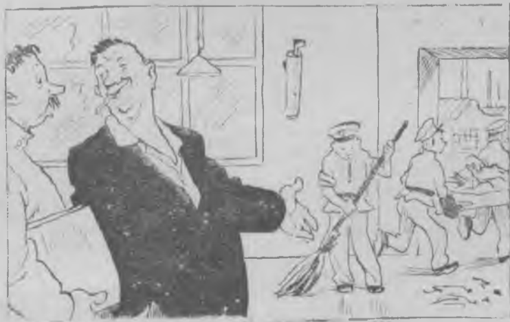
Начальник цеха: — Я думаю, уборщику можно сократить: у нас и без нее есть кому мусор убирать.

В нашей стране огромная забота проявляется о подготовке и воспитании кадров квалифицированных рабочих. Выпускников ПУ и школ ФЗО окружают на передовых предприятиях заботой и вниманием. И не понятно, почему о них забывают на машиностроительном заводе.