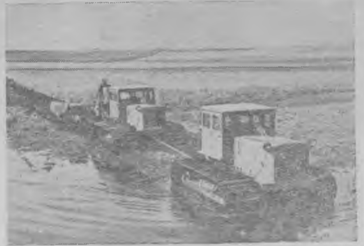
На Челябинском тракторном заводе недавно создан новый мощный болотоходный трактор «С-100Б». Он обладает проходимостью в два раза большей, чем трактор «С-80». На нем установлен дизельный двигатель в сто лошадиных сил.