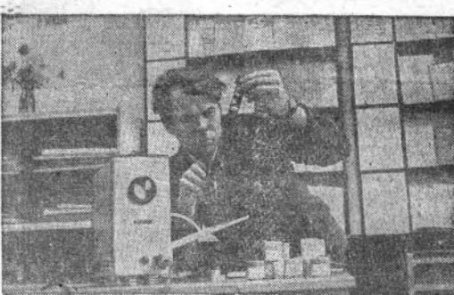
На Пермском машиностроительном заводе имени Ф. Э. Дзержинского в школах коммунистического труда занимаются свыше трех тысяч человек. В течение начавшегося учебного года они будут изучать материалы XXIV съезда КПСС...