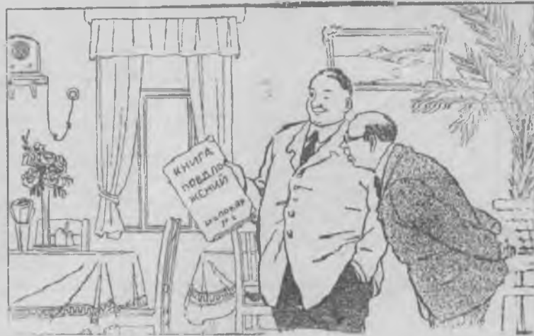
— Как вы добились улучшения работы вашей столовой? — Я внимательно просматриваю эту книгу.

гу жалоб и предложений, стараясь удовлетворить каждое требование и предложение трудящихся. Сейчас в книге предложений нет ни одной жалобы, и только за последний месяц обслуживающему персоналу столовой вынесено 7 благодарностей.