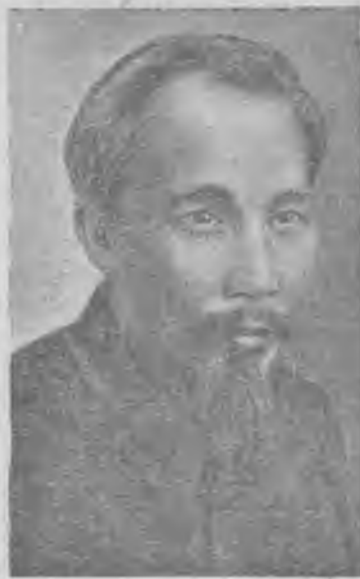
Хо Ши Мин.

Позвольте мне от всего сердца поблагодарить вас за ту горячую и незабываемую встречу, которую вы оказали мне и всем членам делегации. Я очень рад передать вам братский привет от вьетнамского народа, который желает