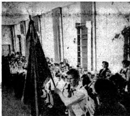
РАВНЕНИЕ НА ЗНАМЯ!