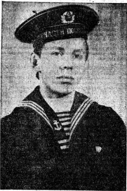
● СЛУЖАТ НАШИ ЗЕМЛЯКИ