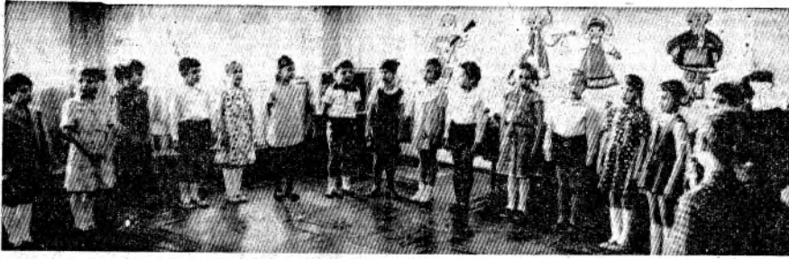
«ЧЕЛОВЕЧЕСТВО ОБЯЗАНО ДАВАТЬ РЕБЕНКУ ЛУЧШЕЕ, ЧТО ОНО ИМЕЕТ». (Из Декларации прав ребенка).