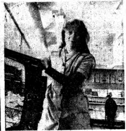
ФОТО-ИНФОРМАЦИЯ Большой популярностью у артемовцев пользуется магазин «Техника», открытый несколько лет назад на станции Егоршино. Здесь большой выбор разнообразных товаров и всегда много покупателей.