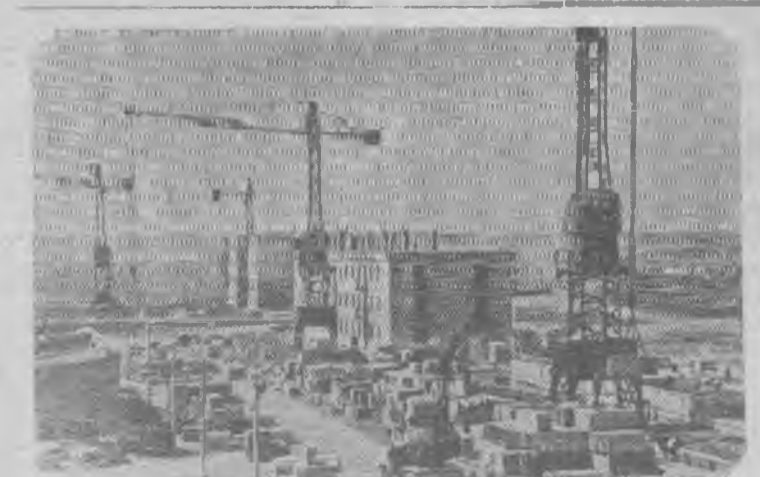
Сталино. Большой опыт по строительству крупноблочных и каркасно-панельных домов имеет управление № 9 треста «Сталинкамстрой».

На снимке: участок сборки крупноблочных домов.