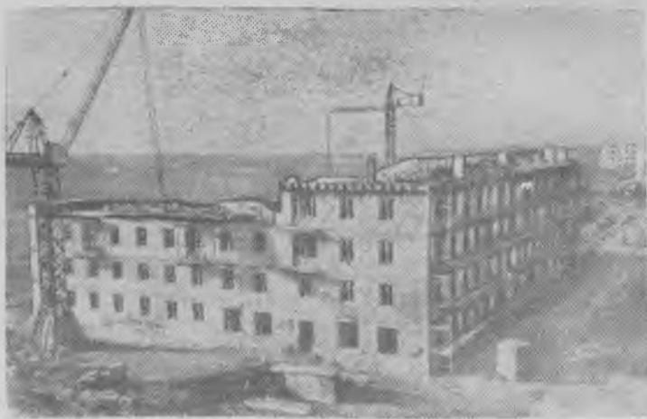
Узбекская ССР. Во Фрунзенском районе Ташкента развернулось жилищное строительство. В ближайшие годы здесь будет возведено более 400 многоквартирных домов, в которых поселится около ста тысяч человек.

Раз мы стали всерьез заниматься жилищным строительством, надо улучшить помощь тем, кто на собственные средства и своими силами помогает нам решать проблему ликвидации недостатка в жилье. А сделать это мы в силах.