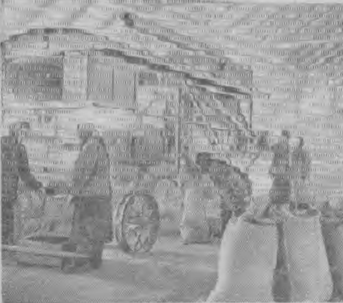
Казахская ССР. Хлебоборбы Кустанайской области готовятся к весне. Во всех долильных совхозах идет очистка и сортировка семян.

Если мы хотим не на словах, а на деле вести решительную борьбу за резкое повышение урожайности и продуктивности животноводства, должны учесть работников сельского хозяйства вести дело по-научному, с учетом достижений передовых хозяйств. А к тем специалистам, которые не желают пополнять знания рабочих полеводства и животноводства, следует предъявлять самые жесткие требования.