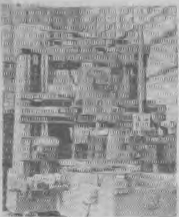
Ленинград. На станко-строительном заводе имени Свердлова закончено изготовление сверхточного координатно-расточного станка модели ЛР-87. В новом станке значительно упрощено управление механизмами, оно ведется с одного подвижного пульта (в ранее выпущенных станках было два пульта). Станок будет экспонироваться на Брюссельской международной выставке. На снимке: новый станок.

Областным, городским, районным и заводским многотиражным газетам, а также радиокомитету и телевизионному центру предложено усилить пропаганду достижений рационализаторов и изобретателей.