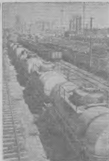
Китайская Народная Республика. Крупнейший на северо-востоке страны центр угольной промышленности Фушунь за годы народной власти стал также крупным нефтяным центром Китая.

Через три дня, 13 августа, я снова пришел в эти места. Было около шести часов вечера. Солнце позолотило вершины гор. Неожиданно из той же самой площадки вновь показался «снежный человек». И на этот раз он тоже шел на двух ногах, но быстро скрылся в чернющей впадине, — видимо в пещере.