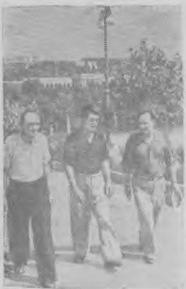
Грузинская ССР. За годы Советской власти широкое развитие получил бальнеологический курорт Цхалтубо. Здесь построены великолепные ванные здания, санатории, комфортабельная гостиница, кругом скверы и парки. Как показали многолетние наблюдения, результаты лечения на этом курорте заболеваний суставов, сердечно-сосудистой и нервной систем весьма эффективны. На снимке: отдыхающие в Цхалтубо.