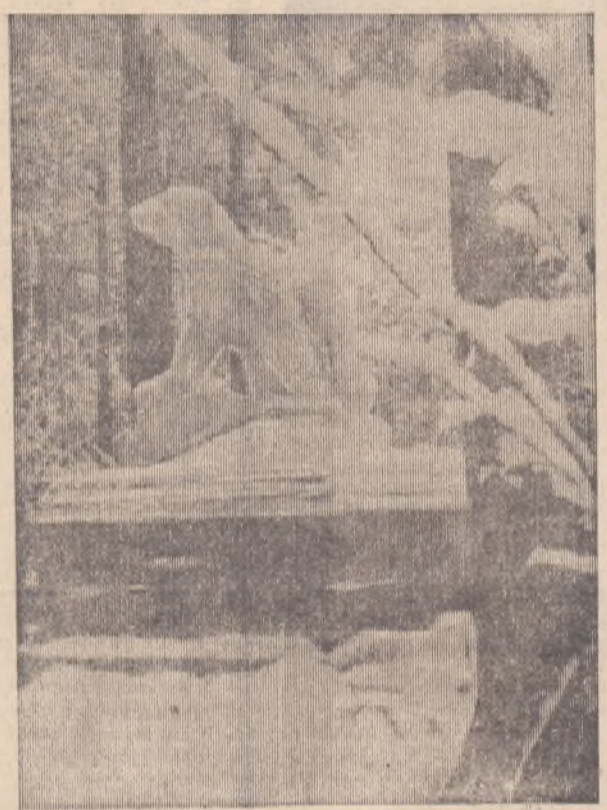
МИШКА В ДЕТСКОМ ЦАРКЕ.

скольким раз напоминают, пока не обобьют все пороги на шахте. Стараясь избавиться от доставки угля, руководители советуют: «Выписывайте уголь без доставки». Или просто отвечают: «Нет транспорта». А какой привозят уголь, выписанный с доставкой? Самый плохой. Руководители, как говорят, не мытьем, так катаньем, приучают людей выписывать уголь без доставки. А это на-руку халтурщикам. Я. ЧЕРНЫШЕВ.