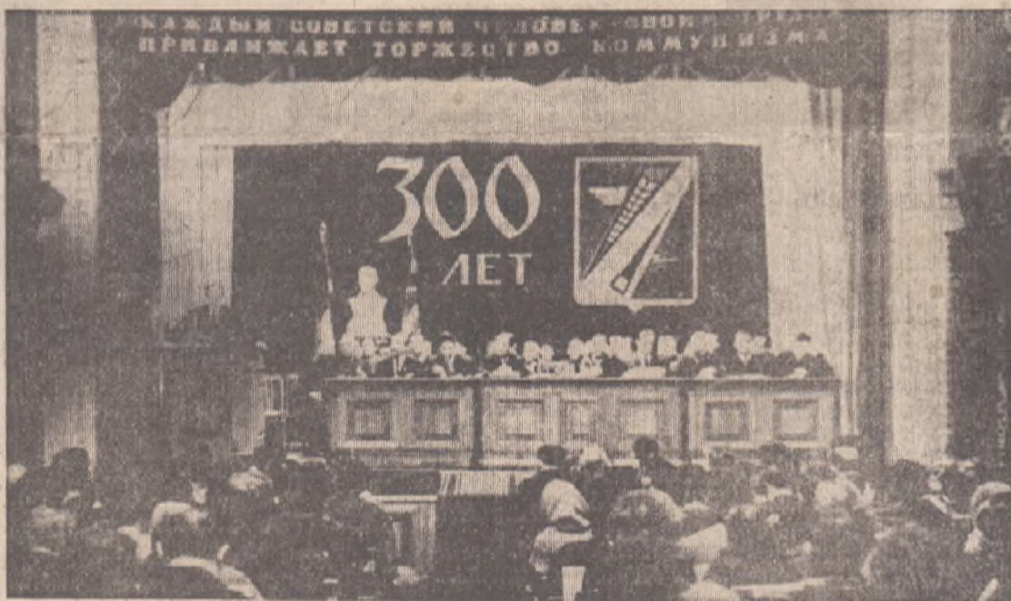
Президиум торжественной сессии горсовета.

Надолго останется в памяти участников сессии это торжественное событие. Отмечая 300-летие своего города, артемовцы полны решимости сделать все, чтобы родной город стал еще краше, обеспечить досрочное выполнение обязательств, принятых в честь 50-летия нашей Родины.