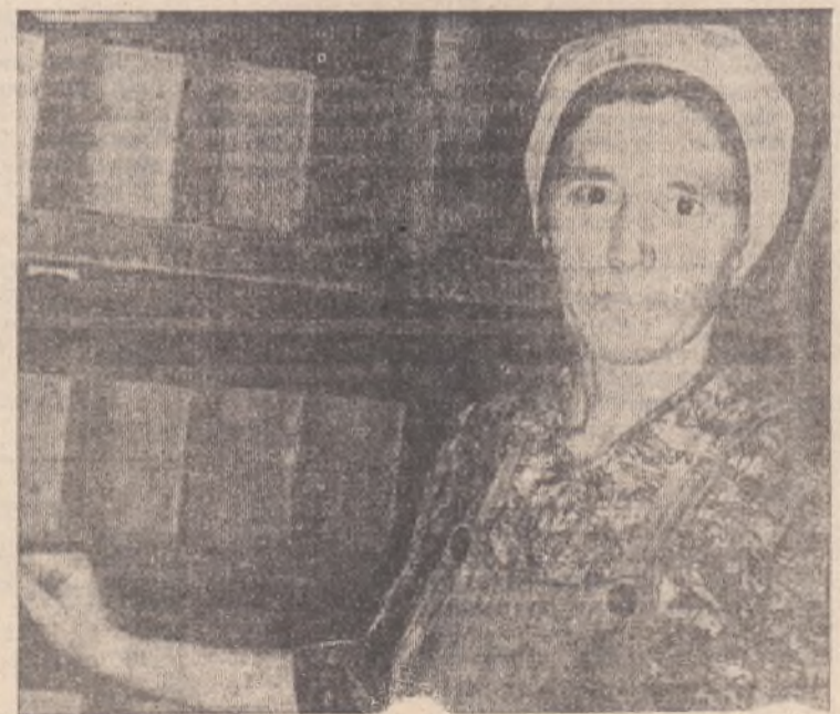
Она систематически перевыполняет установленные задания.

Возможно, в первые дни работы в две смены надо молока несколько снизится, но это явление временное, зато с переходом на двухсменную работу у доярок появится больше свободного времени. Если раньше с 6 утра до 8 часов вечера они находились на работе, не считая короткого перерыва, то теперь уже первая смена к часу дня заканчивается рабочий день. Доярки очень довольны двухсменной работой. Н. НЕУСТРОЕВ.