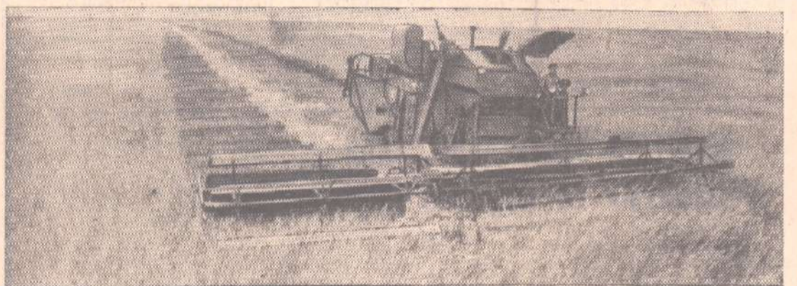
Больше всех в Илекском районе Оренбургской области продают зерна государству хлеборобы колхоза «Россия». Урожай нынче богатый. Механизаторы ведут косовицу озимой ржи.