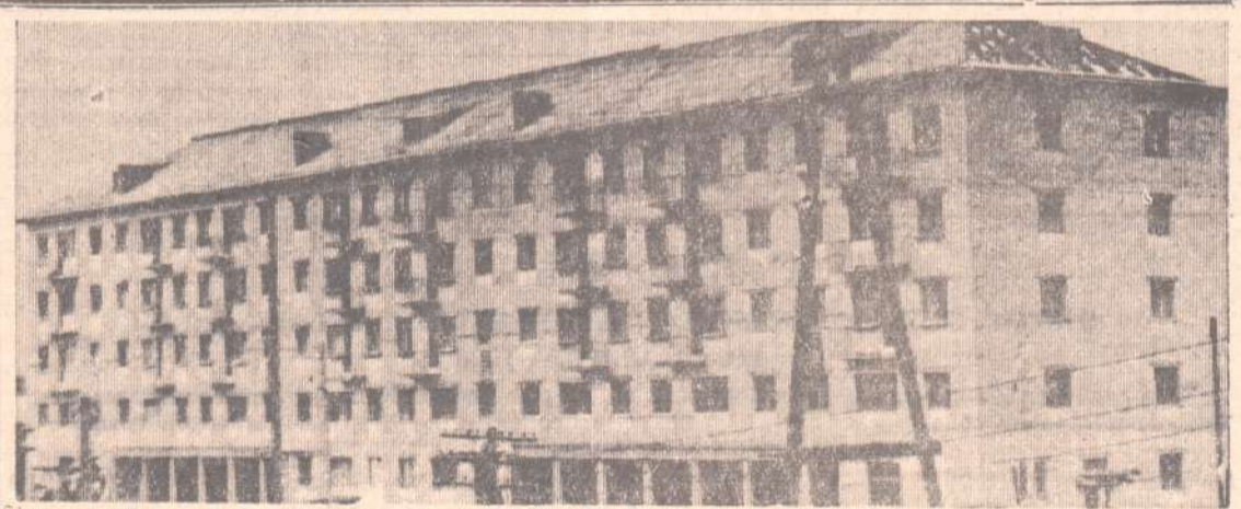
Пятиэтажный дом строят на улице Свободы на ст. Егоршино прорабский участок Дорстройтреста. На первом этаже дома будет расположено кафе.