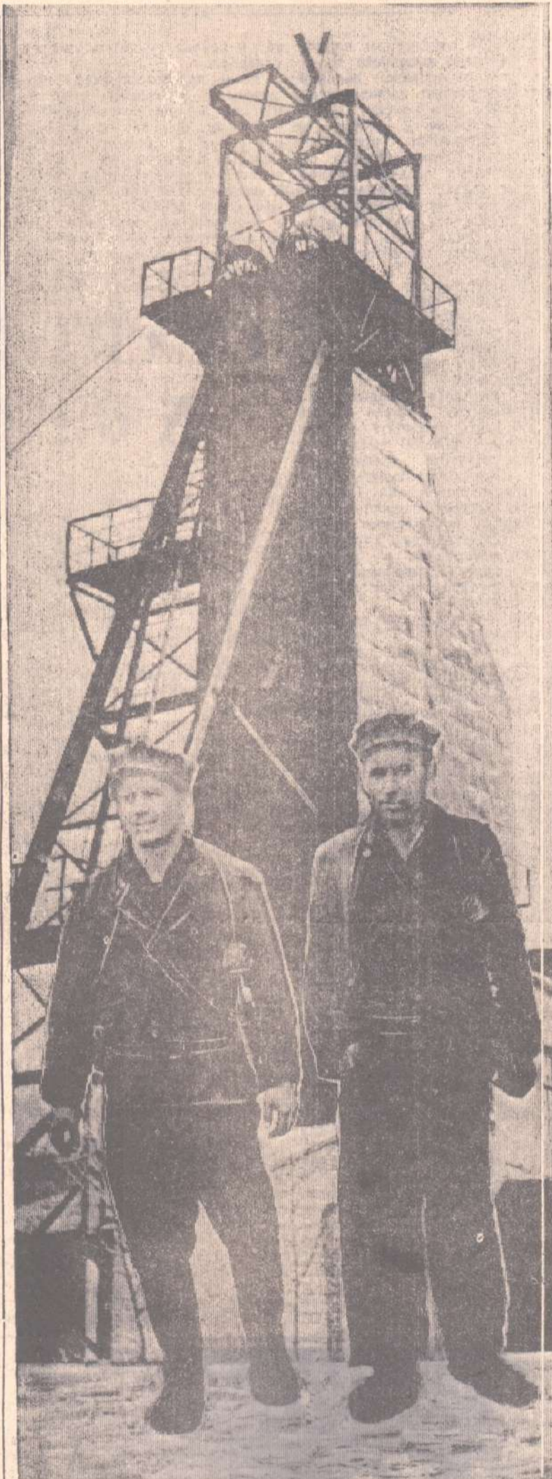
Фотоплакат В. Скулова.