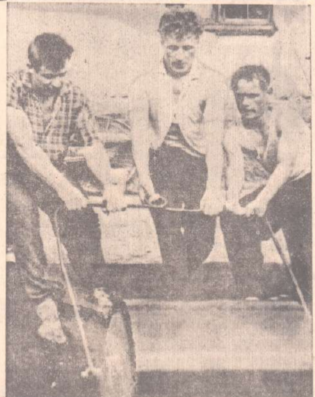
Редактор М. В. МАЛЫШЕВ.

В поселке Буланаш в это лето ведется большая работа по благоустройству улиц. На этом снимке запечатлен момент, когда жители улицы Механической асфальтировали тротуар возле дома № 13. Материал для асфальтирования сюда доставляет ЖКО, а жители на общественных началах делают тротуары и дорожки.