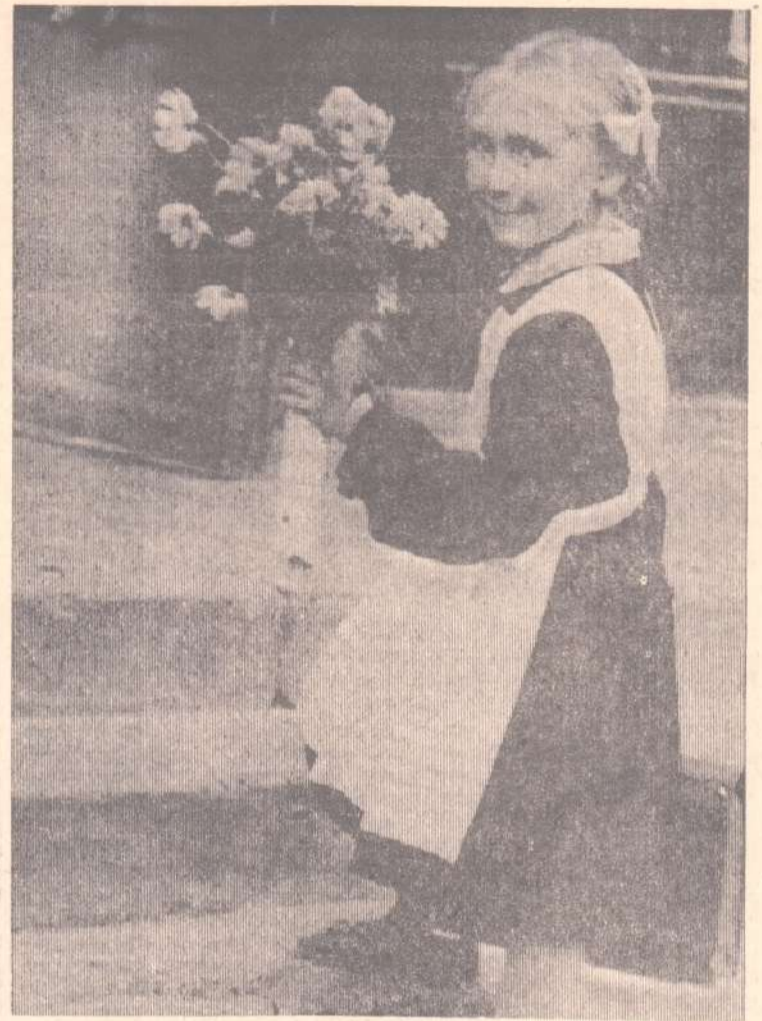
В ПЕРВЫЙ КЛАСС.