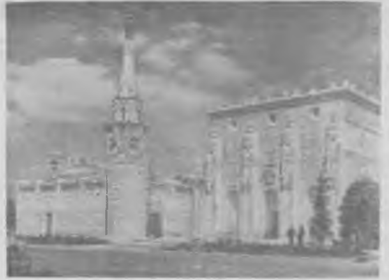
Москва. Всесоюзная сельскохозяйственная выставка. Павильон «Центральные области».