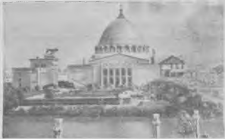
Москва. Всесоюзная сельскохозяйственная выставка. Павильон механизации и электрификации сельского хозяйства СССР.