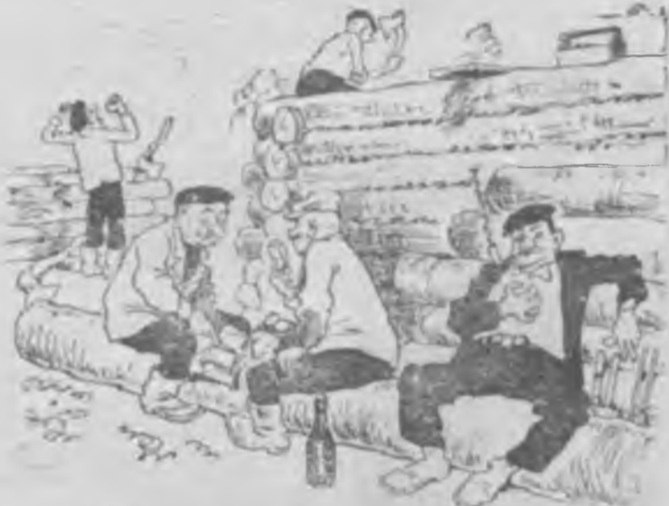
Обещаниям нет и счета, Но не движется работа.

Сегодня мы публикуем результаты выполнения социалистических обязательств шефствующими организациями в подшефных колхозах.