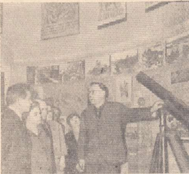
Москва. В Государственном историческом музее открылась выставка, посвященная 25-летию разгрома немецких фашистов под Москвой. НА СНИМКЕ: в одном из залов выставки.