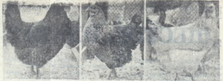
МОСКВА. На Выставке достижений народного хозяйства СССР проходит смотр домашней птицы лучших хозяйств страны.

На снимках вы видите некоторые виды кур, демонстрирующиеся на ВДНХ.