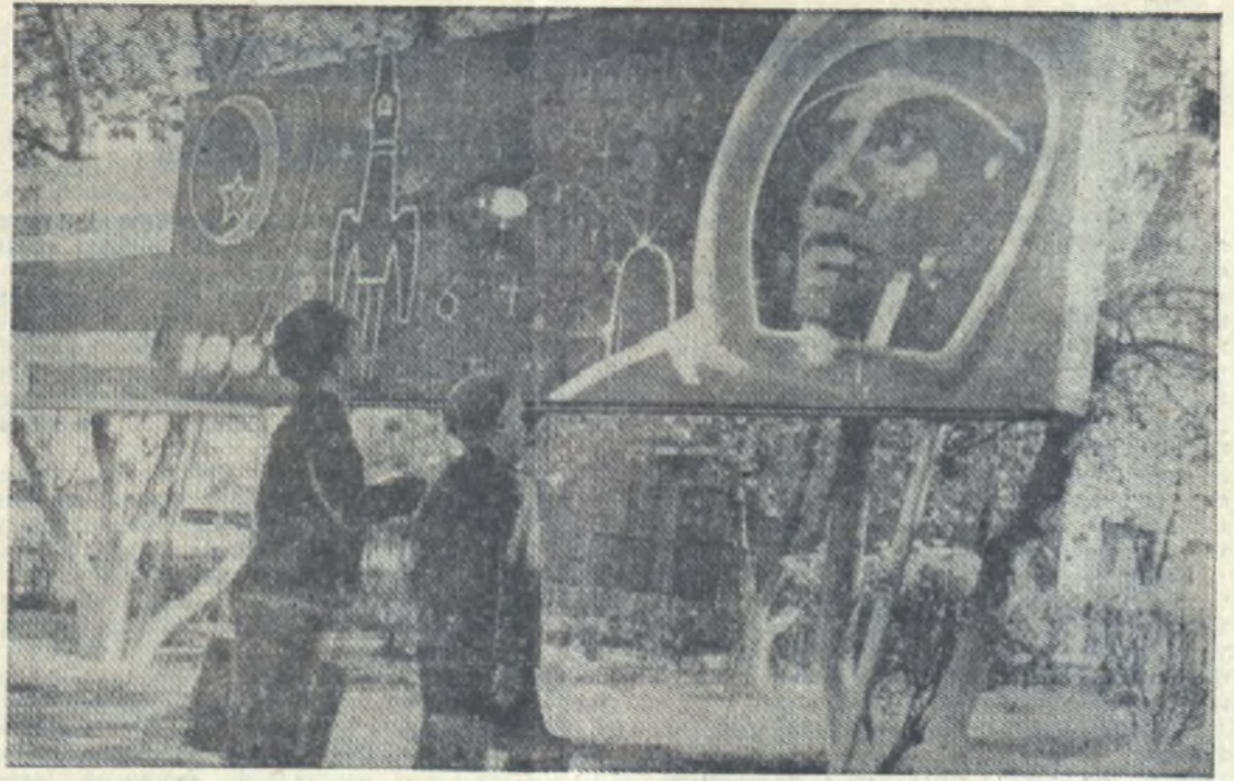
НАМ СКОРЕЙ БЫ ПОДРАСТИ.