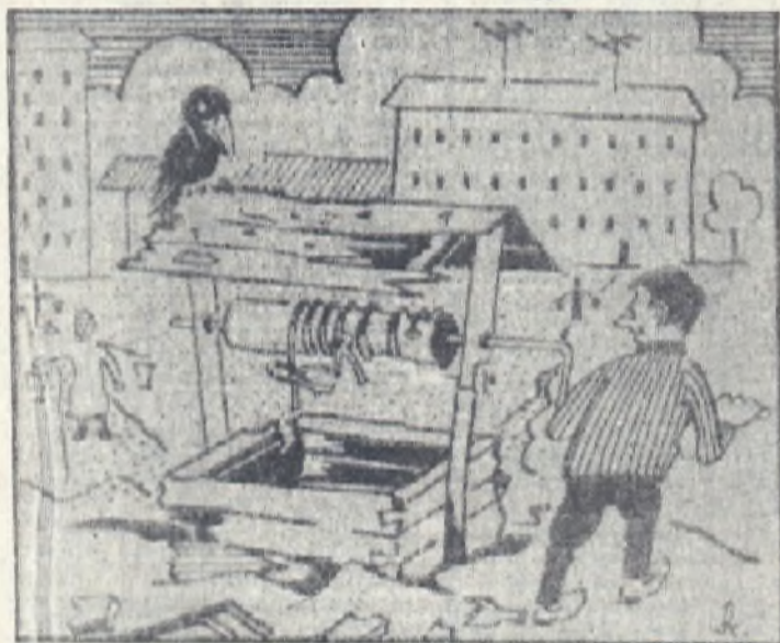
...Докаркала, последнее ведро утопил.