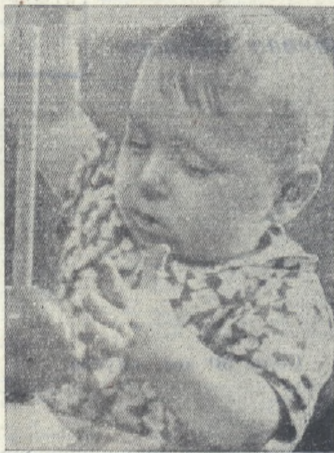
БУДУ СТРОИТЬ ГОРОДА.