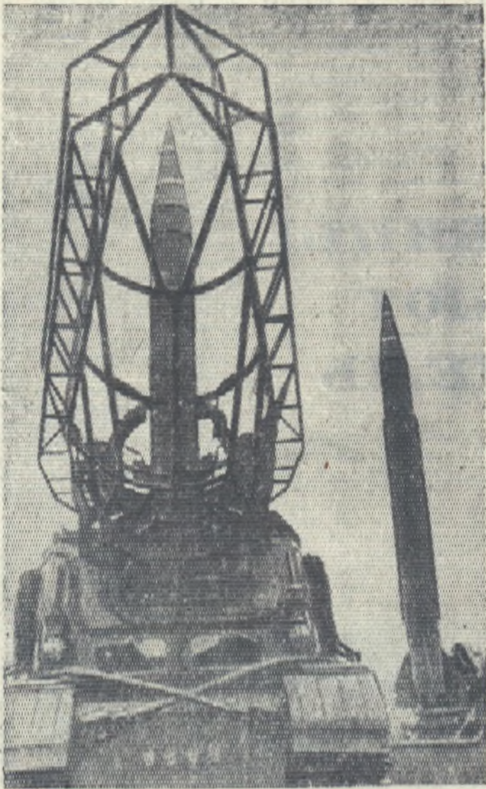
На стартовой позиции оперативно-тактические ракеты.

День ракетных войск и артиллерии — большой и радостный праздник. Советский народ чествует доблестных ракетчиков и артиллеристов, работников оборонной промышленности, чьим трудом создается первоклассная военная техника. Советская артиллерия получила боевую ваналку в гражданской войне. Она была главной огневой силой Советской Армии на полях сражений в Великой Отечественной войне. Наши воины-артиллеристы своим губительным огнем останавливали вражеские танки и пехоту в суровом 1941 году, в героическом наступлении Советской Армии обеспечивали успешный прорыв многочисленных оборонительных полос и «валов» немецко-фашистских войск, форсирование крупных рек, штурм крепостей, окружение и уничтожение крупных группировок врага.