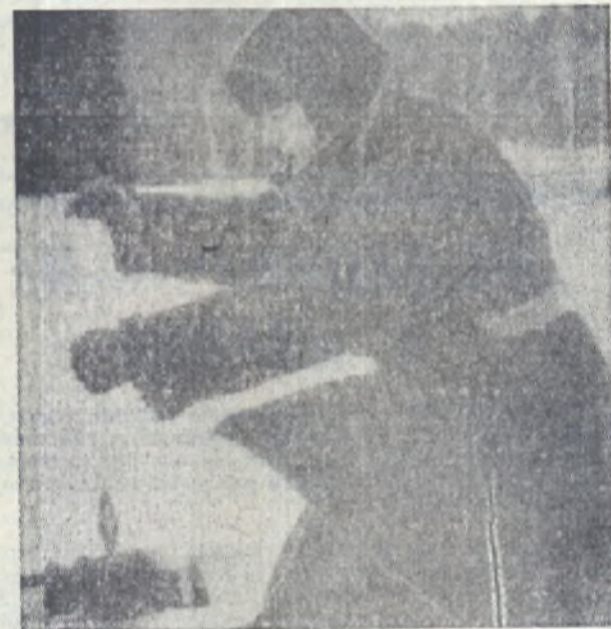
Ловись рыбка большая и маленькая.

Я на днях Дьякова встретил. — Что, брат, сумрачен, Не светел? — Огорчений, знаешь, масса! Осрамился, вот беда! Пал Семеныча гримаса Подвела меня тогда. Понимаешь, показалось, Что Кравчук ему не люб... — Ну, а что же оказалось? — Не Кравчук причиной — Зуб!