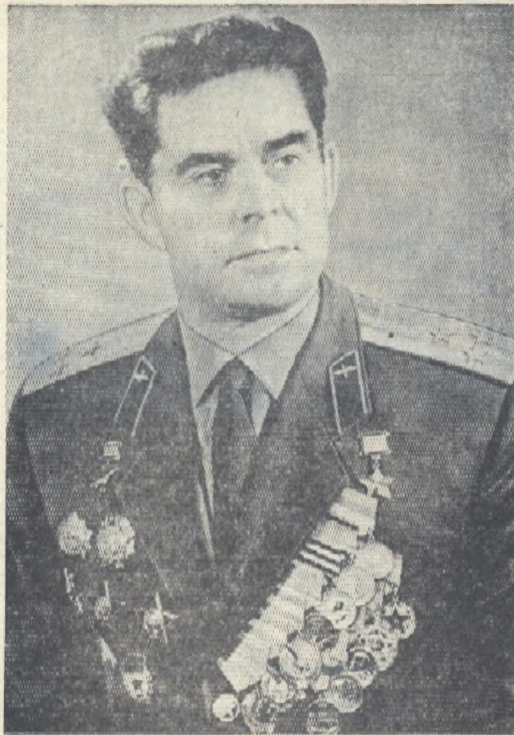
Советский летчик-космонавт—Герой Советского Союза—полковник Георгий Тимофеевич Береговой, командир космического корабля «Союз-3».