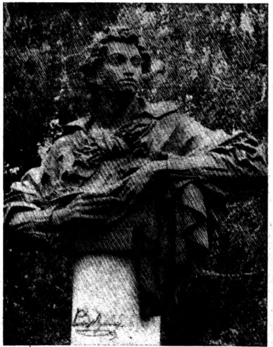
К НЕМУ НЕ ЗАРАСТЕТ НАРОДНАЯ ТРОПА.