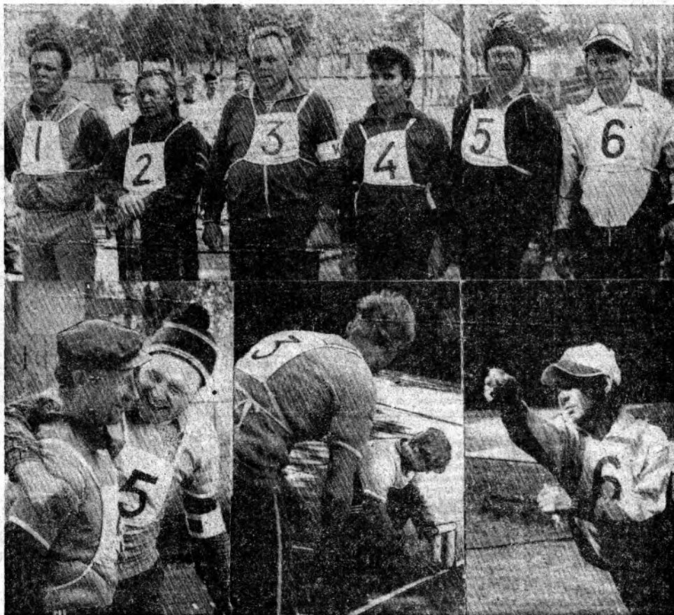
На снимках: команда-победительница «Сигнал-1»: игровые моменты.

От души желаем нашим землякам успешного выступления во всех последующих соревнованиях.