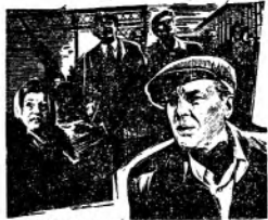
ОСОБО ВАЖНОЕ ЗАДАНИЕ

Режиссер-постановщик, исполнитель главной роли — народный артист СССР Евгений МАТВЕЕВ.