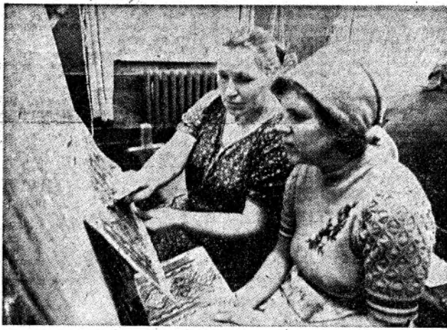
Ковры и паласы, выпускаемые Домом быта «Ворсника», хорошо знакомы артемовцам. Они украшают квартиры многих жителей города и поселка Мираново. Они работают здесь Тамара Федоровна и другие женщины. Это лучшие работников качествами и

А. ПРОПЦ, бригадир Центральной МТФ совхоза «Мирановский».