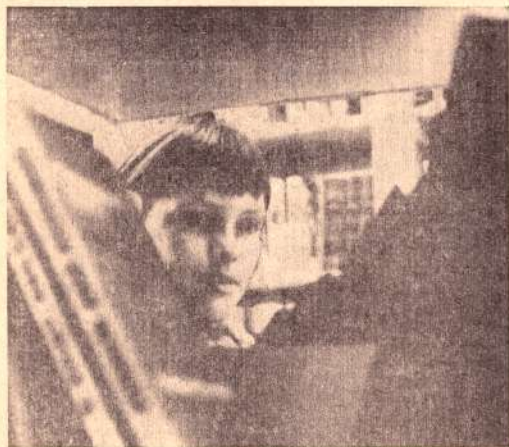
Ой, новая книга... Интересно, о чем она? Глазами, полными восторженного любопытства, смотрит девочка-школьница на библиотечный стеллаж.