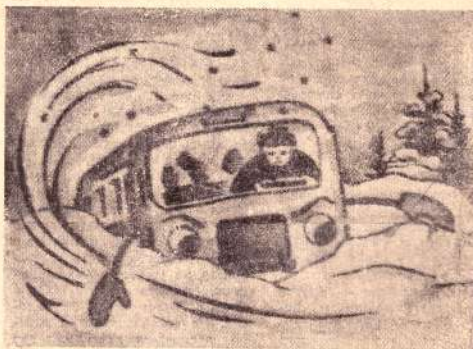
Рис. А. ЛУХНЕВА.

Мы в редакции, получив этот загадочный рисунок, долго думали, как лучше озвучить детские веселой фантазии художника. К единому мнению мы так и не пришли. Поэтому решили обратиться к помощи наших читателей. Итак, объявляем