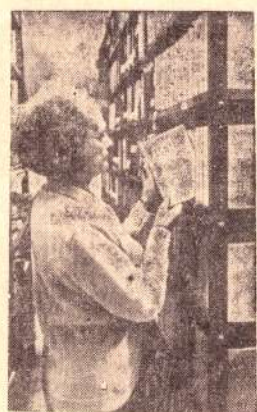
Чехословакия. Более полутысячи слушателей посещают вечерний университет марксизма-ленинизма в Праге. Этот учебный год посвящен 100-летию со дня рождения В. И. Ленина.

На снимке: в библиотеке университета. В ней насчитывается свыше 50 тысяч томов произведений классиков марксизма-ленинизма.