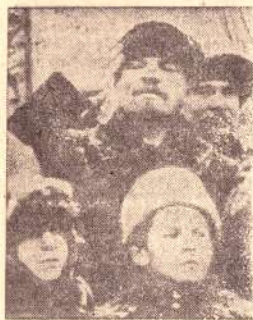
В. И. Ленин на Красной площади во время празднования 2-й годовщины Великой Октябрьской социалистической революции. Москва, 7 ноября 1919 года. (Верхний снимок).