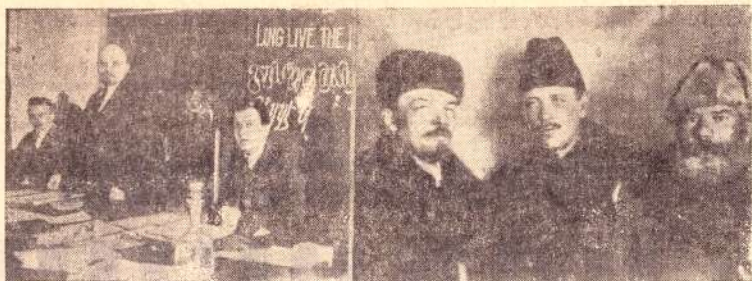
В. И. Ленин в президиуме I конгресса Коминтерна в Кремле. Слева направо: Г. Эберлейн, В. И. Ленин и Ф. Платтен. Москва, 2-6 марта 1919 года.