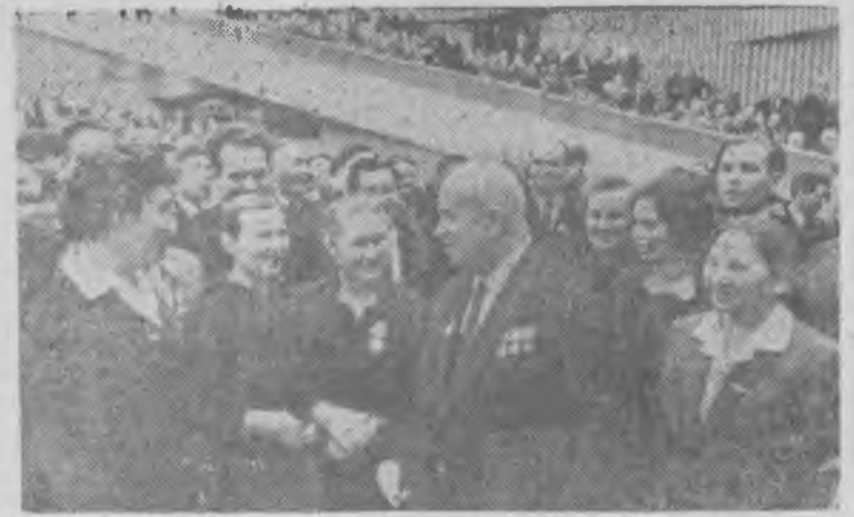
Н. С. Хрущев среди делегатов XXII съезда КПСС.

Говорят, крылья крепнут в полете. И верно: стремление внести посильный вклад в фонд развития химической промышленности еще больше сплотило коллектив. Чувство локтя, взаимовыручка и взаимный