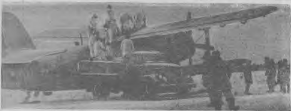
НА СНИМКЕ: загрузка самолета химикатами.