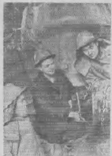
Казахская ССР Коллектив Кировского строительного управления комбината «Карагандашахтострой» осваивает ствольную проходческую машину «ПД-1Р». На шахте № 35-бис пройдены первые 184 метра ствола. Среднемесячные темпы проходки составляют 42 метра. Машина «ПД-1Р» дает большой экономический эффект. Применение ее по сравнению с другими способами проходки сокращает число рабочих почти в три раза. Вступив в предмайское соревнование, шахтостроители наметили новый рубеж — пройти машиной «ПД-1Р» сто метров ствола в месяц.

В 1962 году в социалистическом соревновании между шоферами мне удалось завоевать первое место, за что получил путевку на ВДНХ в Москву. Полтора года назад мне присвоили звание ударника коммунистического труда, которое я стараюсь носить с честью.