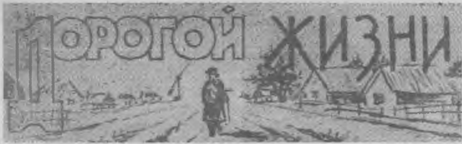
(Окончание. Нач. на 3 стр.)

солдата, образованного человека, говорившего на 11 языках, переписывающегося с В. И. Лениным. Боясь революционного движения среди солдат, французские власти выслали для охраны лагеря 31 полк и две артиллерийские бригады. Потом началось разоружение полка и аресты. Одиннадцать самых активных, в том числе и Лев Фадеевич, были арестованы. Месяц в холодной темноте одиночки с покрытыми плесенью стенами. После одиночки — Марсель. Ему надели наручники и повели на пристань. Опасаясь бунта, правительство решило отправить русских подальше от своих берегов.