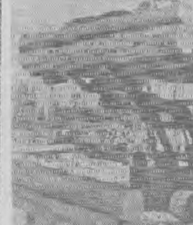
«Добычей» лесных богатств занята мощная техника. Вы видите погрузчик леса в Больше-Окинском лесхозе Иркутской области.