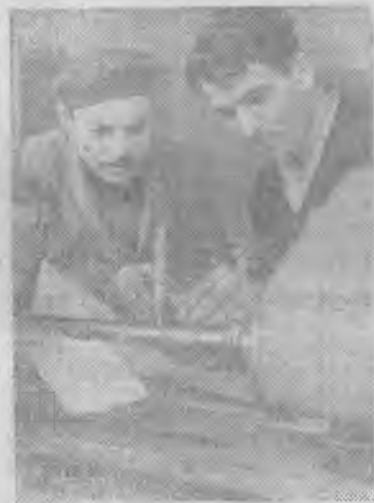
АРМЯНСКАЯ ССР. По вечерам, когда управление Киро-

ваканского завода предационных станков уже не работает, в кабинетах можно встретить людей. Это инженеры консультируют рабочих и служащих — студентов заочного и вечернего отделения филиала Ереванского политехнического института. На предприятии созданы также на общественных началах по инициативе коммунистов конструкторское бюро помощи рационализаторам, цех внедрения рационализаторских предложений и другие организации.