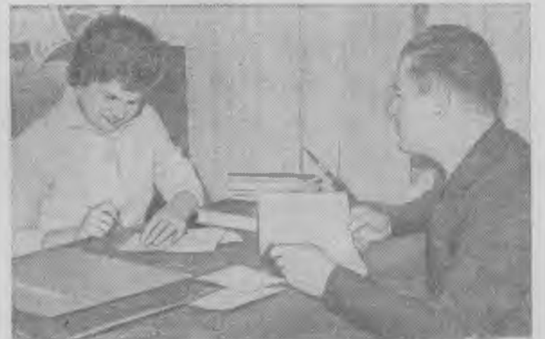
Космонавты Валентина Николаевна Терешкова и Андриян Николаев у себя дома во время занятий.