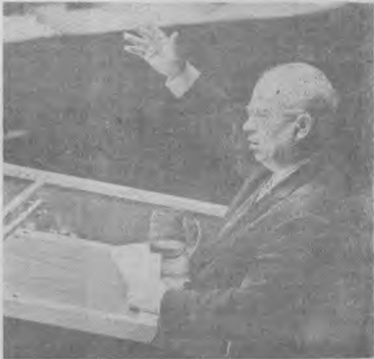
Нью-Йорк. Выступление Н. С. Хрущева на XV сессии Генеральной Ассамблеи Организации Объединенных Наций (1 октября 1960 г.).