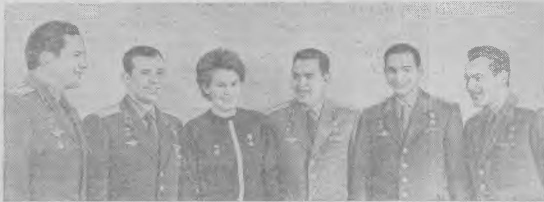
Герои Советского Союза летчики-космонавты (слева направо) подполковник Павел Попович, полковник Юрий Гагарин, Валентина Николаева-Терешкова, подполковник Андриян Николаев, подполковник Валерий Быковский и подполковник Герман Титов

Выдающиеся успехи нашей страны в завоевании космоса — славная победа труда, мысли и разума советского человека.