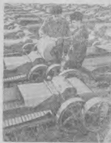
Черновицкий инструментальный завод начал выпуск для сельского хозяйства модернизированных соломосилосорезок. В этом году будет изготовлено 6700 таких машин. НА СНИМКЕ: соломосилосорезки на отгрузочной площадке завода.

Н ЕМАЛО в Артемовском магазине, столовых. Разнообразен ассортимент товаров. Сразу видно, что снабжение горожан в целом не плохое, хотя, конечно, бывают временные перебои в торговле и кое-чего не хватает. Это беспокоит всех работников прилавка и общепита и в особенности коммунистов.