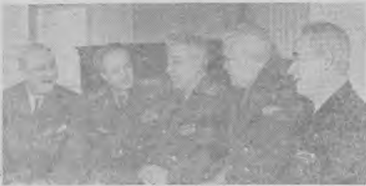
НА СНИМКЕ: первые Герои Советского Союза летчики полярной авиации (слева направо) М. Т. Слепнев, Н. П. Каманин, А. В. Ляпидевский, М. В. Водопьянов и В. С. Молоков, принимавшие участие в спасении челюскинцев.