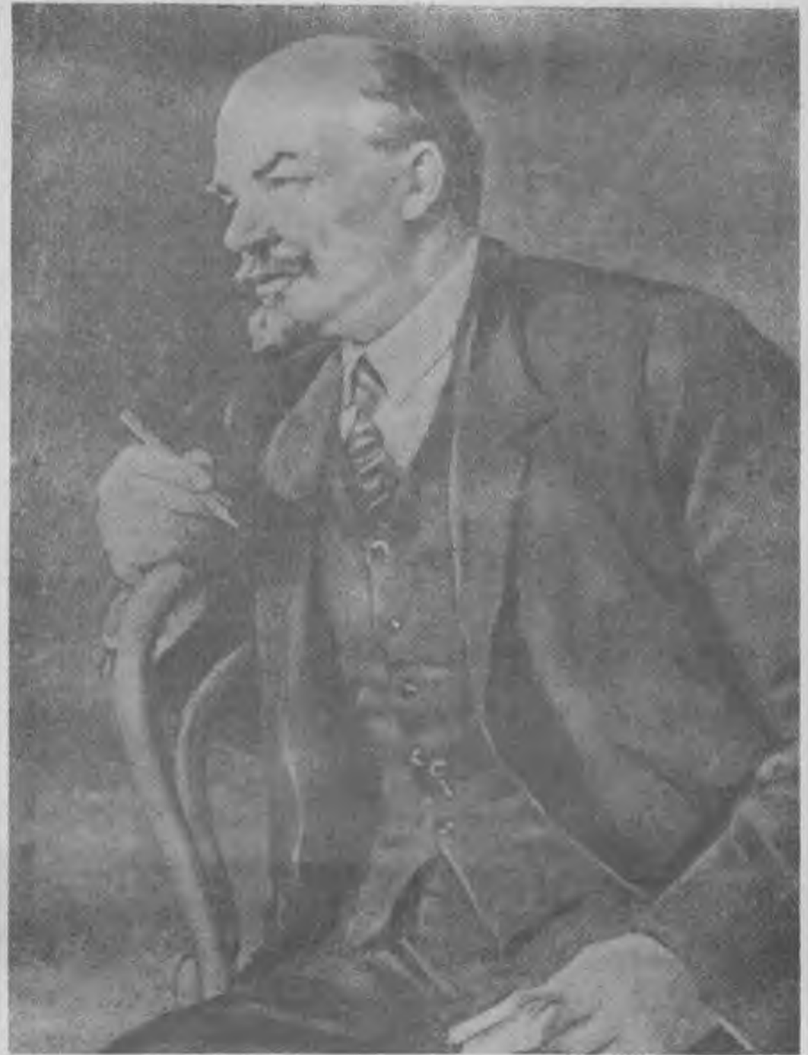
ВЛАДИМИР ИЛЬИЧ ЛЕНИН

Наше предприятие поставляет продукцию в основном для сельского хозяйства. За первый квартал отгружено совхозам Свердловской области 36 ты-