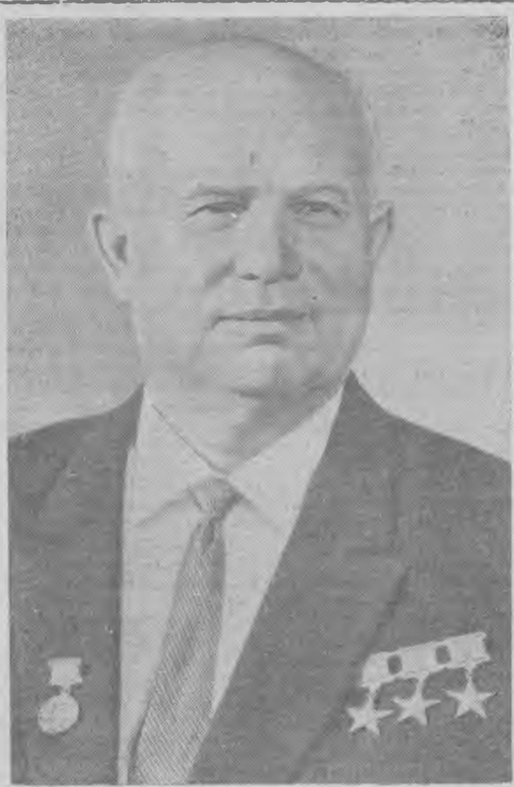
Хрущев Н. С. — Первый секретарь ЦК КПСС, Председатель Совета Министров СССР.

тельность обеспечили ему выдающую роль во всей огромной организаторской и теоретической работе ленинского ЦК во всех областях нашей внутренней и внешней политики. За большие заслуги перед нацией и государством Никита Сергеевич трижды удостоен высокого звания Героя Социалистического Труда. За выдающуюся деятельность во имя укрепления мира ему присуждена Международная Ленинская премия мира. Жизненный путь Н. С. Хрущева, как и других советских руководителей, — яркое подтверждение глубокой народности нашего строя и Коммунистической партии.