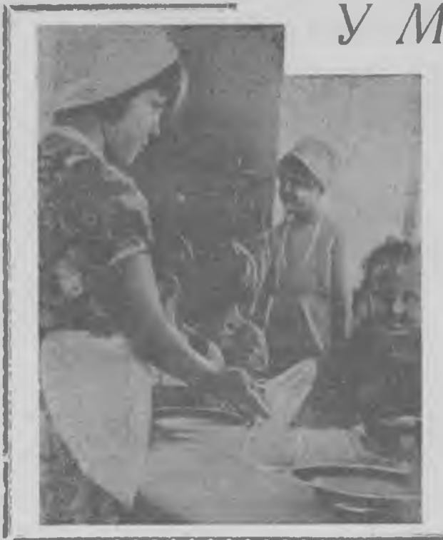
Навстречу областному смотру