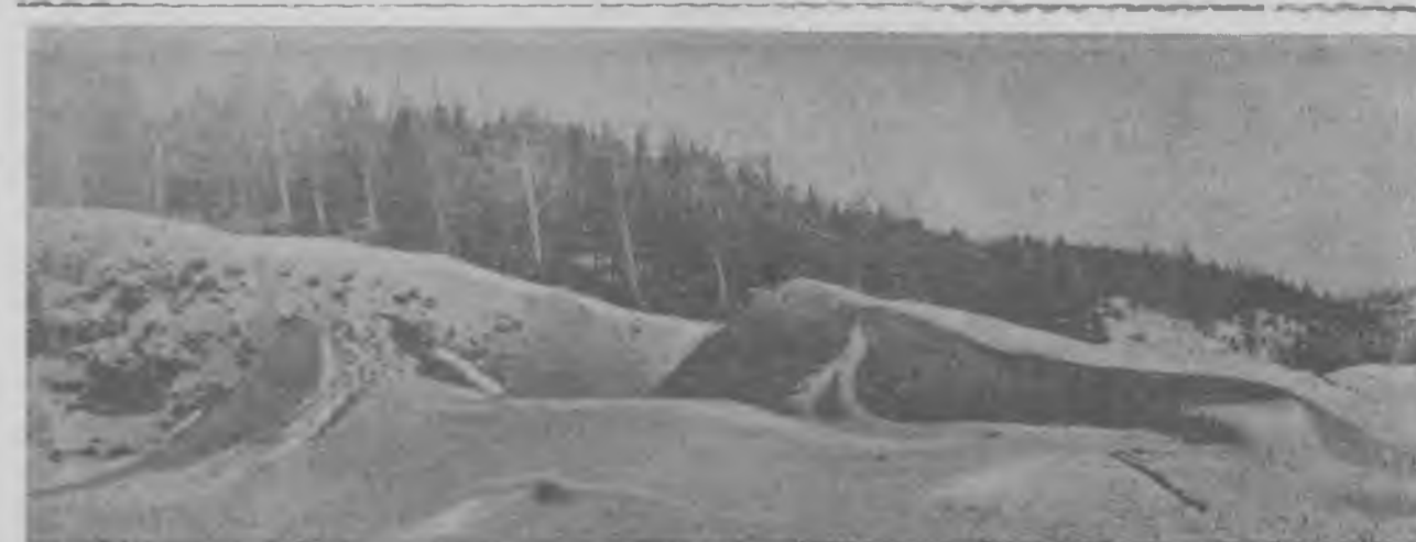
А в лесу еще глубокий снег.