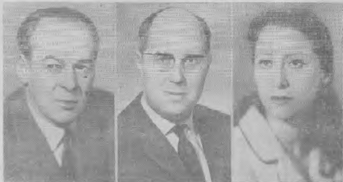
Н. К. Черкасов