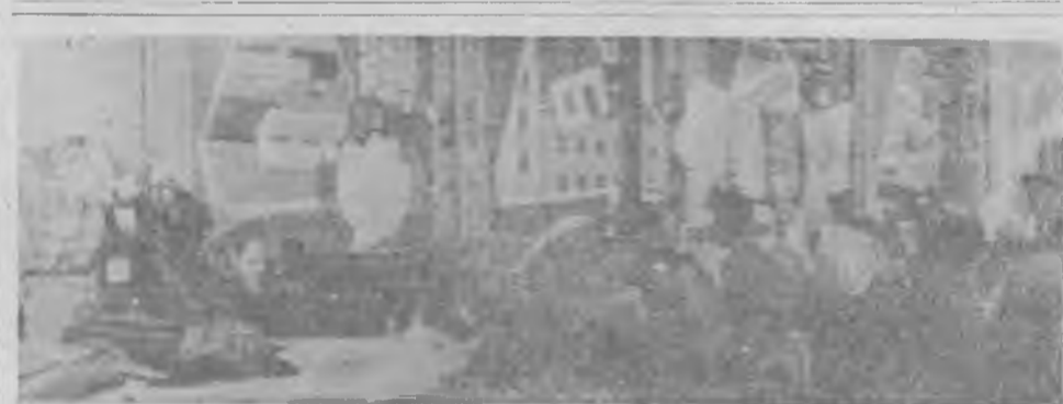
В минувшее воскресенье Артемовский торг провел ярмарку, в которой приняли участие 20 магазинов и 5 буфетов.