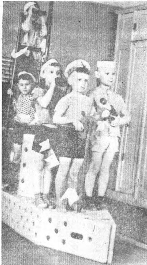
Будущие капитаны океанских лайнеров.