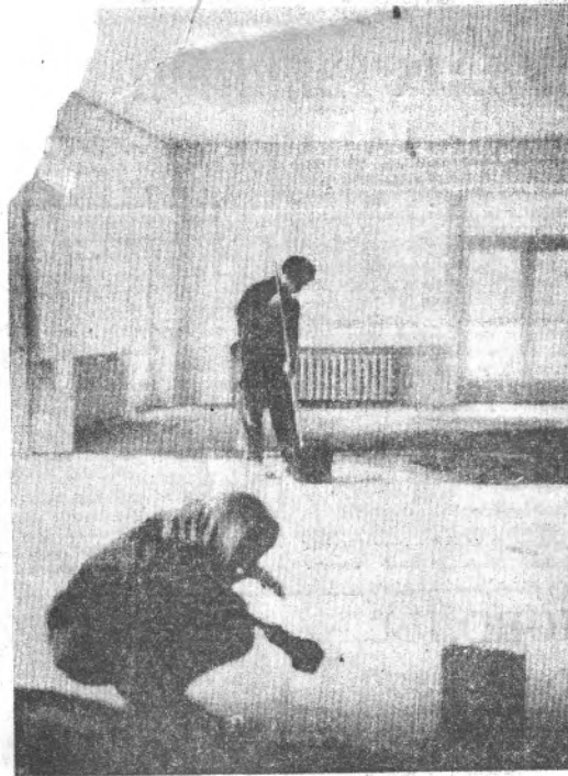
СКОРО БУДЕТ НОВОСЕЛЬЕ!