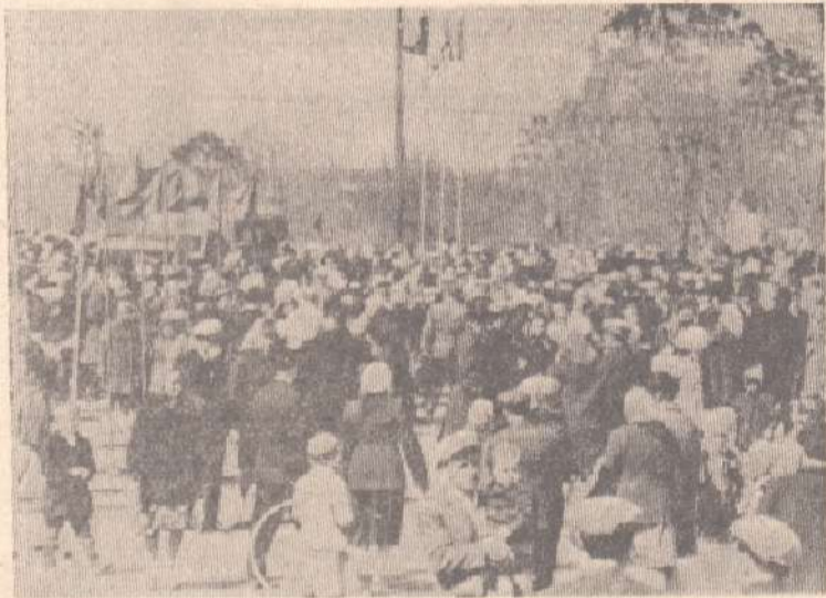
1 мая на площади Советов после демонстрации.

В 1966 году журналы получили 18 миллионов новых подписчиков.