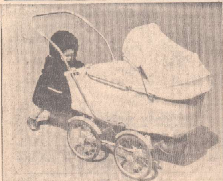
«...Люби и саночки возить».