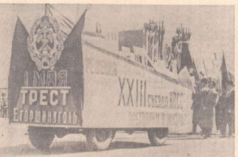
Такие праздничные макеты были в колоннах машиностроителей, железнодорожников и горняков.