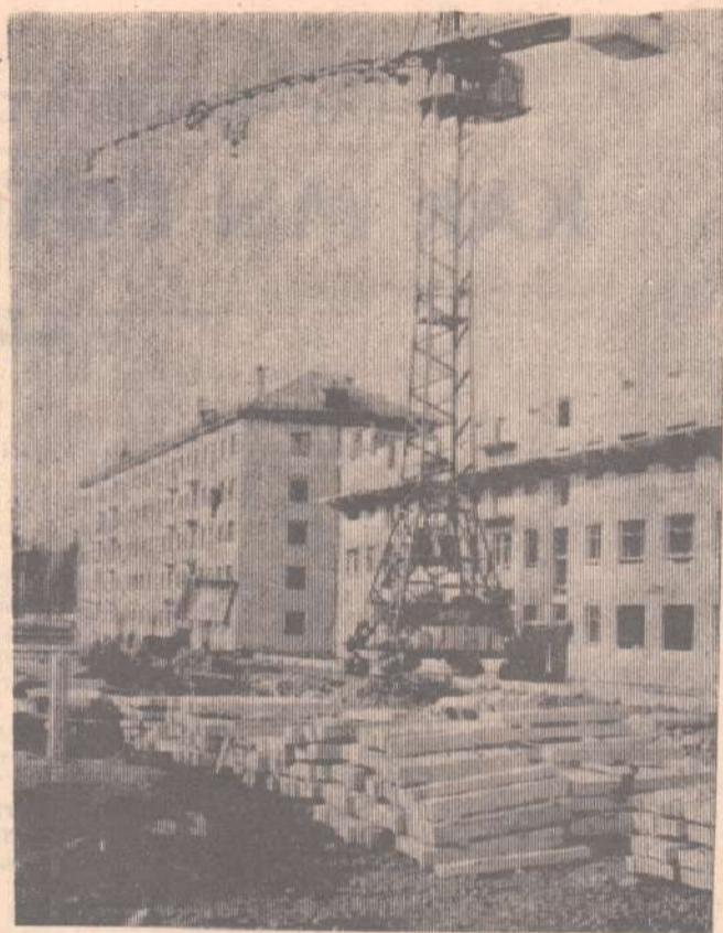
Строится поселок горняков Буланаш. Недавно в нем появилась новая улица Шахтостроителей. Оча состоит пока что из одного пятиэтажного дома, но рядом с ним уже строится второе здание. Сейчас строители заканчивают кладку стен последнего пятого этажа.