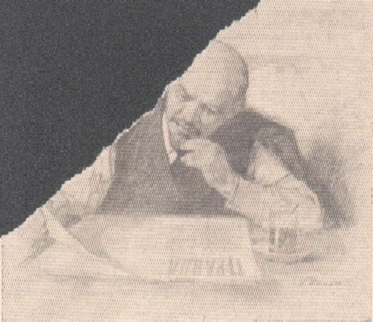
В. И. Ленин за чтением газеты «Правда».