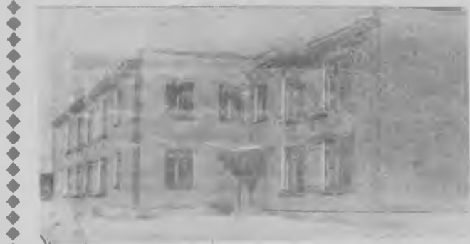
Скоро вступит в строй действующих новый детский комбинат на станции Егоршино.

Но время предъявляет новые требования, и то, что сделано, никого не может удовлетворить. Есть и нерешенные задачи. Не все, например, благополучно с санитарной очисткой территории, нуждается в