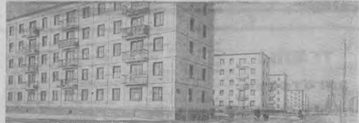
Дагестанская АССР. За последние два года произошли большие изменения в городе Махачкале. Здесь образовано много новых избирательных округов. Каждый из них — это новые массивы жилых домов, общественных зданий. Избирательный округ № 53 расположен на бывшей окраине. Здесь воздвигнуты многоэтаж-

Но успехи, отметили народные контролеры, могли быть гораздо лучше, если бы уделялось больше внимания не только улучшению рациона кормления животных и птицы, но и широкому внедрению механизации труда рабочих, постоянной заботе о повышении квалификации кадров животноводов.