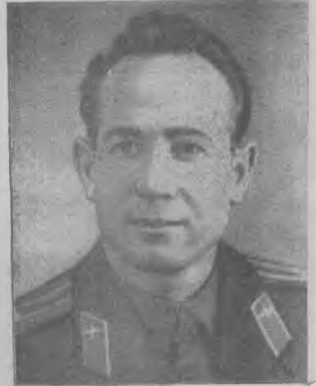
Второй пилот корабля летчик-космонавт подполковник Алексей Архипович Леонов.