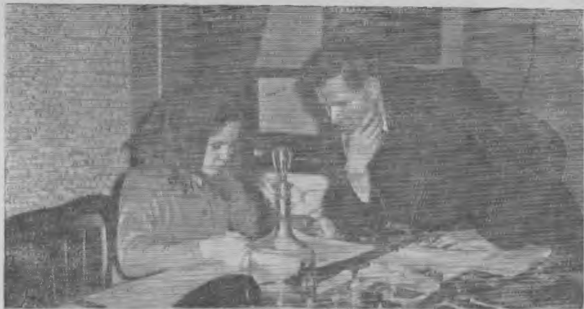
На агитпункте, расположенном в железнодорожном клубе им. Кирова, прошли многочисленные встречи избирателей с кандидатами в областной и городской Совет депутатов трудящихся. Сейчас участковая избирательная комиссия.

агитаторы организуют проверку списков избирателей.