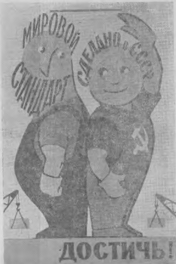
ПЛАКАТ ХУДОЖНИКА В. ГОВОРКОВА (издательство «Советский художник»).

Возьмем, к примеру, соблюдение технологической дисциплины. На многих предприятиях часто допускают всякого рода отклонения от чертежей, от принятой