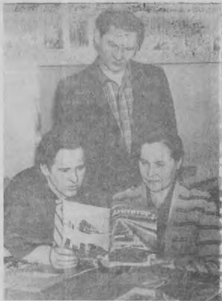
Им оказано доверие