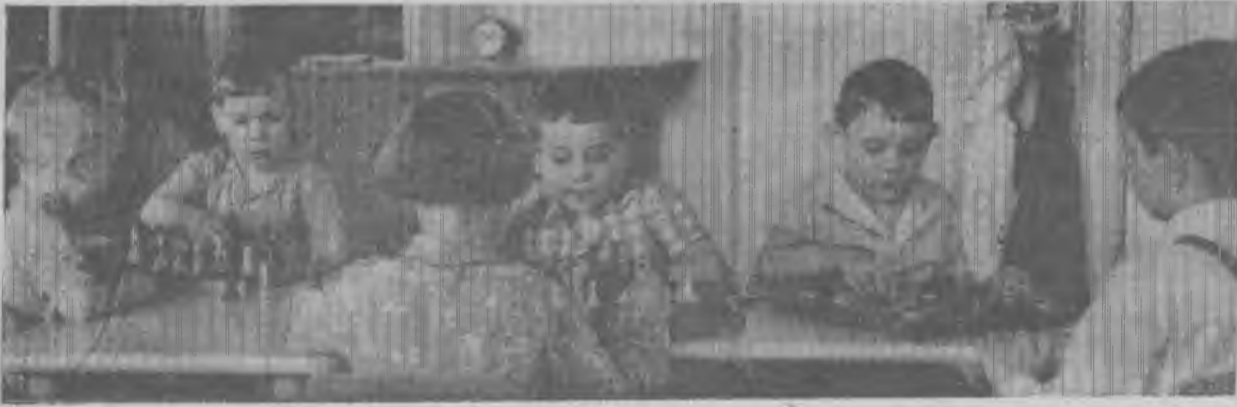
Шахматно-шашечные баталии в детском саду № 24 Артемовского машиностроительного завода