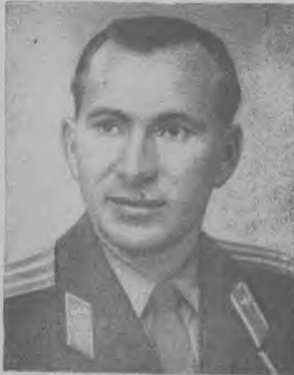
Командир космического корабля-спутника «Восход-2» летчик-космонавт полковник Павел Иванович Беляев.